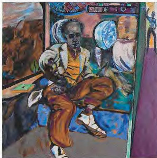
R. B. Kitaj, The Jewish Rider , 1984/85; © Astrup Fearnley Museum of Modern Art, Oslo; © R. B. Kitaj Estate.

Kritiker nahmen damals daran Anstoß, dass der jüdische Maler es wagte, sich des christlichen Themas des „zwölfjährigen Jesu im Tempel“ anzunehmen, und insbesondere, dass er den Heiland als „Judenbengel“ von der Straße darstellte. Liebermann wurde vorgeworfen, er sei zu sehr von der traditionellen Darstellungsweise des jungen Christus als eines den jüdischen Gelehrten intellektuell überlegenen, gottbegnadeten jungen Mannes abgewichen.