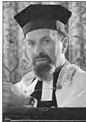
Rabbiner Felix Carlebach/ Rabbi Felix Carlebach

Der Künstler war entsetzt von den Anwürfen und übermalte in den folgenden Jahren die Figur des Jesu. 8 Wir haben nun die Gelegenheit, die Geschichte von Spaltung und Vorurteil und die fortdauernden Widerstände (möglicherweise auch unsere eigenen) gegen Grenzüberschreitungen und Kreuzungen in religiöser Bildsprache zu reflektieren, und wir haben die Möglichkeit, auf Offenheit und Dialog zu setzen. Die „Überkreuzungen“ in Nachbarn manifestieren sich nicht als Uneinigkeit, sondern vielmehr als optimistische Interventionen mit der Absicht, Grenzen zu „überqueren“, zu überwinden. Sie funktionieren sowohl auf der Bildebene als auch über die erzählten Geschichten.