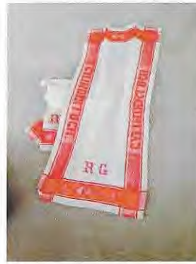
Cylindertuch, Familie Carlebach/Napkin of cylinder, Carlebach-family © Photo Sula Leon, London.

Als ich im Zusammenhang mit der Ausstellung Nachbarn von dem Carlebach-Cylindertuch hörte, dachte ich mir gleich, dass das zurückgegebene Tuch, wenn es wirk-