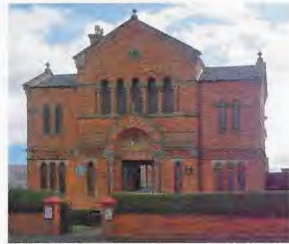
Manchester Jewish Museum

tion consists of many Russian Jews. The new building is a plain, rectangular modern building. The one it replaced, consecrated in December 1890, shared a characteristic oriental style with many synagogues of the nineteenth century, including the synagogue in Lübeck, consecrated in 1880. Here, this time in the realm of architecture, we find another crossing of cultural and religious borders in the visual field. The great Oranienburgerstrasse synagogue in Berlin, designed by Eduard Knoblauch and built in 1866 (destroyed in 1938), was also Moorish in style. In Manchester, the Spanish and Portuguese Synagogue in Cheetham, now the Manchester Jewish Museum, was designed by Edward Salomons in 1873-4, in Moorish style and said to be inspired by the Alhambra. 9