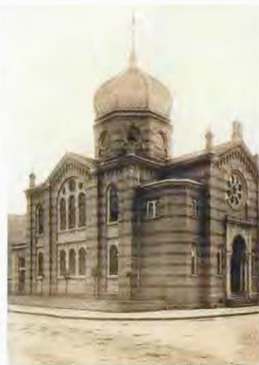
Synagoge/Synagogue, Saarbrücken, © Photo Janet Wolff

Lange Zeit haben viele Juden im 19. Jahrhundert selbstbewusst ihre „orientalischen“ Wurzeln und ihre „orientalische“ Rasse betont ... Es galt als pres-