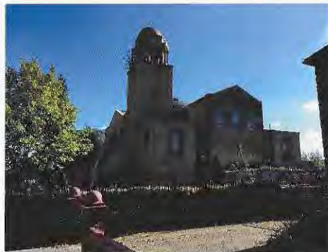
South Manchester Synagogue.

Ein Freund der Familie zeigte uns in Saarbrücken die jüdischen Friedhöfe und die Synagoge. Wie die meisten Synagogen in Deutschland – hier bildet die Lübecker Synagoge eine Ausnahme – war auch die ehemalige Synagoge in Saarbrücken in der Reichspogromnacht zerstört worden. Die neue Synagoge wurde im