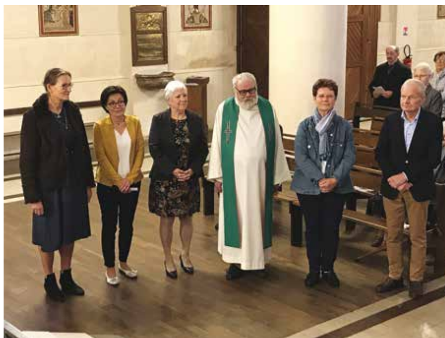
■ La nouvelle équipe.