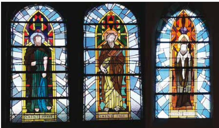
■ Les trois vitraux.