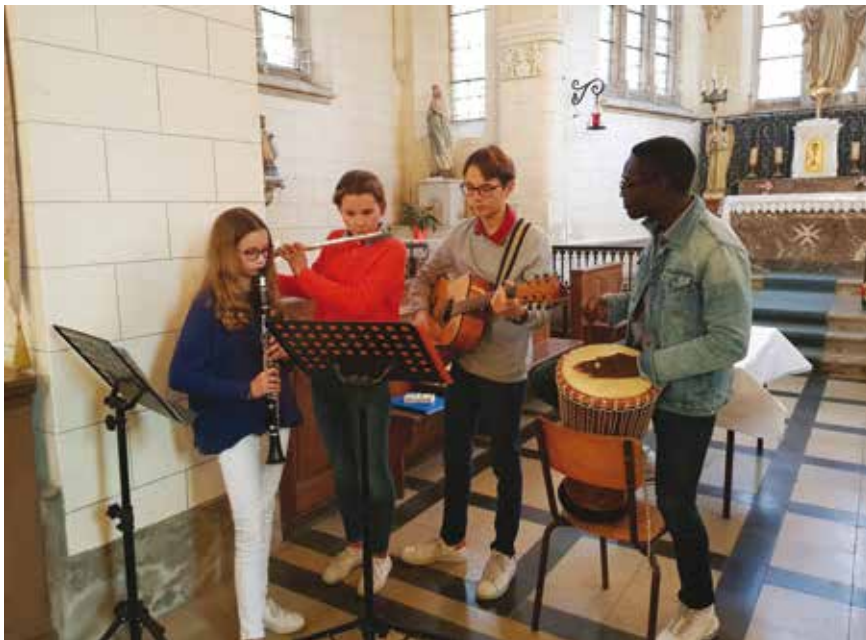
■ L'équipe des jeunes de la paroisse en pleine prestation.

du Notre Père : les mains se sont jointes pour faire une chaîne. Tous les 3 e samedis de chaque mois, ils animeront les messes dominicales le samedi à 18h dans les différentes églises de village de la paroisse. Un grand merci à nos Jeunes pour ce nouveau souffle.