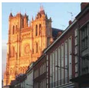
SECTEUR / P4 Une vieille dame de 800 ans