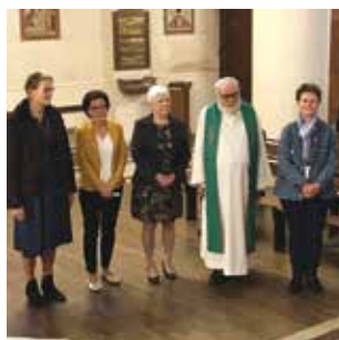
NESLE / P8 Une nouvelle équipe de conduite pastorale (ECP)