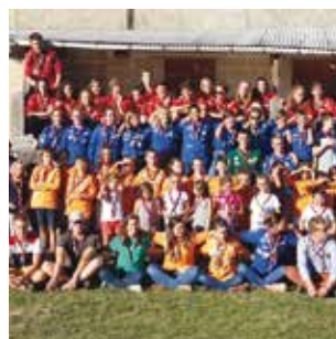
SECTEUR / P16 Rentrée des scouts