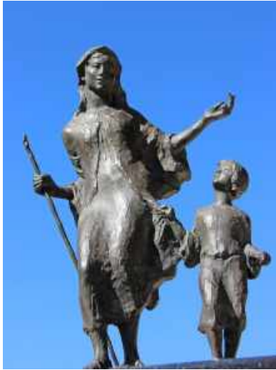
Nuestra Señora del Camino

El nombre marista no es un título vacío. Vamos, si somos maristas, hay que verlo en nuestra conducta.