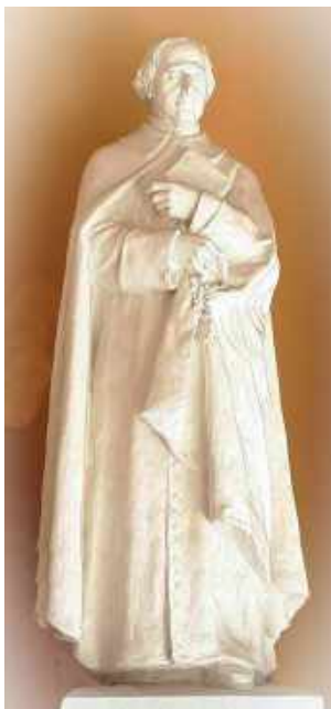
Villa Santa Maria, Roma