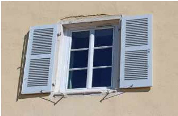
Ventana de la habitación del P. Colin

Colin tuvo problemas de salud de por vida. La malaria no era más que una de sus enfermedades (FA 222; 230). Él usó los remedios disponibles.