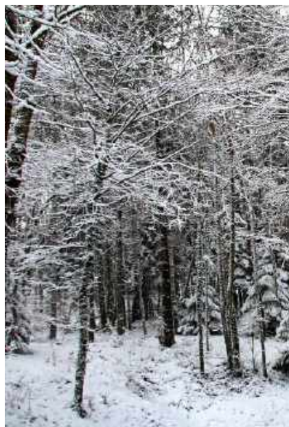
Nieve en el Bugey