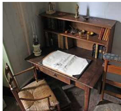
Escritorio del P. Colin

Colin era conocido por ser muy lento en tomar una decisión.