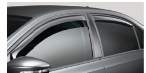
Défecteurs de vitres latérales