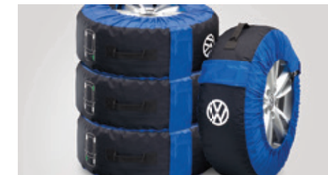
Housse de pneu Volkswagen