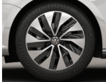
Roue en alliage « Buenos Aires » de 17 po Hybride turbocompressée