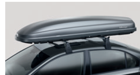
Caisson de chargement amovible