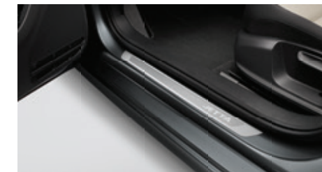
Protecteur de seuil de porte