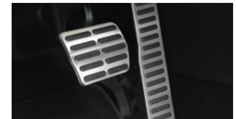
Couvre-pédales, jeu sport