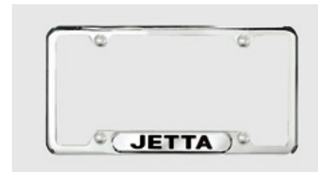
Cadre de plaque d'immatriculation