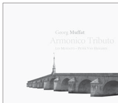
G. MUFFAT, Armonico Tributo RAM 0502