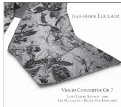
J.-M. LECLAIR, Violin Concertos Op. 7 RAM 1202