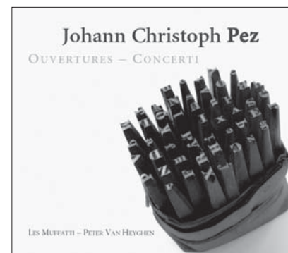
J. C. PEZ, Ouvertures - Concerti RAM 0705