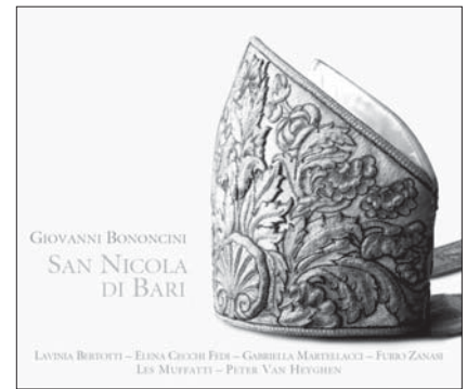
G. BONONCINI, San Nicola di Bari RAM 0806