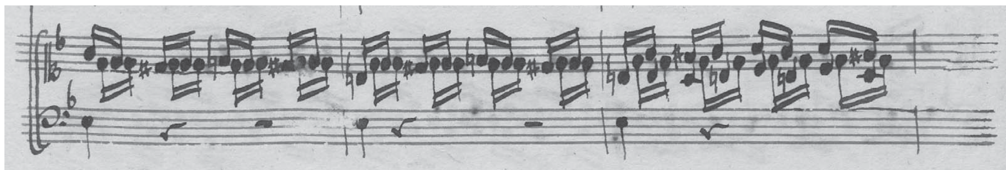
Detail of the Sinfonia from Cantata BWV 146