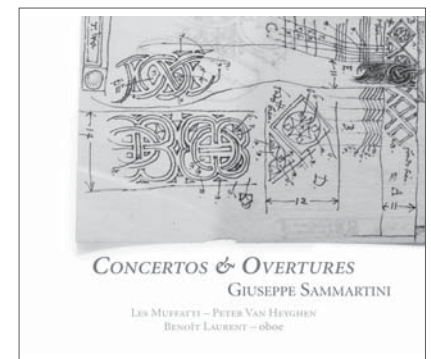
G. SAMMARTINI, Concertos & Overtures RAM 1008