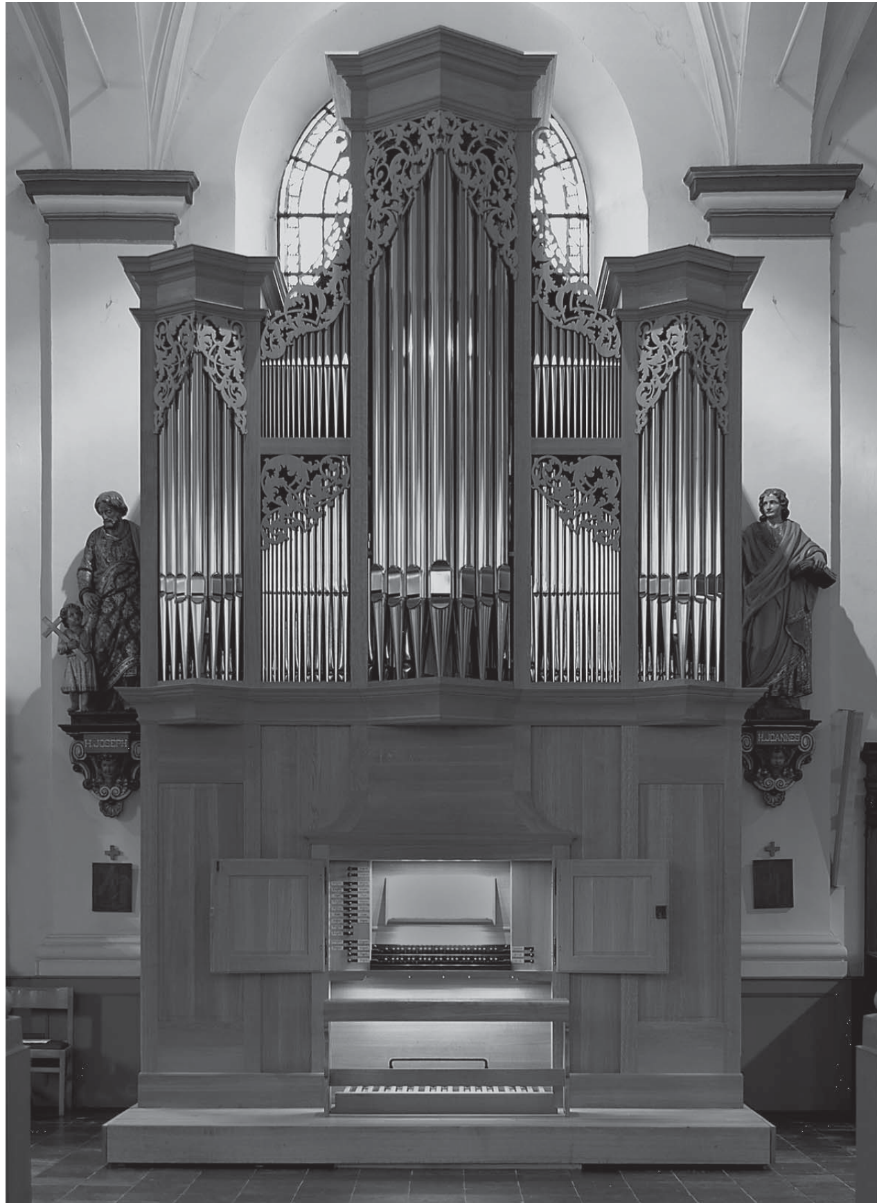
The Thomas organ in Bornem