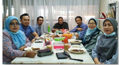
Penulis makan mee Tauhu bersama rakan-rakan staf ibu pejabat