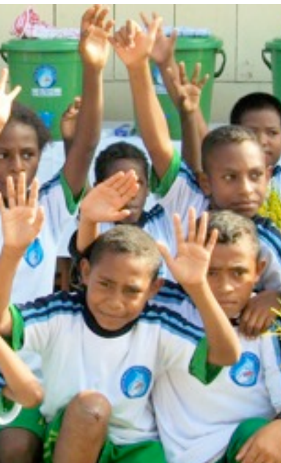
Anak-anak Papua ikut merayakan kemerdekaan HKN ke-45 tahun 2009

berperilaku Hidup Bersih dan Sehat serta menjaga dan meningkatkan derajat kesehatan bagi orang lain yang menjadi tanggung jawabnya.