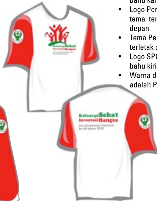
CONTOH KAOS BIASA