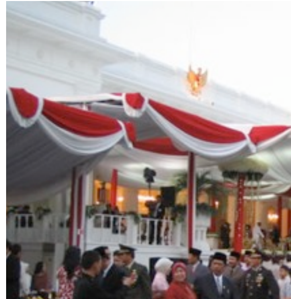
Istana Merdeka : Rencana tempat dilangsungkannya Acara Puncak HKN ke-46