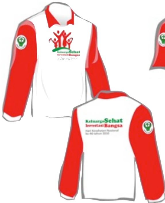
CONTOH KAOS VIP (BERKERAH)