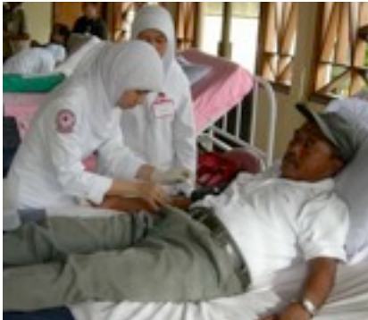
Donor darah : Salah satu kegiatan bakti sosial yang dilaksanakan dalam rangka peringatan HKN ke-46