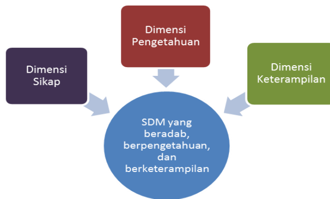
Gambar 1. Dimensi Kompetensi

IPA atau sains adalah upaya sistematis untuk menciptakan, membangun, dan mengorganisasikan pengetahuan tentang gejala alam. Upaya ini berawal dari sifat dasar manusia yang penuh dengan rasa ingin tahu. Rasa ingin tahu ini kemudian ditindaklanjuti dengan penyelidikan dalam rangka mencari penjelasan yang paling sederhana namun akurat dan konsisten untuk menjelaskan dan memprediksi gejala-gejala alam. Penyelidikan ini dilakukan dengan mengintegrasikan kerja ilmiah dan keselamatan kerja yang meliputi kegiatan mengamati, merumuskan masalah, merumuskan hipotesis, merancang percobaan, mengumpulkan data, menganalisis, akhirnya menyimpulkan dan memberikan rekomendasi, serta melaporkan hasil percobaan secara lisan maupun tulisan.