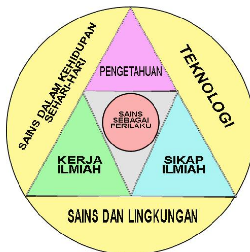
Gambar 3. Kerangka Pengembangan IPA

Pengembangan kurikulum IPA SD/MI dilakukan dalam rangka mencapai dimensi kompetensi pengetahuan, kerja ilmiah, serta sikap ilmiah sebagai perilaku sehari-hari dalam berinteraksi dengan masyarakat, lingkungan dan pemanfaatan teknologi, seperti yang tergambar pada Gambar 3. berikut.