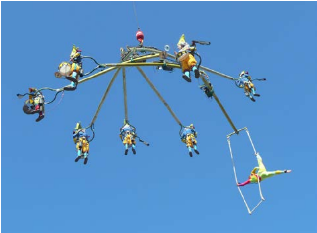
▲▲ Cristal Palace ▲ M.O.B. Les Tambours ▶