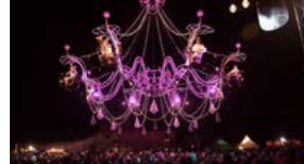
« Cristal Palace, Bal au clair de Lune », spectacle de la compagnie Transie Express à été présenté cette année au festival d'Aurillac.

STEPHANE FRACHET Le 03/10 à 09:47M à jour le 03/10 à 18:07