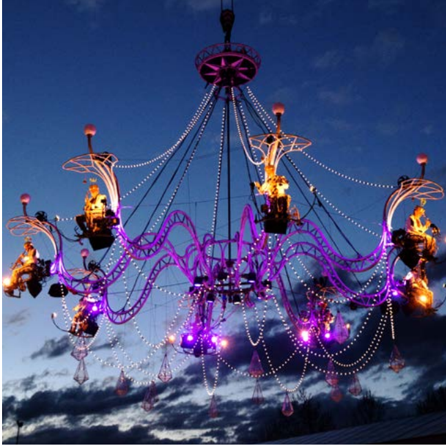
◀ Cristal Palace