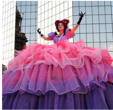
◀ Les Poupées Géantes Mù, cinématique des fluides ▼