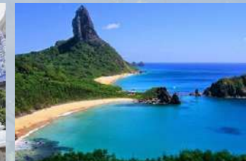
Pantai Goa Cina