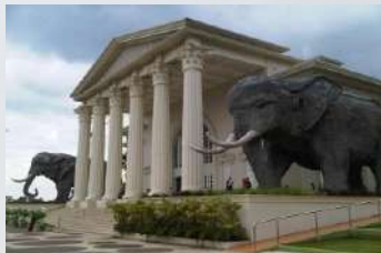
Jatim Park 2