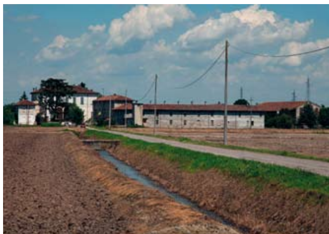
La Cascina Cantalupo: sulla sinistra villa Vismara. Foto Paolo Vanoli, 2013.

10.00-19.00 - Andare a palazzo . Apertura al pubblico di Palazzo Archinto