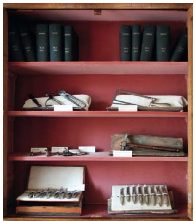
Strumentazione medica presso la Sala Gologiana dell'Istituto Camillo Golgi di Abbiategrasso.