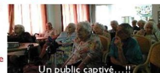
Un public captivé... !!

Brillat-Savarin : « Convier quelqu'un, c'est se charger de son bonheur pendant tout le temps qu'il est sous notre toit. »