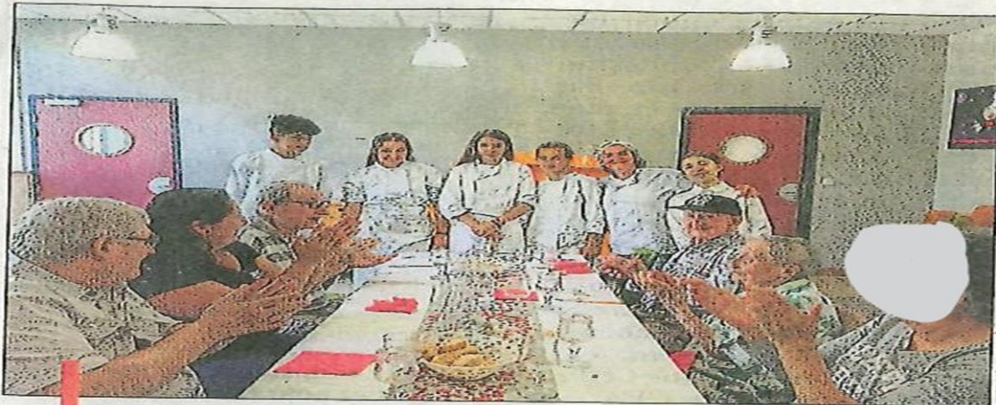
Les élèves de la 3 e Segpa, option Hygiène Alimentation Service, du collège Jean-Giono à l'Ehpad des Cèdres.