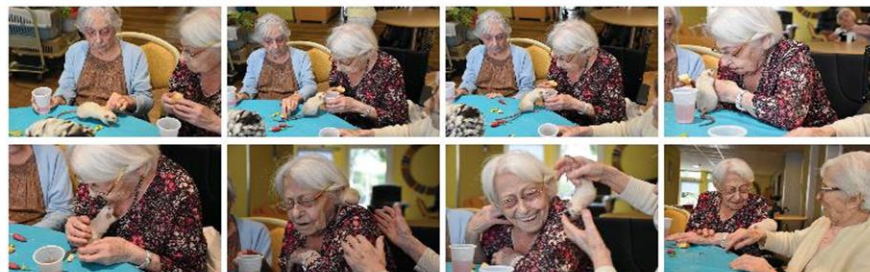
Un petite rate blanche pour le plaisir de ces dames... que du bonheur!!