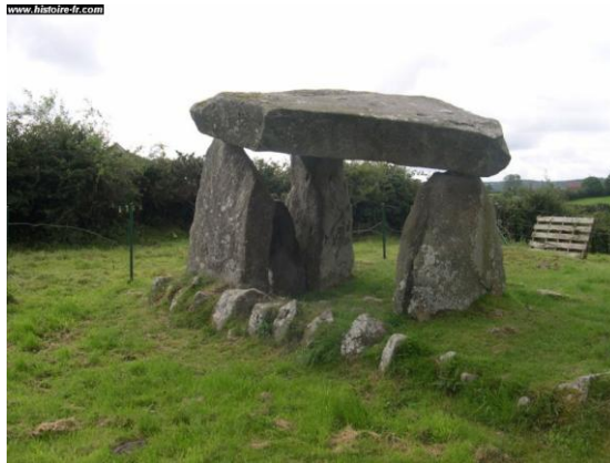
Dolmen de Ballykeel, Irlande

-A la préhistoire (environ -7000 avant JC), des premiers habitants se sont installés dans la région de l'Ulster. C'est une civilisation mégalithique qui évolue progressivement (travail de la pierre, agriculture, chasse...) d'où les constructions de dolmens.