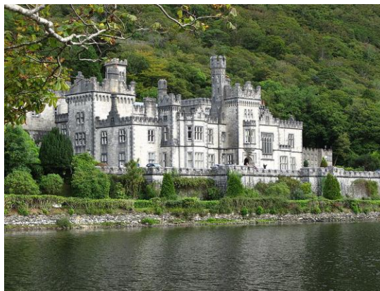
Abbaye de Kylemore Connemara, Irlande

La christianisation est effectuée par Saint Patrick au Ve Siècle, le pays connaît alors une période prestigieuse du VIe au VIIIe Siècle (constructions de grands monastères irlandais, de croix celtiques...)