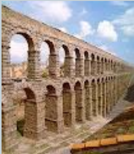
Acueducto de Segovia