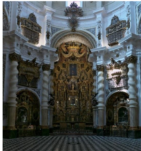
Iglesia de San Luis de los Franceses