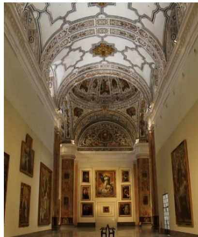
Museo de Bellas Artes