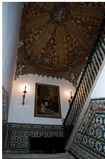
Hospital de los Venerables