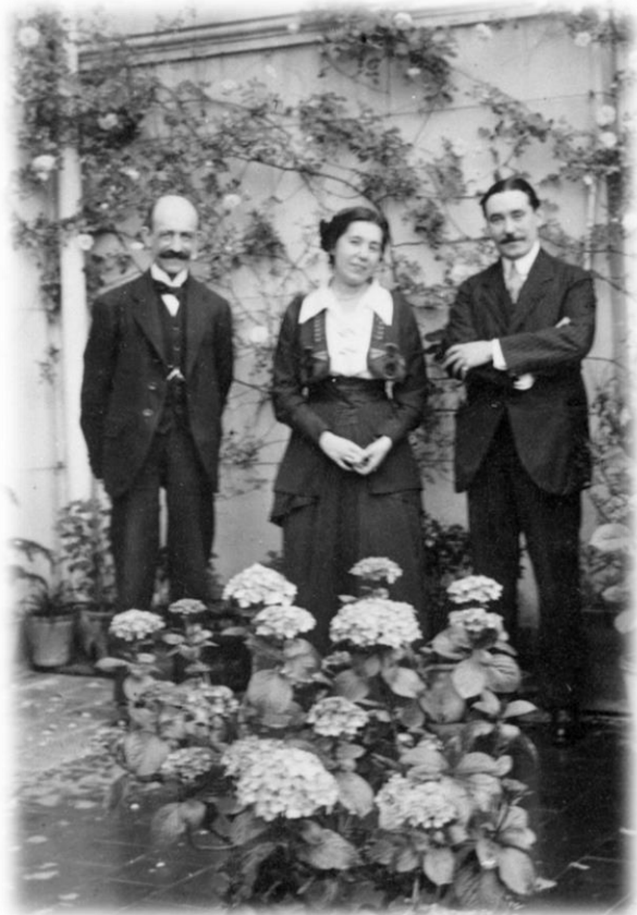
Manuel de Falla, María Lejárraga y Joaquín Turina Madrid 1916

Canción del fuego fatuo Lo mismo que er fuego fatuo, lo mismo es er quere. Se huege, y te persigue, te llamas, y echa a corre. Lo mismo que er fuego fatuo, lo mismo es er quere! Nace en las noches de agosto, cuando aprieta la calor. Va corriendo por los campos en busca de un corazón.... Lo mismo que er fuego fatuo, lo mismo es el amor!