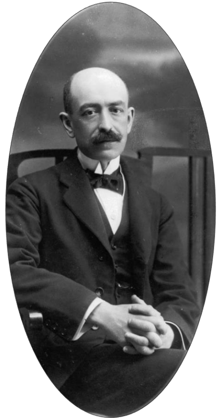
Manuel de Falla, 1915