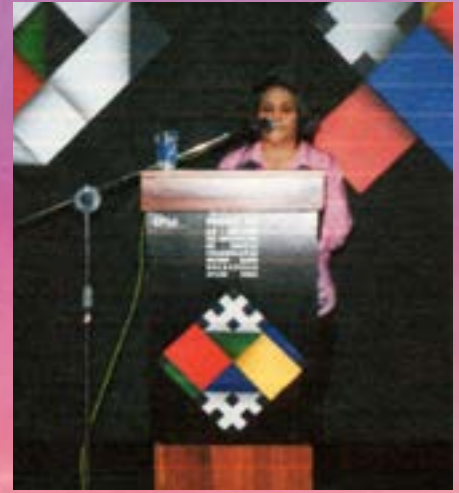
XXX Encuentro de mujeres poetas colombianas. Año 2009. Museo Rayo (Roldanillo - Valle)