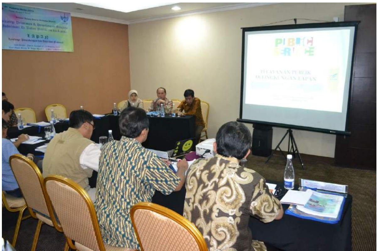
Bimbingan Teknis Sraregi Pelayanan dan Penyelesaian Sengketa Informasi diikuti oleh pengelola PPID