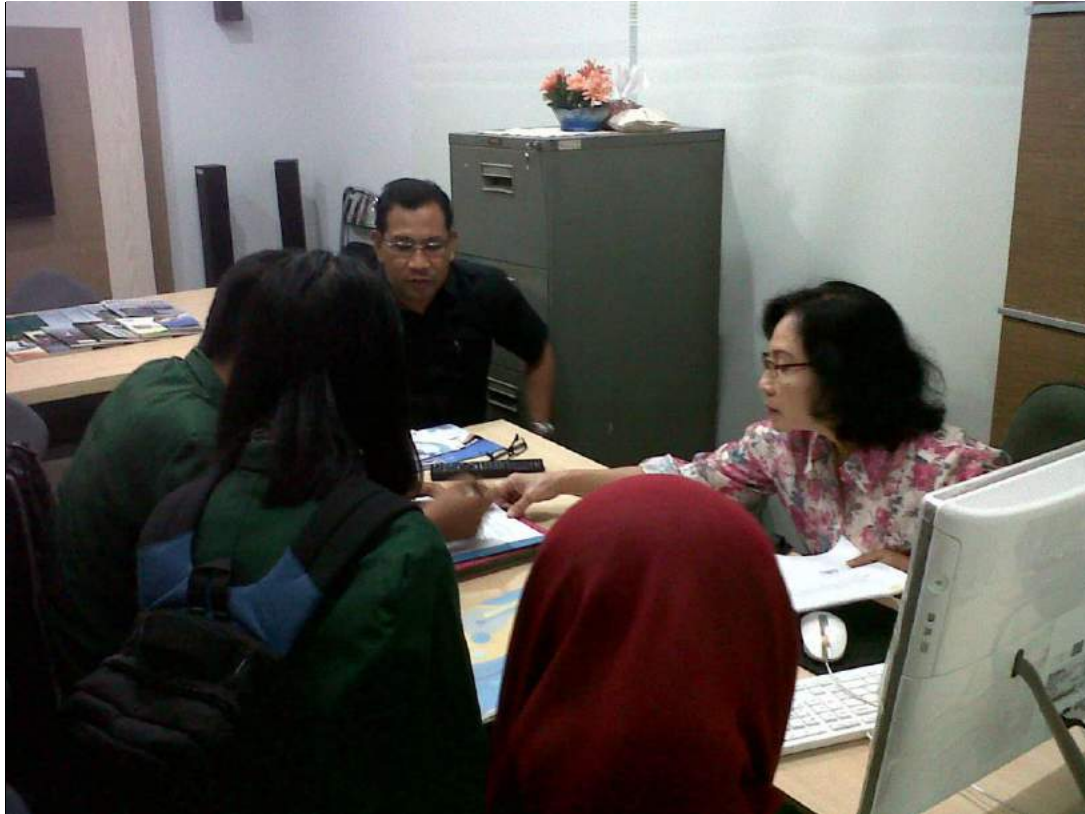
Petugas PPID sedang melayani pemohon informasi