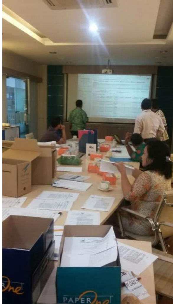
Visitasi oleh Komisi Informasi Pusat (KIP) dalam Pemeringkatan Keterbukaan Informasi Publik