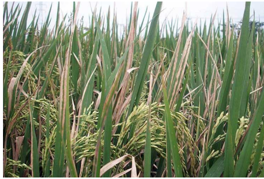
Gambar 2. Gejala penyakit kresek atau hawar daun bakteri

menjadi kuning pucat, layu, dan kemudian mati. Gejala penyakit juga dapat diamati dengan mudah pada daun dan titik tumbuh berupa garis-garis di antara tulang daun. Patogen penyebab penyakit ini tidak saja menyerang tanaman muda tetapi juga menyerang tanaman dewasa. Kresek merupakan sebutan untuk penyakit yang disebabkan oleh serangan bakteri Xoo pada tanaman padi yang masih muda, sedangkan apabila menyerang tanaman dewasa maka penyakitnya dikenal sebagai hawar daun bakteri ( bacterial leaf blight ). Kresek merupakan bentuk gejala yang paling merusak. Pada pagi hari biasanya mudah diamati adanya tanda penyakit yang berupa oze bakteri yang berwarna kekuningan pada permukaan atas daun yang masih basah. Secara umum kehilangan hasil yang diakibatkan oleh penyakit ini dapat mencapai 20-60 %.