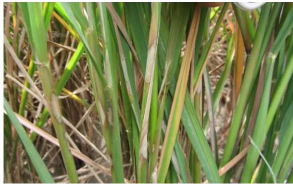
Gambar 3. Gejala penyakit hawar pelepah daun

parsial dapat mempengaruhi panjang malai (Semangun, 2004). Kerugian yang ditimbulkan kapang tersebut dapat berupa gangguan terhadap pengangkutan zat organik dan air pada bagian daun tanaman. Akibat terganggunya pengangkutan zat organik dan air maka bagian tanaman tersebut tidak mampu melaksanakan fungsi-fungsi kehidupan, yang pada akhirnya dapat terjadi kematian pada tanaman padi tersebut (Agrios, 1996).