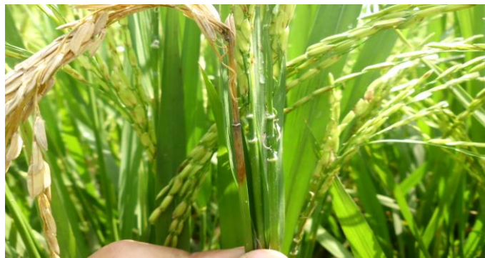
Gambar 1. Gejala penyakit neck blast

Pengendalian penyakit blast pada umumnya dilakukan dengan cara membakar sisa jerami, menggenangi sawah, menanam varitas unggul, pemberian pupuk N di saat pertengahan fase vegetatif dan fase pembentukan bulir. Pada daerah serangan berat sebaiknya jerami dibakar atau dikeluarkan dari areal untuk berbagai keperluan seperti pakan ternak. Benih perlu dilakukan dengan perawatan fungisida. Penanaman varietas tahan harus dilakukan hanya dalam waktu yang terbatas karena dalam waktu tidak terlalu lama varian (ras)m baru akan segera terbentuk yang dapat mematahkan ketahanan tanaman. Bila cuaca diramalkan mendorong terjadinya epidemi sebaiknya diaplikasikan fungisida