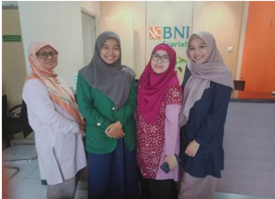
Lokasi PPL BNI Syariah KK UNISKA