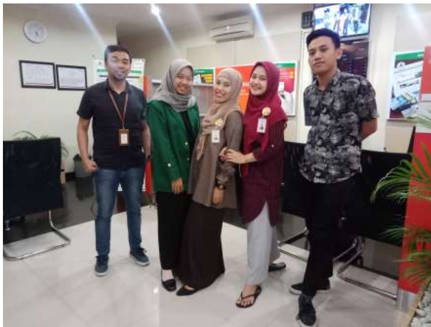
Lokasi PPL BNI Syariah KCP Gudang Garam