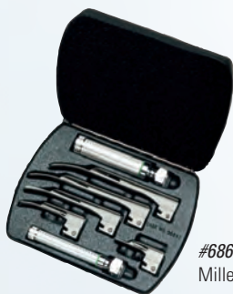
#68696 Miller #0, 1, 2, 3, 4

Cada set incluye nuestros mangos livianos de baterías "AA" y "C" y hojas livianas para una máxima maniobrabilidad.