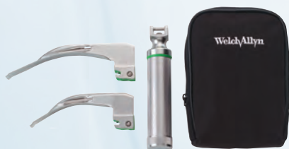
#65103 MacIntosh número 3 y 4, y mango mediano