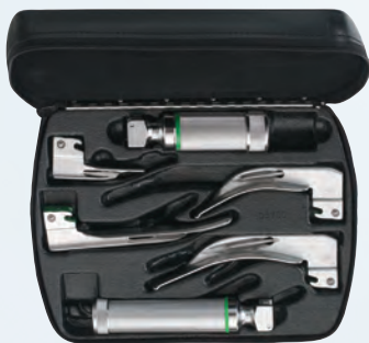
#65122 MacIntosh número 3 y 4, Miller número 0 y 2, con mangos cortos y gruesos para baterías y estuche