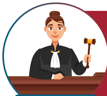
Dolores Aventura Número asignado: 18

Idealmente el aspirante 135 debería ser asignado a la Sala de lo Contencioso Administrativo; como segunda opción a Tributario/aduanero o Económico Coactivo; y como tercera opción a mixto. Aunque su mejor opción es Contencioso Administrativo.