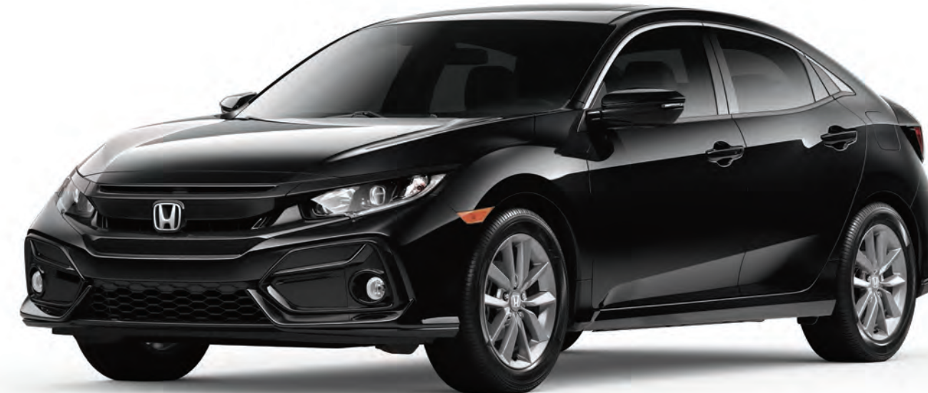
Civic Hatchback mostrado en: Crystal Black Pearl / Civic Hatchback shown in: Crystal Black Pearl