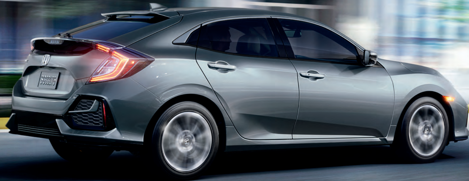
Civic Hatchback mostrado en: Sonic Gray Pearl / Civic Hatchback shown in: Sonic Gray Pearl

The Civic Hatchback is always trying to look out for you, thanks to safety technologies that can help you while driving.