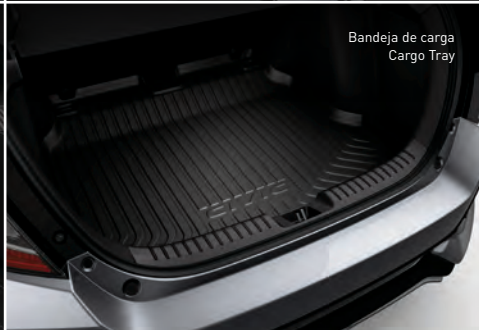
Bandeja de carga Cargo Tray