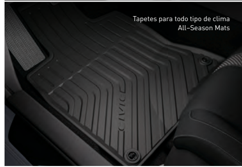
Tapetes para todo tipo de clima All-Season Mats