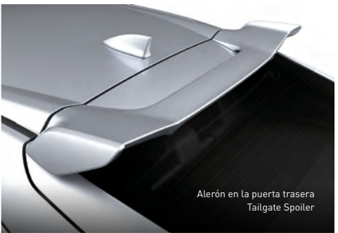
Alerón en la puerta trasera Tailgate Spoiler