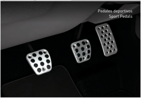
Pedales deportivos Sport Pedals