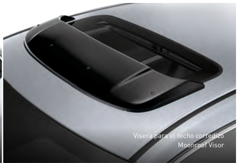
Visera para el techo corredizo Moonroof Visor