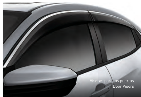
Viseras para las puertas Door Visors