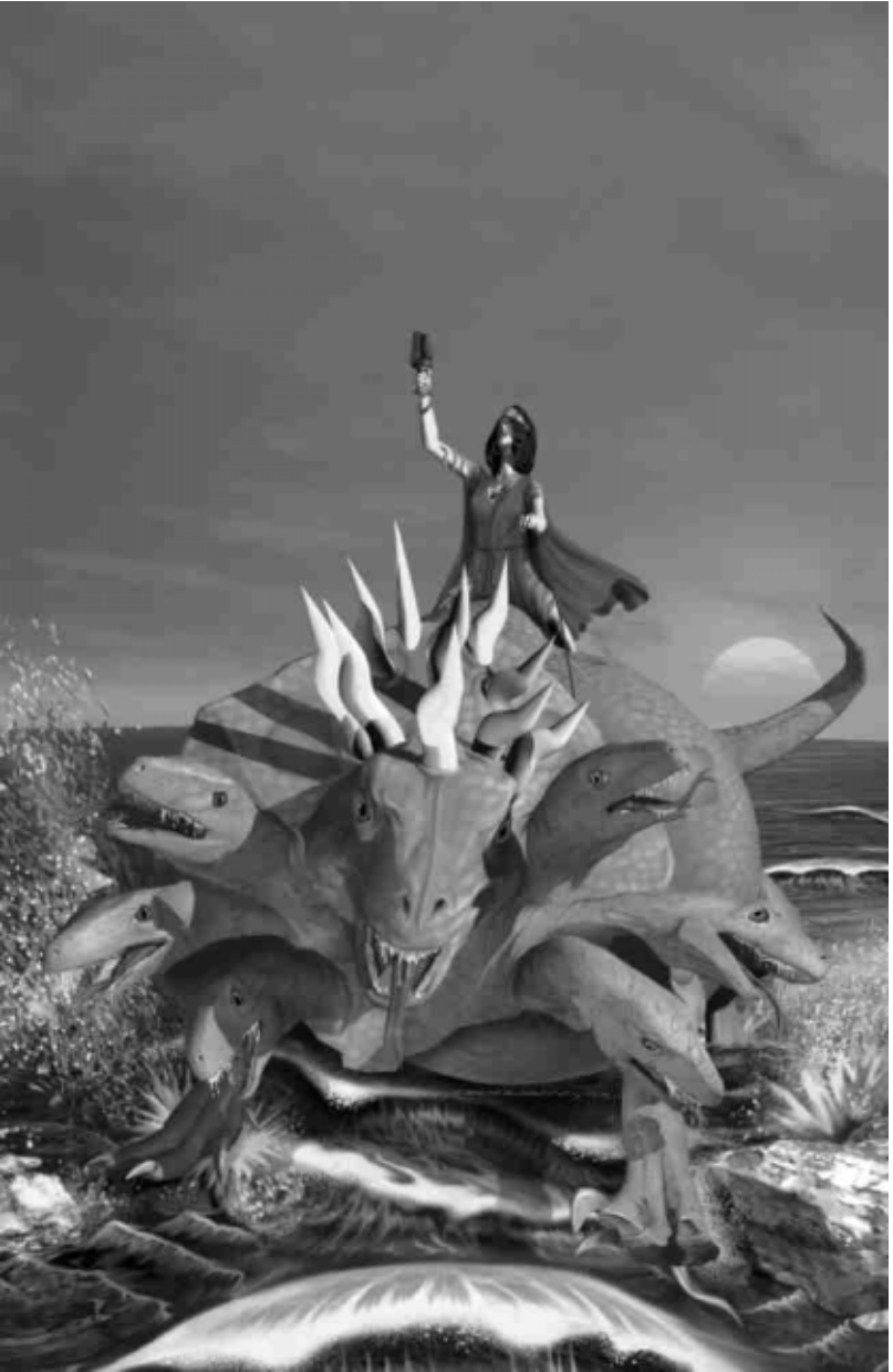
Apocalypse 17 décrit une femme – nous comprenons qu'elle représente un faux système religieux – qui "chevauche" une "bête" représentant la dernière survivance de l'Empire romain. © TW Illustration – Courtesy of Bruce Long