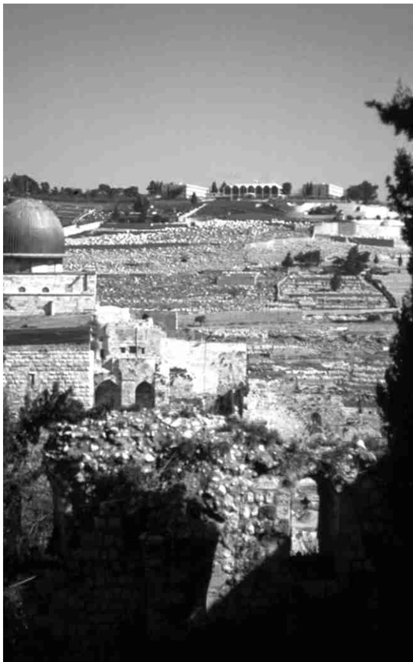
Vue du mont des Oliviers depuis la vallée de Cédron