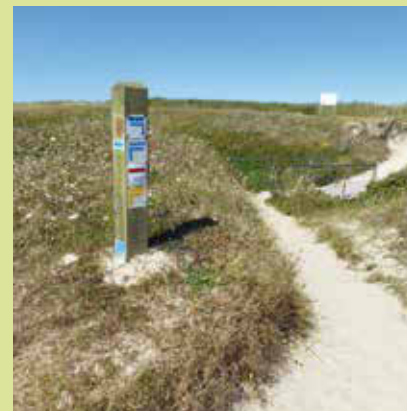
Légende © crédit

Le nom « gabelou », qui était celui donné aux douaniers, a pour origine la gabelle. Cette taxe sur le commerce du sel fut instituée dès le Moyen Âge; le sel était alors un monopole royal. Il faut noter que la Bretagne était exemptée de cette taxe, précisément parce que la Bretagne était une importante région productrice de sel. Les gabelous prêtaient serment au pouvoir et ils avaient souvent des fonctions qui dépassaient la seule surveillance des contrebandiers : arrestation des déserteurs, sauvetage en mer... Ils pouvaient même parfois être mobilisés en cas de troubles à l'ordre public.