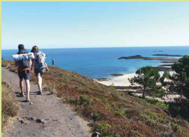
Légende © crédit

Un second guide présente trente balades sur le sentier des douaniers de la côte sud, de la baie de Douarnenez à l'estuaire de la Loire.