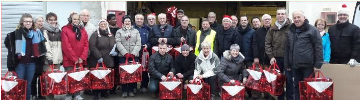
Distribution de 650 colis aux Anciens de la commune samedi 16 décembre 2017 par les Élus, les Membres du C.C.A.S. et des bénévoles

- Samedi 06 janvier de 7 h / 18 h - Samedi 20 janvier de 7 h / 18 h