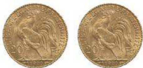
2X Napoléon 20 francs Valeur unitaire : 254 €