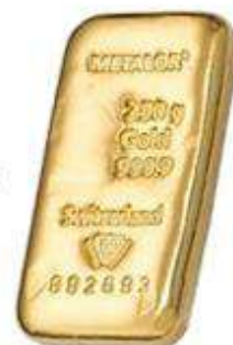
Lingotin 250g (sans blister) Valeur unitaire 11290€