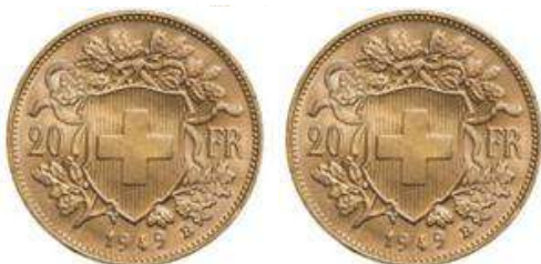
2X Croix Suisse 20 francs Valeur unitaire: 252 €