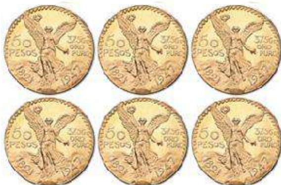
6x 50 Pesos mexicain Valeur unitaire : 1658 €