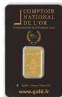
1x Lingotin 10g sous blister Valeur unitaire : 508 €