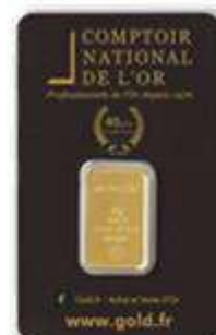
3x Lingotins 50g sous blister Valeur unitaire : 2270 €