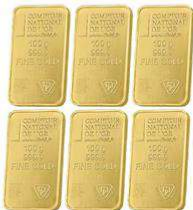
6x Lingotins 100g sous blister Valeur unitaire : 3860 €