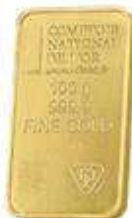
2x Lingotins 100g sous blister Valeur unitaire : 4500 €