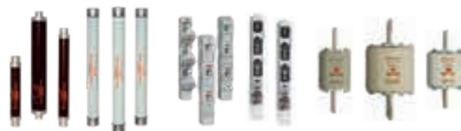
Fusibles HT DIN et Standard F