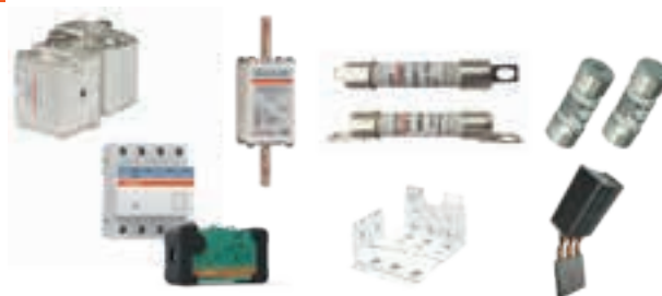
Fusibles rapides, Busbar, Cooling