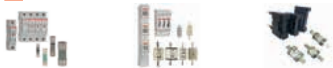
IEC FR Standard IEC DIN Standard IEC BS Standard