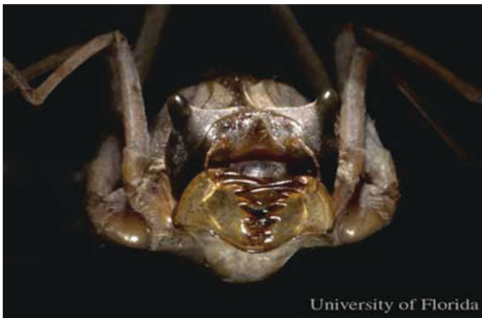
Figure 4. Vista frontal de un odonato inmaduro de la familia Macromiidae. Este imagen muestra la forma típica de un odonato inmaduro.

Los odonatos inmaduros a veces se refieren como larvas o ninfas, pero aquí se refieren como náyades porque son insectos de hemimetabolismo enteramente acuático mientras estén inmaduros (es decir que no tienen estadio pupal como los escarabajos y las mariposas). Las náyades viven en la mayoría de hábitats acuáticos. Algunos pueden sobrevivir en agua de sal (Corbet 1999). Todos los náyades son predadores voraces alimentándose de todo desde invertebrados pequeños como larvas de zancudo hasta vertebrados pequeños como peses y ranas.