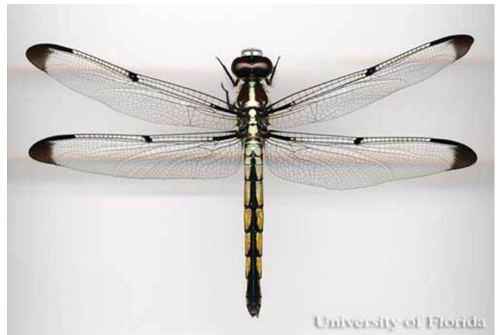
Figure 1. Vista dorsal de una libélula adulta de la familia Libellulidae.

Las libélulas (Anisoptera) se componen de los más especiosos de los dos subórdenes y son observadas mucho más fácilmente que sus parientes delicados, los caballitos del diablo. Tienen ojos grandes que casi llenan la cabeza entera y cuando no son contiguos no se separan tanto como con los caballitos del diablo (véase la clave abajo). También tienen una estructura del cuerpo robusto para apoyar los músculos masivos que propulsan sus alas grandes y anchas. Las libélulas no tienen igual como voladores y tienen un vuelo ágil y deliberado. Los machos frecuentemente son territoriales, defendiendo sitios de oviposición de otros machos.