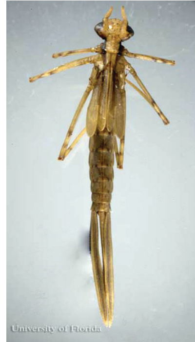
Figure 5. Vista dorsal de un caballito del diablo inmaduro de la familia Calopterygidae. Este imagen muestra la forma típica de un caballito del diablo inmaduro.

generación por año mientras los que estén en hábitats tropicales pueden tener varias generaciones por año dependiendo en la disponibilidad de ambiente apropiado.