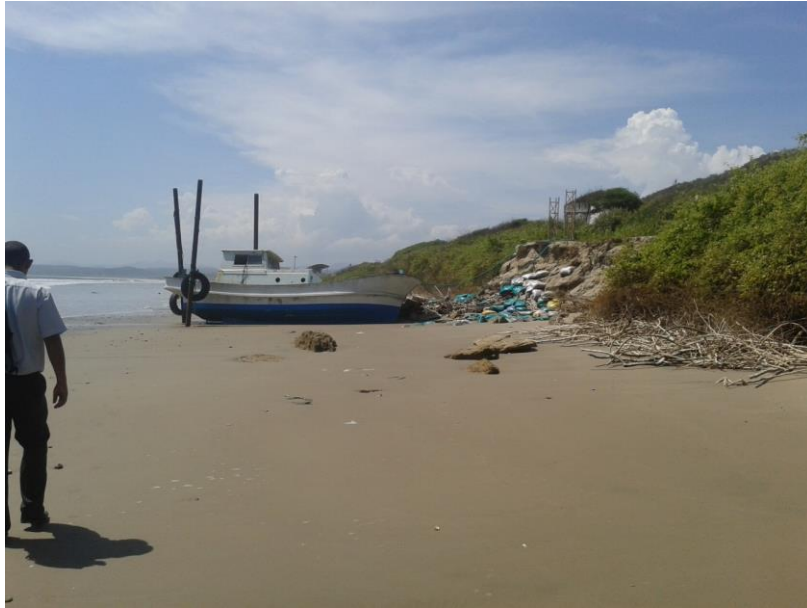
Fotografía 7.-.- Muelle Actual.