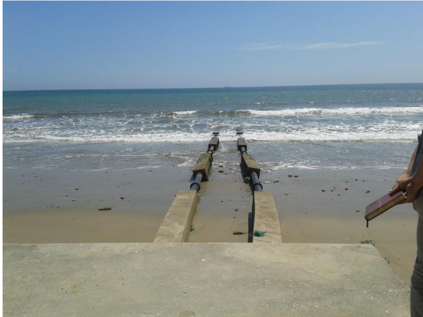
Fotografía 4.- Implantación en campo de las tuberías de transporte de agua de mar hacia el CENAIM

Con color azul en la Figura 1, se observa que para proveer de agua de mar a los laboratorios, se instaló una tubería de 250 m de longitud, anclada por medio de muertos de hormigón, una parte de la presente consultoría es evaluar el estado de la misma, además se solicita evaluar el estado del Pit de Bombeo y la cisterna de almacenamiento de agua.