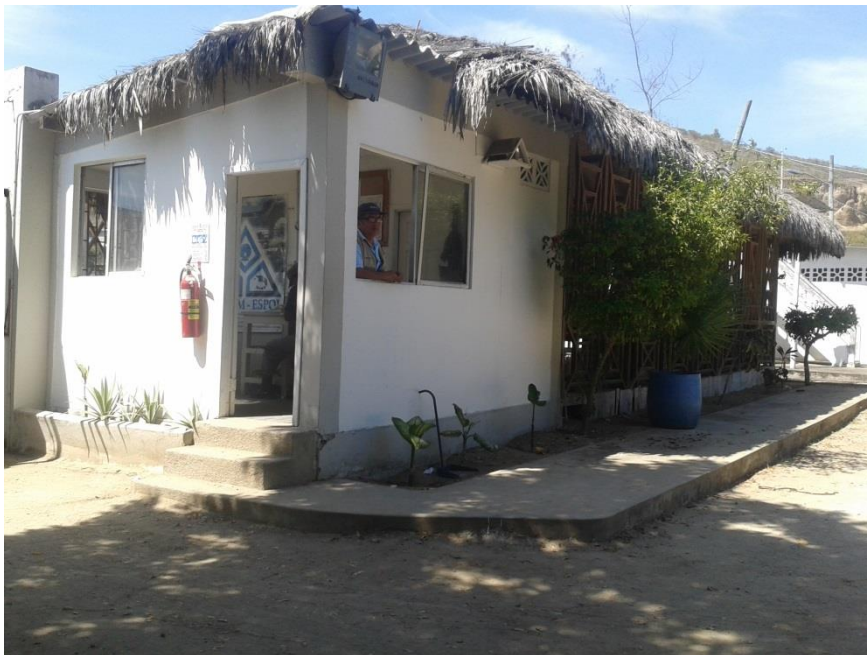
Fotografía 3.- Área Actual de la Garita

En el polígono con color morado que se observa en la Figura 1, se encierra el área de los Laboratorios del Cenaim, como parte del alcance del presente estudio, se deberá diseñar el cerramiento perimetral y la Garita, tanto en la parte arquitectónica, eléctrica, hidrosanitaria y seguridad electrónica, ver Fotografía 3.