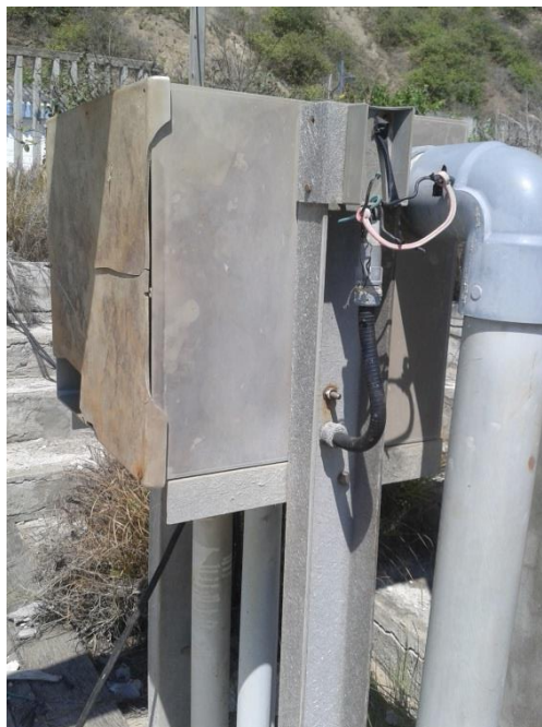
Fotografía 5- Área de Pit de Bombeo