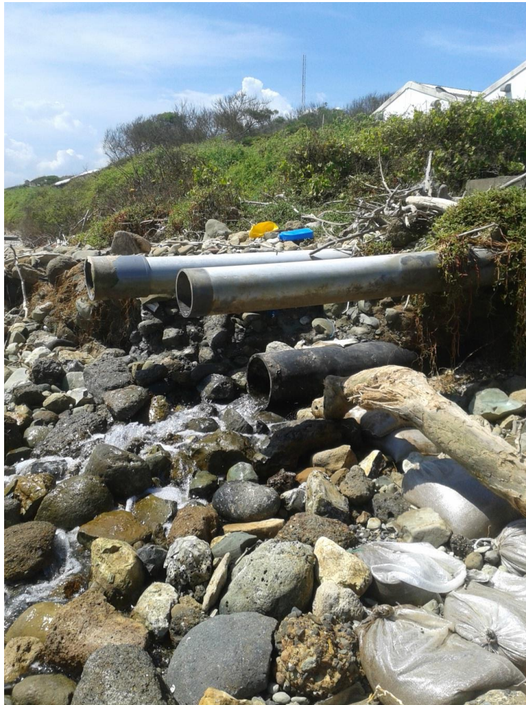
Fotografía 6.-Tuberías de salidas de agua lluvia.

Con línea roja en la Figura 1, se muestra el área tentativa donde se colocará otra entrada de agua, la ubicación fue considerada de acuerdo a la información proporcionada por la empresa Consultora Wong & Wong, que es la encargada del diseño de los nuevos laboratorios, además se debe indicar que actualmente existen salidas de tuberías de aguas lluvias ver fotografía 6, por lo que fueron consideradas en el estudio.