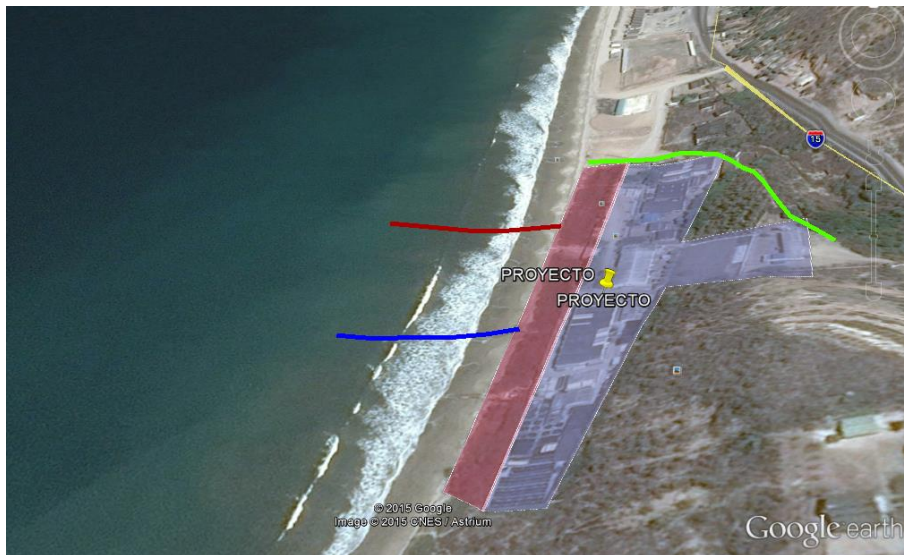
Figura 1.- Ubicación del área de implantación del CENAIM

En la Figura 1 con color rosado se muestra la ubicación del mismo, además se debe considerar una obra de protección, que garantice la estabilidad de las tuberías de entrada y salida de agua a los laboratorios y la integridad de dicho lindero.