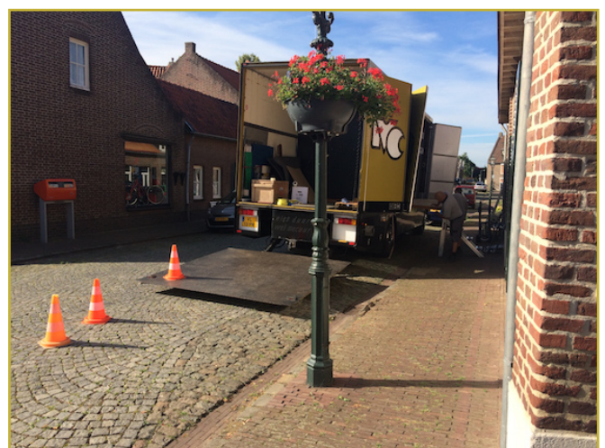
Om half twaalf was de klus geklaard. Geen stress, geen problemen, geen gedoe - dankzij Bart Strang en z'n mannen waren de beide verhuizingen gebeurtenissen waar je met plezier op terugkijkt.