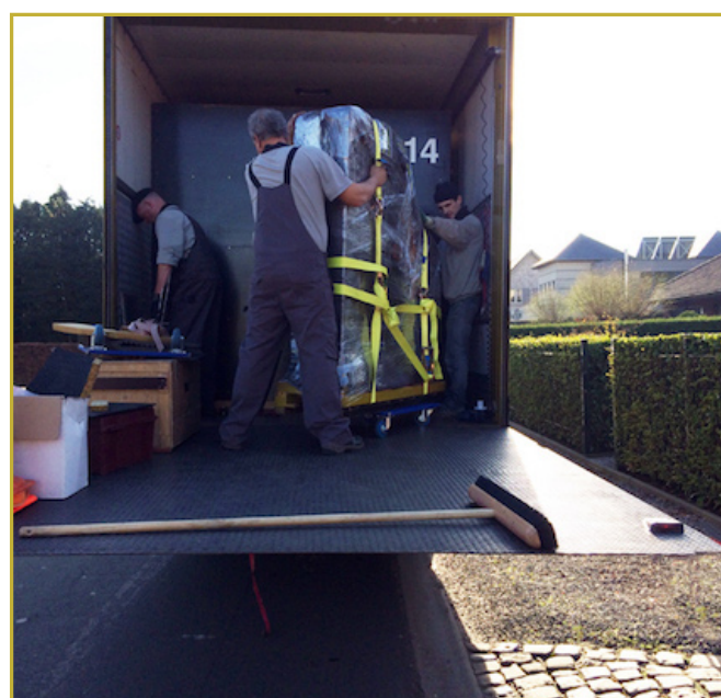
Nu nog een ander huis in Limburg vinden...