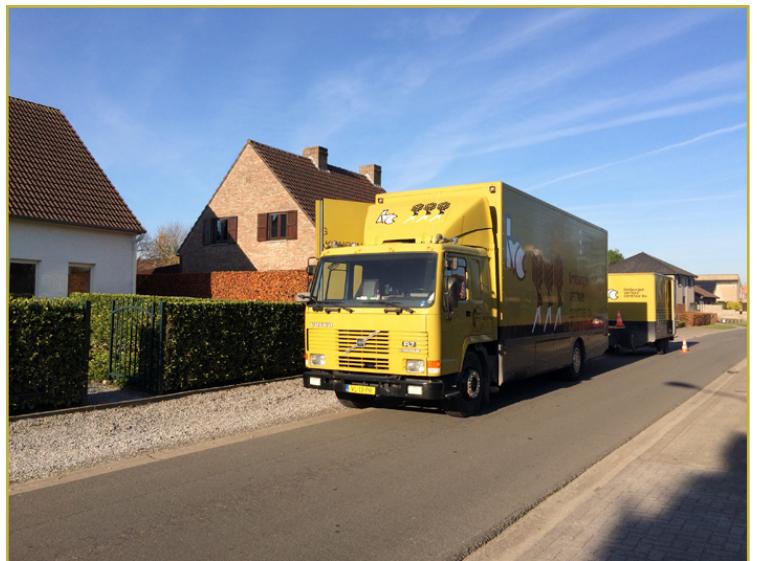
LVC verhuismotors met de speciaal daarvoor ontworpen containers aan de Lage Weg in Hoogstraten (B).

E r wordt wel eens gezegd dat er vandaag de dag 5 dingen in je leven zijn die de meeste stress veroorzaken: huwelijk, echtscheiding, geen TV, geen internet en verhuizen. Wie een of meerdere verhuizingen heeft meegemaakt kent het fenomeen maar al te goed: inpakken van boeken gaat nog, maar al die lampen, schilderijen, grote en kleine spullen! Grote kasten en tweepersoonsbedden helemaal uit elkaar, TV, stereo-installatie, schilderijen en klokken van de muur, kledingrekken volhangen; computers, printer en al die kabels in een aparte doos, dat alles gaat nog, maar dan: de vleugel!