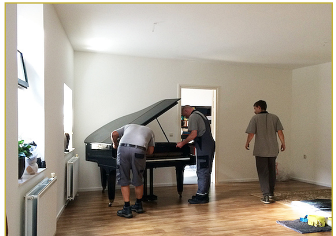
Klep aanbrengen en hij staat.