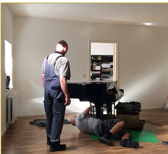
De poten er onder