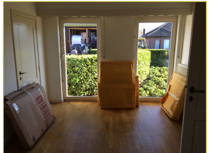
Voor je het weet is je huis leeg.

Een vleugel is, zo zal iedereen die er een bezit