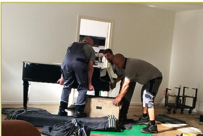
Met z'n drieën: 313 kilo tillen