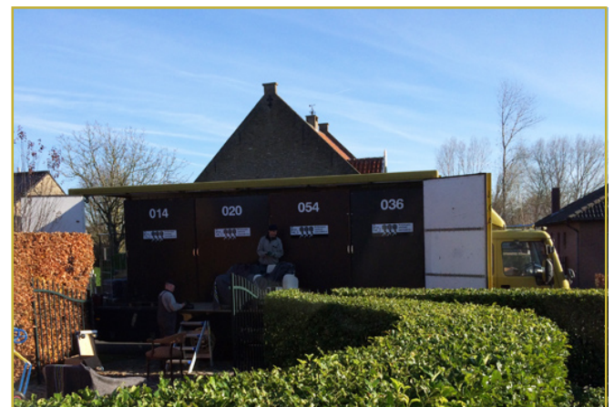
De truck met de vier volle containers.