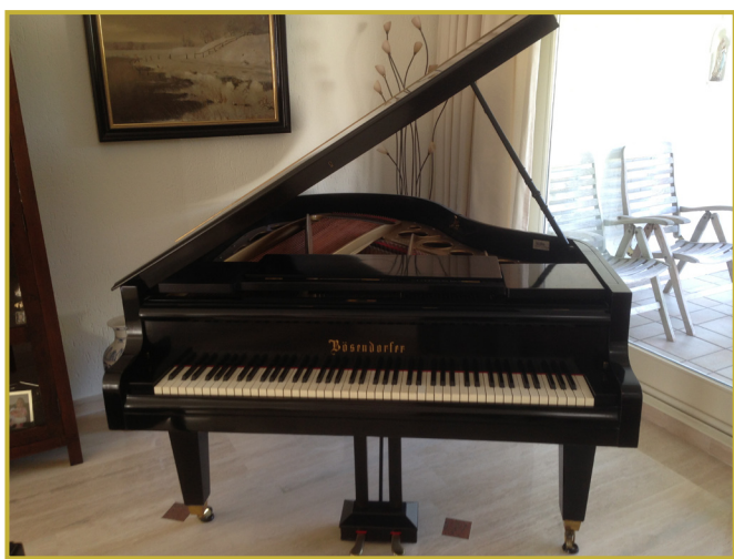
Zó stond 'ie in de kamer...

vertrouwt, die zo'n instrument naar waarde weet te schatten, die weet hoe je er mee om moet gaan en die het als het ware als z'n eigen beschouwt. De wijze waarop door de heer Strang c.s. alles werd gedemonteerd en ingepakt, de voorzichtigheid zoals er mee werd omgegaan verdienen niets dan lof.