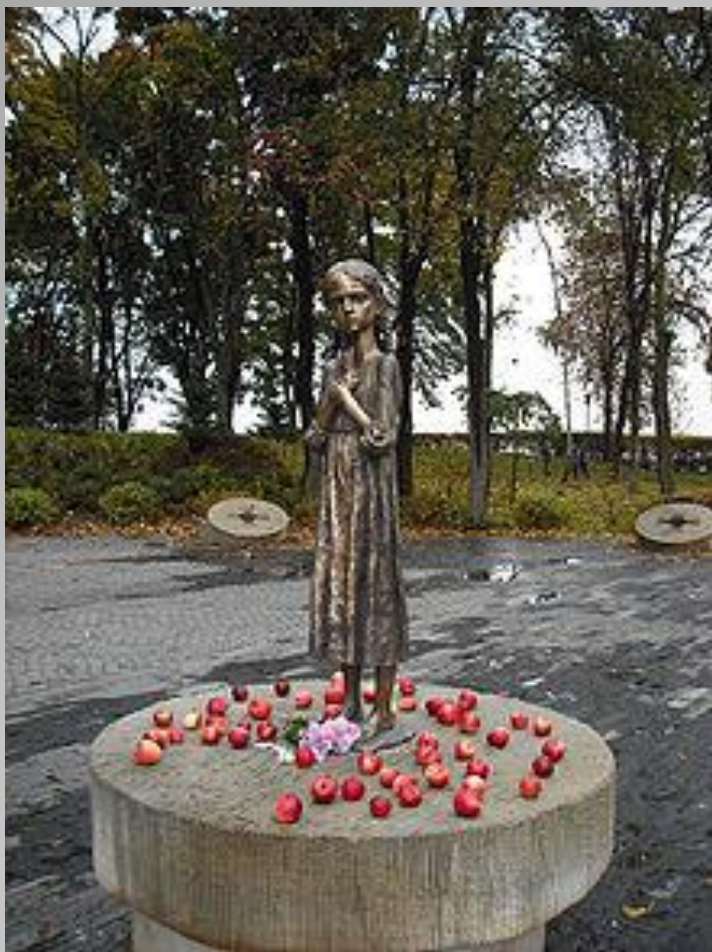
Il monumento in memoria delle vittime della "Grande Fame", a Kiev