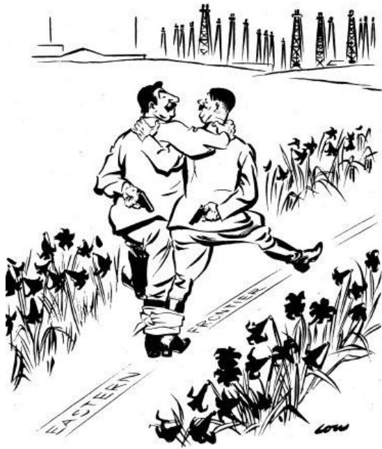
SOMEONE IS TAKING SOMEONE FOR A WALK