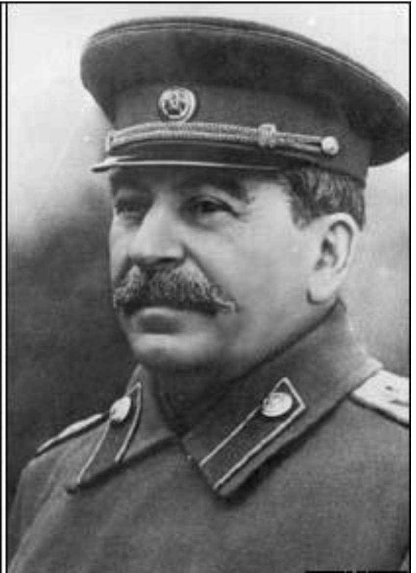
Trockij e Stalin