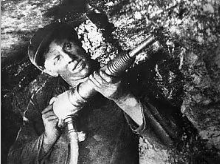
Stachanov al lavoro

Aleksej Stachanov fu un minatore sovietico che, secondo la propaganda, nel 1935 era riuscito ad estrarre una quantità di carbone 14 volte superiore a quella degli altri. Fu così additato come eroe nazionale ed esempio per incentivare tutti a produrre di più. In realtà si trattava di un "record" organizzato a scopi propagandistici, poiché a Stachanov fu attribuita anche la produzione di altri minatori. Ancora oggi il termine "stacanovista" indica chi dedica tutte le proprie energie al lavoro.