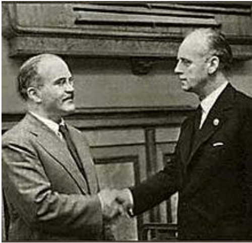
Il ministro degli esteri tedesco Ribbentrop (a destra) e il ministro degli esteri sovietico Molotov (a sinistra)