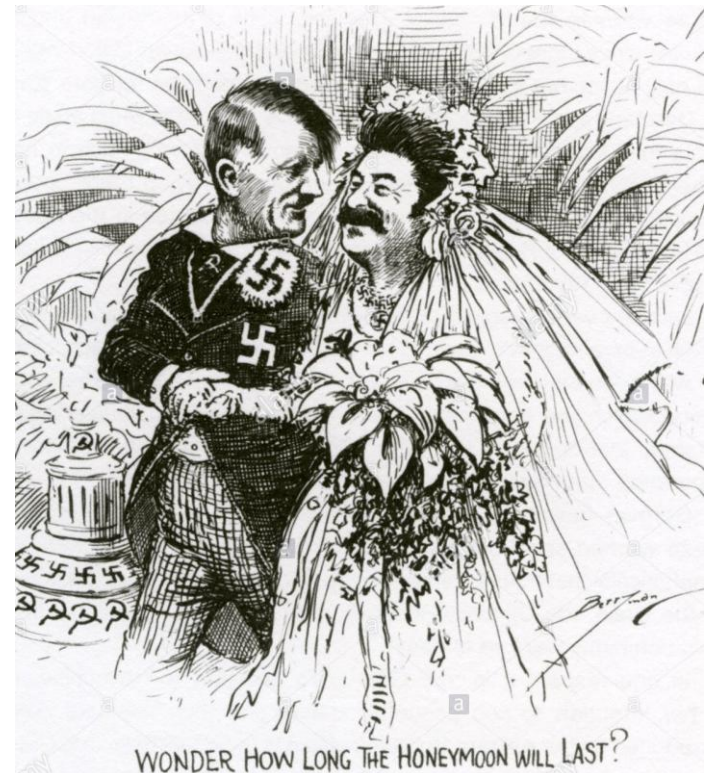
WONDER HOW LONG THE HONEYMOON WILL LAST?