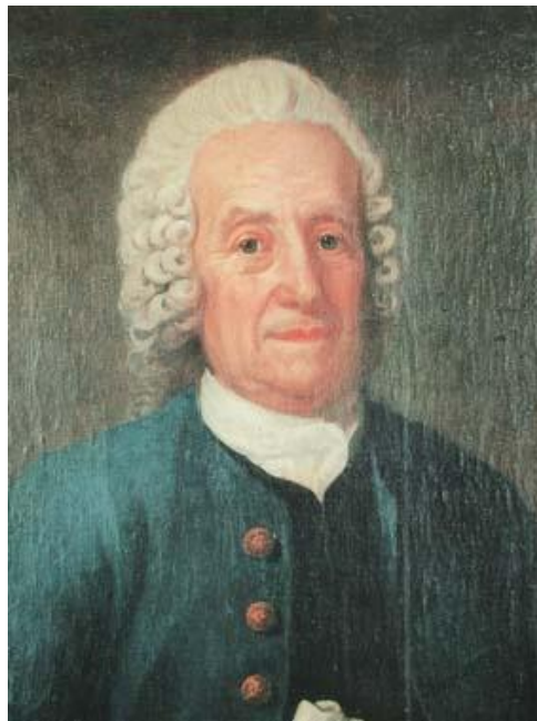
Retrato de Swedenborg a los 80 años (1768) Óleo sobre lienzo de Fredrik Bränder (Nordiska Museet, Estocolmo)