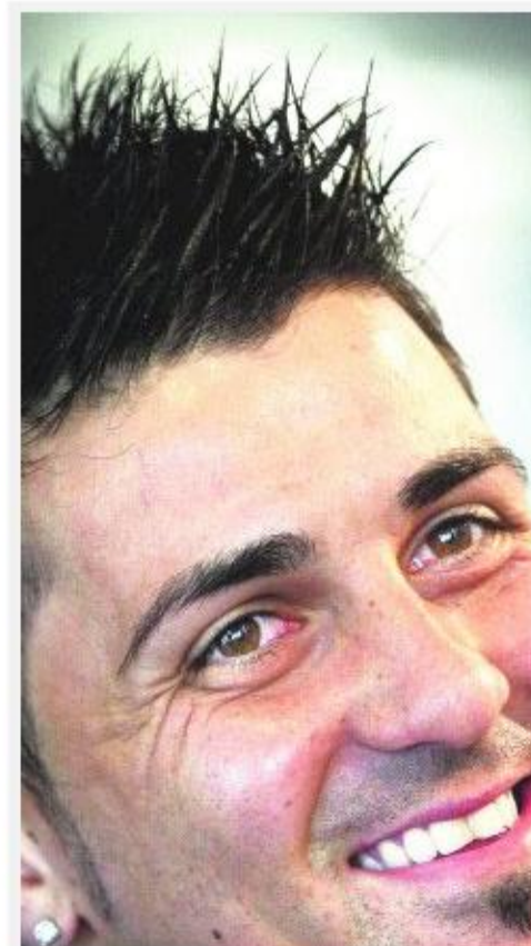
David Villa cuida su imagen. Le gusta vestir a la moda cuando estaba en el Zaragoza, solía ir de compras en Barcelona.

Villa aprendió en Gijón el oficio de instalador de aire acondicionado, por si no podía ganarse la vida con el fútbol