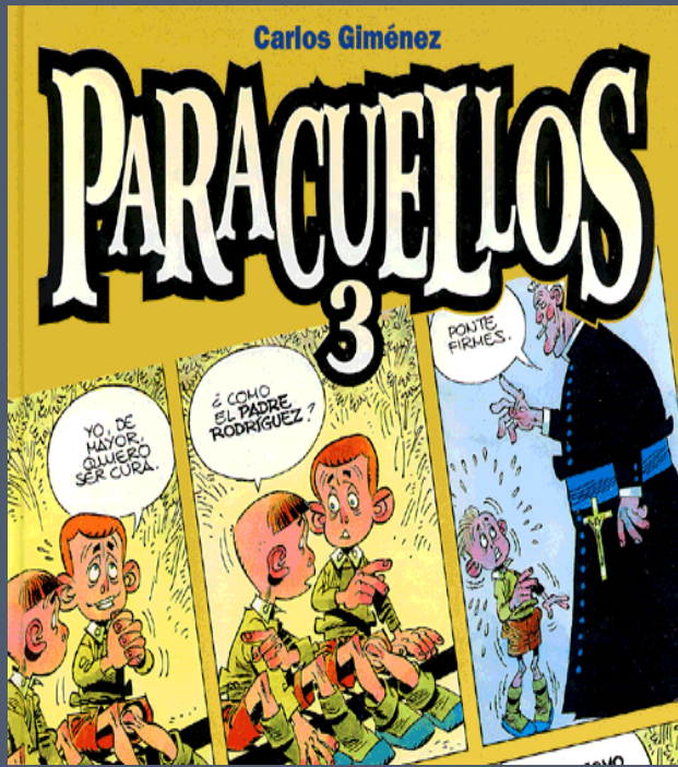
Paracuellos , Carlos Giménez.

“En primer lugar diré que esta serie quizás no debería haberse llamado Paracuellos . Debería, con más propiedad, haber tenido un título al estilo Historias de Auxilio Social o Historia de los Hogares , o, si no fuera porque resulta demasiado largo y una pizca repelente, Historias de los niños que vivieron en los Hogares del Auxilio Social durante la posguerra franquista . Pues, en definitiva, eso es lo que la serie pretende contar.