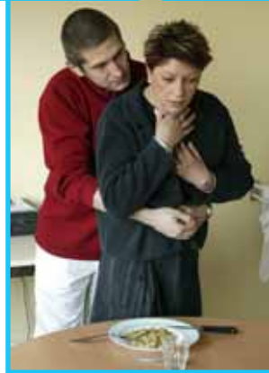
La manœuvre de Heimlich