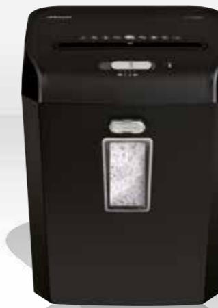
REX623 / RES823