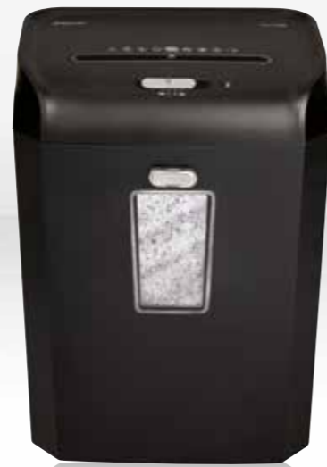
RSX1035 / RSS1535