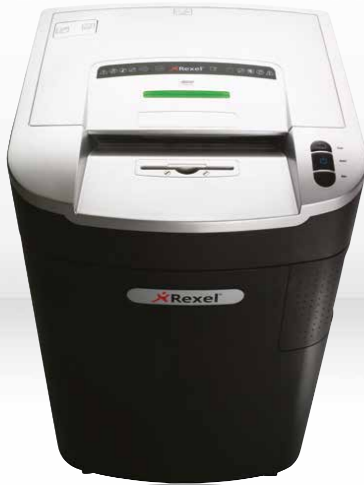
RLM11 / RLX20/RLS32