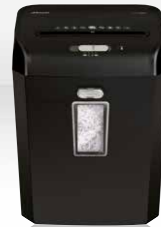
REX823 / RES1123