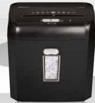
RPX612 / RPS812