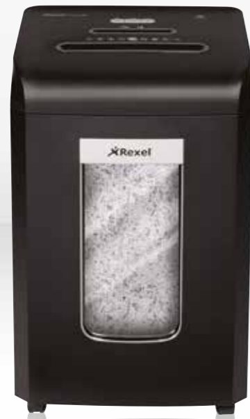
RSX1538 / RSS1838