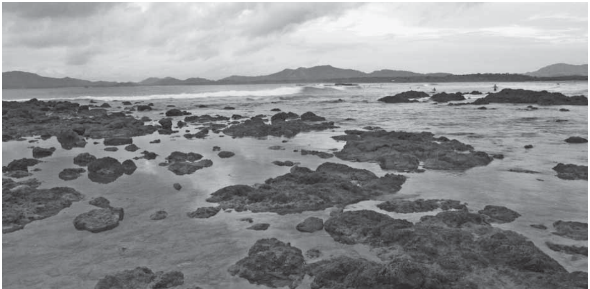
Tamarindo, Costa Rica

Los impactos sobre los ambientes de manglar pueden ser directos, relacionados con la cercanía de las acciones antrópicas, e indirectos, cuando