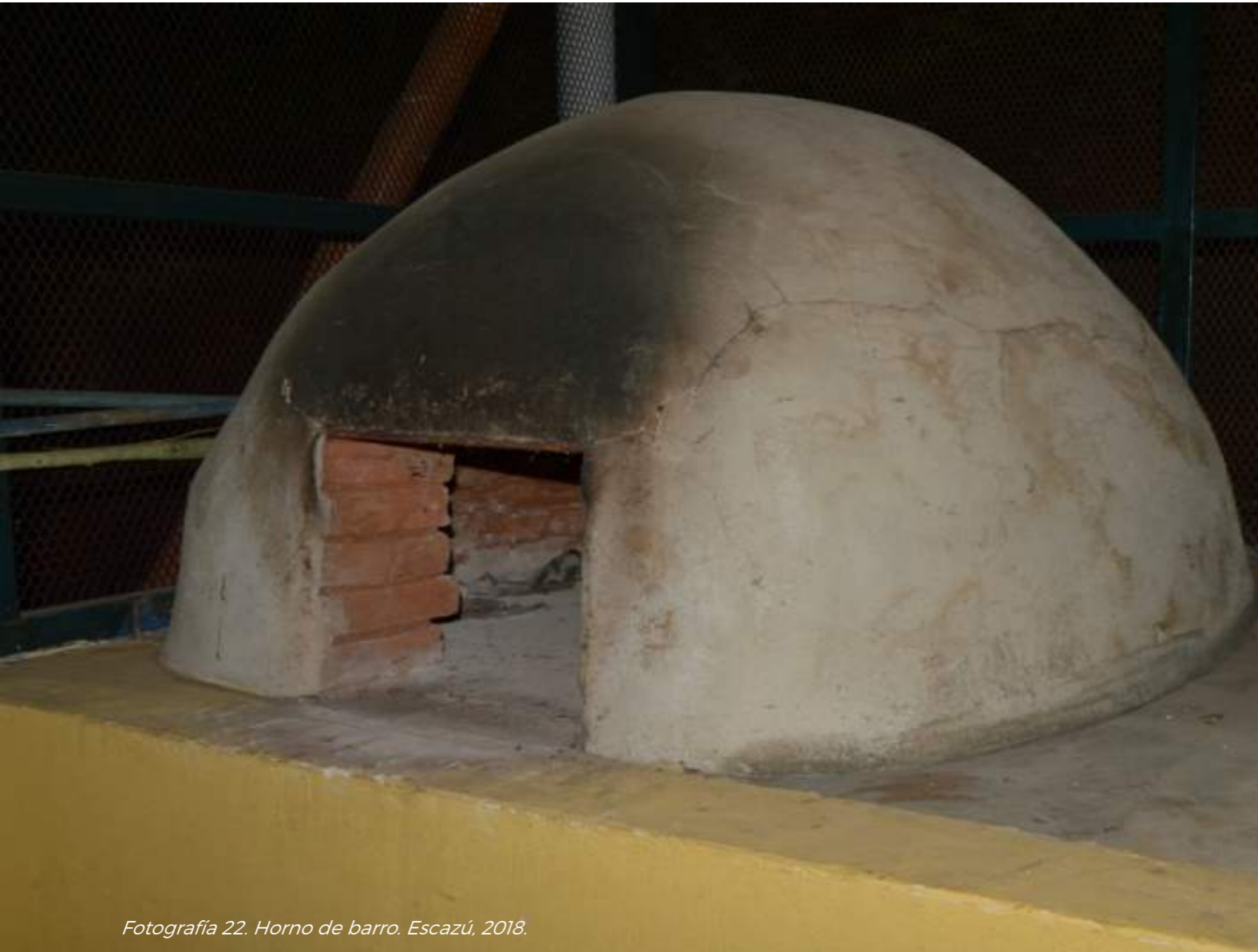
Fotografía 22. Horno de barro. Escazú, 2018.

Aunque hoy en día no es tan común encontrar estos hornos, siguen existiendo familias que saben cómo utilizarlos y se muestra orgullosos de poseer este saber heredados de sus madres, padres, abuelas y abuelos.