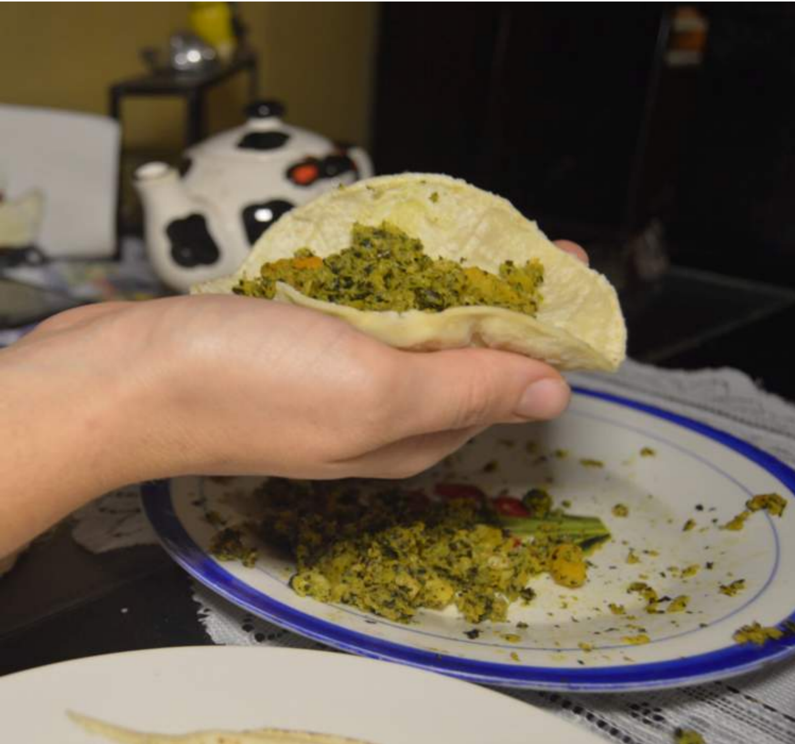
Fotografía 70. Picadillo de chicasquil. Escazú, 2018.

La cara (en el picadillo de chicasquil): es la tortilla casera que se pone encima del picadillo de chicasquil antes de meterlo al horno, para que se vaya formando y cocinando con el picadillo.