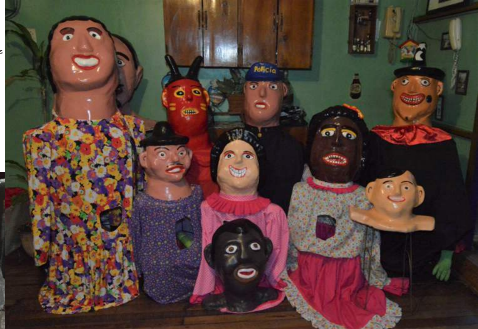
Fotografía 33. Máscaras de Oswaldo. Escazú, 2018.

Las máscaras pueden ser de diferentes tipos. Están las caretas que no requieren armadura, ya que solo son una "media cara" que se pone sobre la cabeza; enanos que son de baja estatura, pero aún con cabeza y armadura pequeña; y las gigantonas, con máscaras de soldaduras altas con cabezas más grandes.