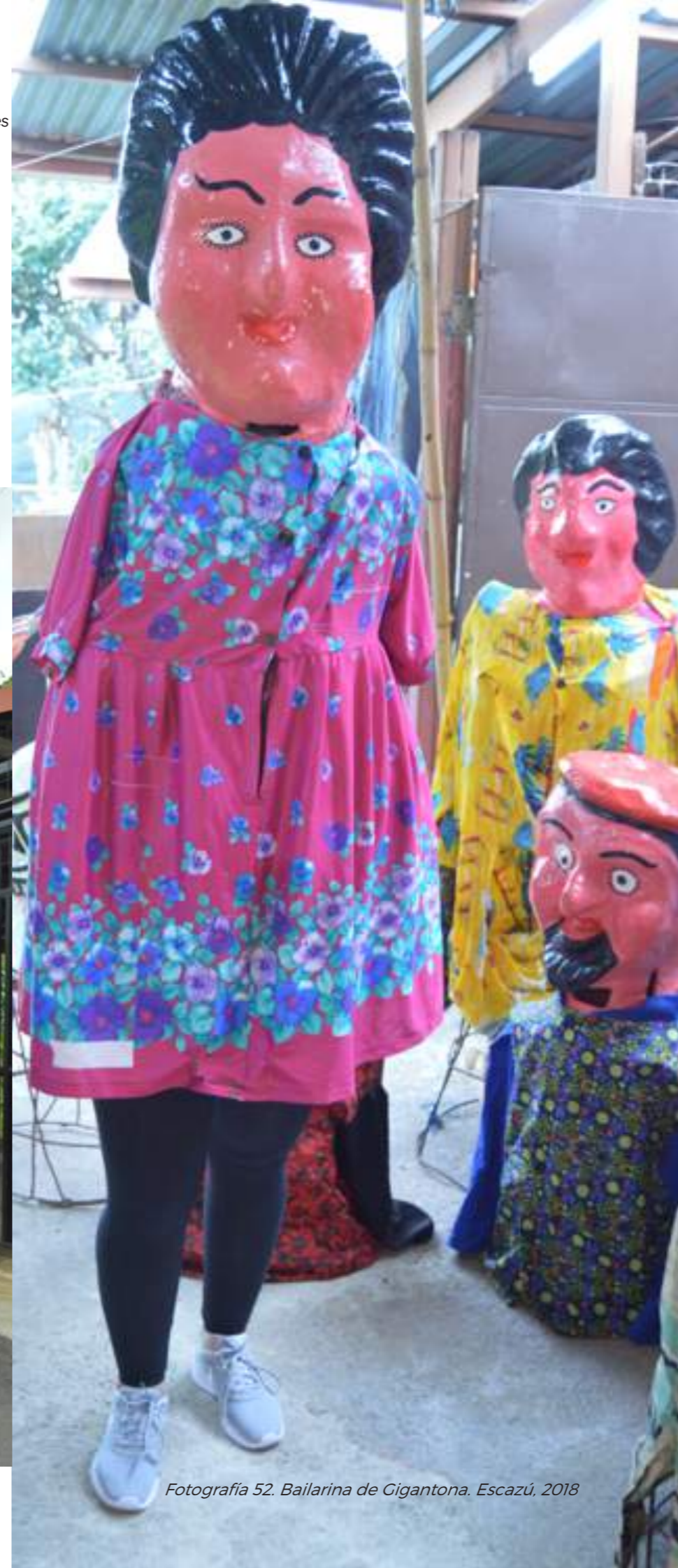
Fotografía 52. Bailarina de Gigantona. Escazú, 2018

Muchas de las personas que ejercen esta práctica hoy en día tuvieron su primer contacto con las máscaras cuando eran muy jóvenes, cuando se acercaban a las personas mascareras en su momento para ofrecerse como bailarines.