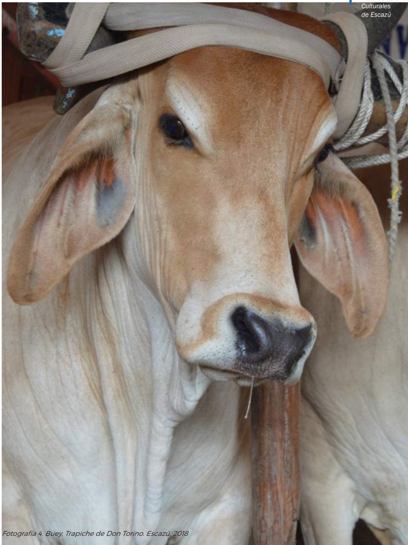
Fotografía 4. Buey, Trapiche de Don Torino, Escazú, 2018