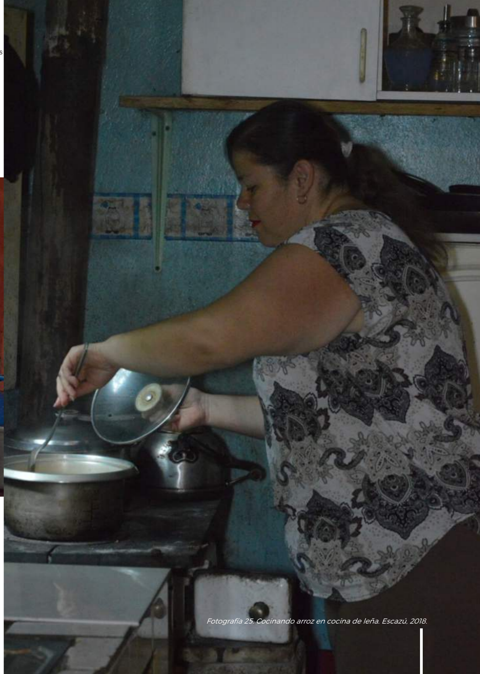
Fotografía 25. Cocinando arroz en cocina de leña. Escazú, 2018.