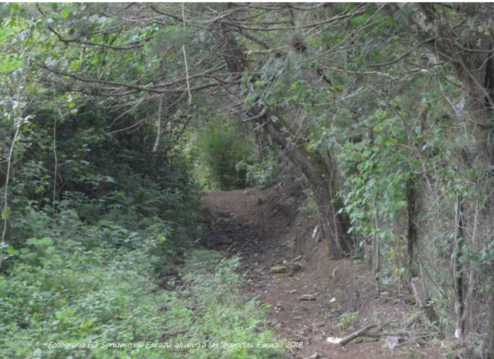
Fotografía 60. Sendero de Escazú, alusivo a las leyendas. Escazú, 2018.

“En esa época Zárate y la Tule Vieja eran las dos brujas que más desmadres hacían, con más macuás, con más enredos y con más cosas”. (José Luis)