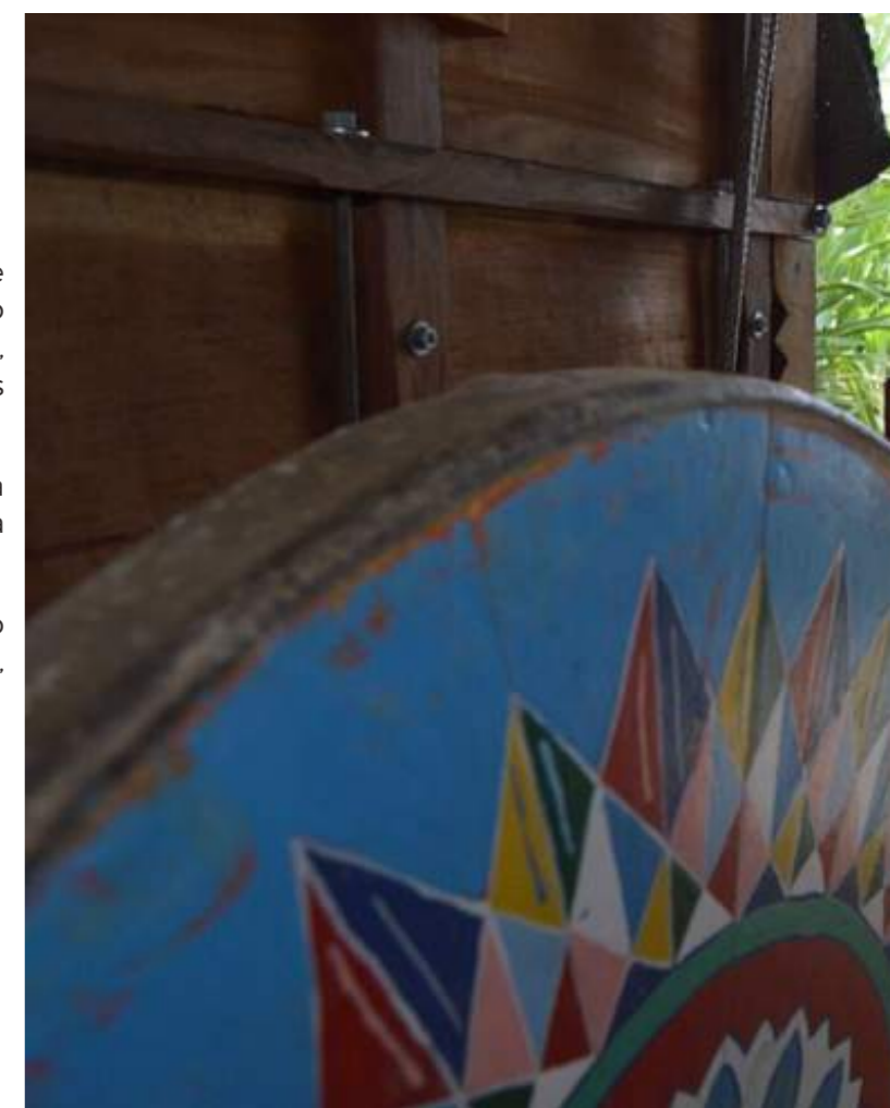
Fotografía 42. Pintura de carreta. Escazú, 2018.

Las maderas más recomendadas son: mango criollo, aguacatillo colorado, quizarra quina, balsa, joco, quizarra caca y dantisco.