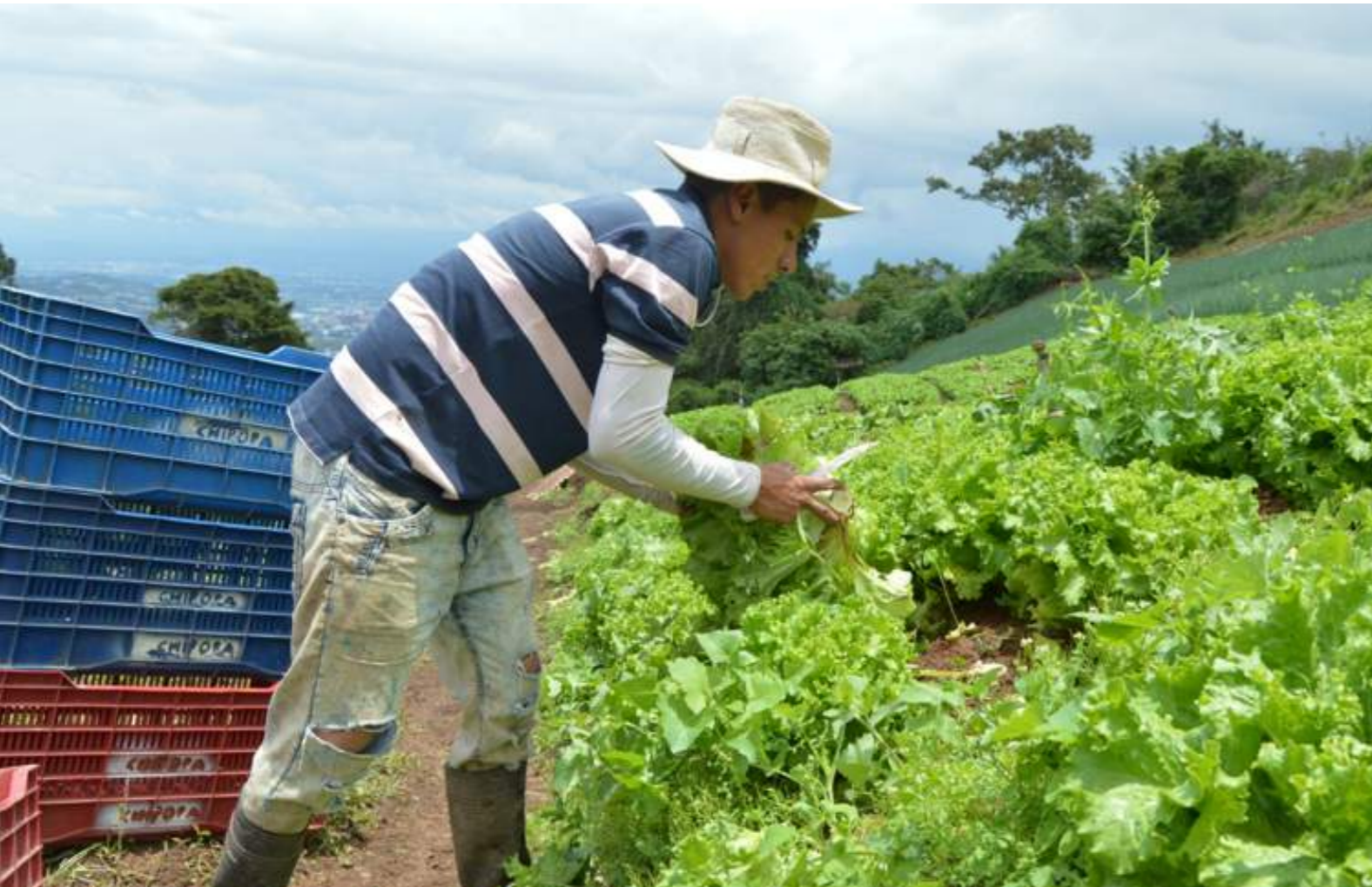
Fotografía 20. Siembra de legumbres. San Antonio, Escazú, 2018.

Hoy en día se está optando por regresar a una agricultura más tradicional, la agricultura orgánica. Esto debido a que se reconoce que el consumo de productos sembrados de manera orgánica es más sano no solo para quienes los consumen, sino también para la tierra.