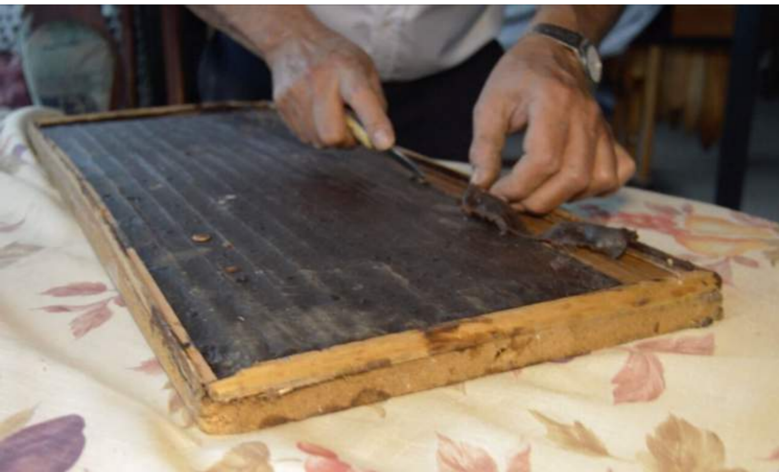
Fotografía 35. Construcción de marimbas. Escazú, 2018

Algo fundamental es el uso de tripas de cerdo y cera de abejas en la parte inferior de las jupas para darles el eco tan característico de estas.