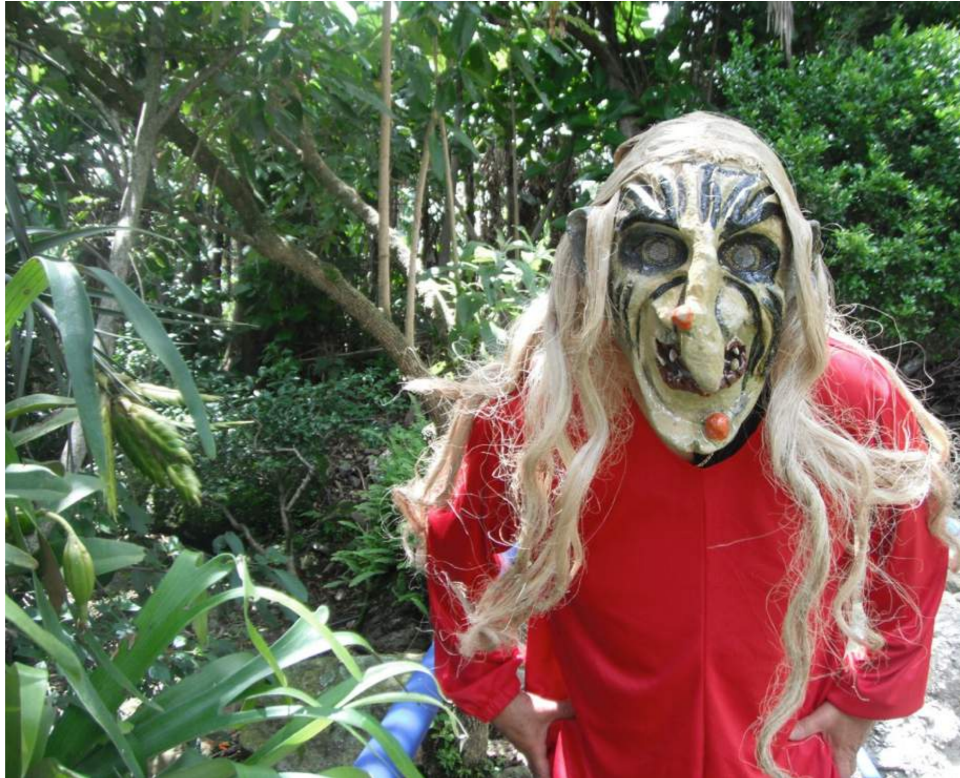
Fotografía 1. Careta construida por Pedro Arias. Escazú, 2018.