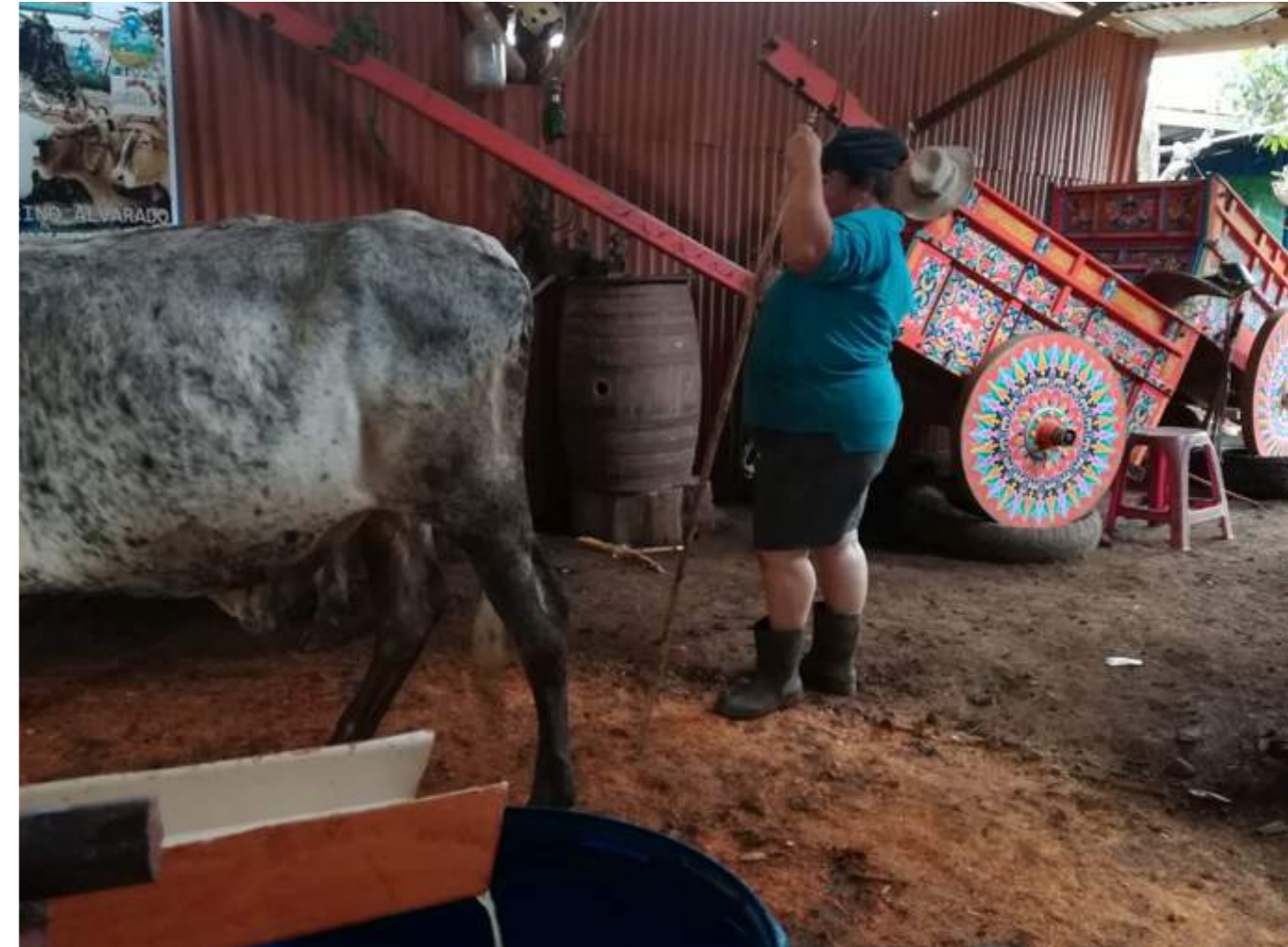
Fotografía 7. Molida de caña con bueyes, Trapiche de Don Torino. Escazú, 2018.

El patrimonio cultural material incluye obras arquitectónicas, escultura, pintura, elementos de carácter arqueológico, conjuntos de edificaciones y los lugares que sean obras conjuntas del ser humano y la naturaleza (UNESCO, 2014). Mientras que el patrimonio cultural inmaterial hace referencia a los “usos, representaciones, conocimientos y técnicas junto con los instrumentos, objetos, artefactos y espacios culturales que le son inherentes” (UNESCO, 2014), que las comunidades reconocen como parte de su patrimonio.