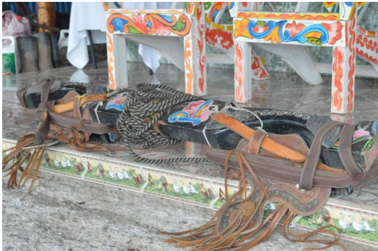
Fotografía 39. Yugo. Escazú, 2018.