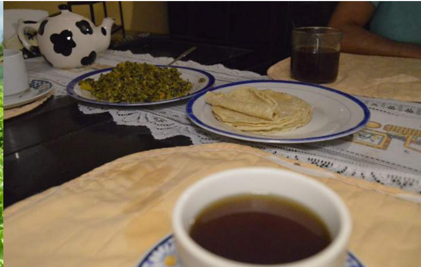
Fotografía 21. Comida tradicional, picadillo de chicasquil y café. Escazú, 2018

La cocina con leña y brasa sobre fogones, los hornos de leña y los hornos de barro que por mucho tiempo fueron la forma tradicional de preparar alimentos, todavía se conserva en el cantón de Escazú.