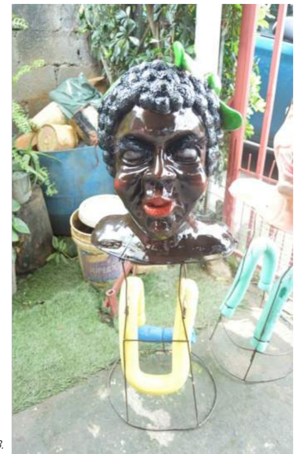
Fotografía 34. Personajes, máscaras de Mónica Fuentes. Escazú, 2018.

Se consideran estos personajes como tradicionales pues se asemejan a máscaras vistas en fotos antiguas de Pedro Arias.