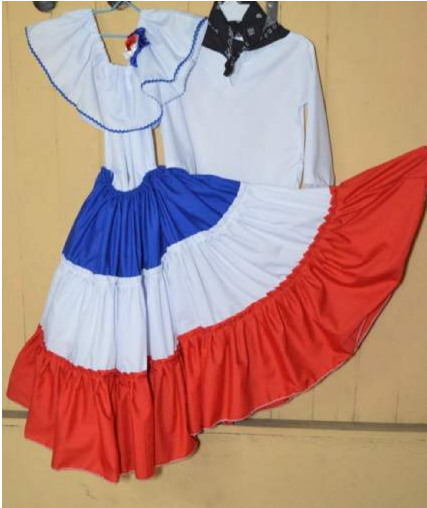
Fotografía 47. Traje típico de mujeres y hombres. Escazú, 2018.