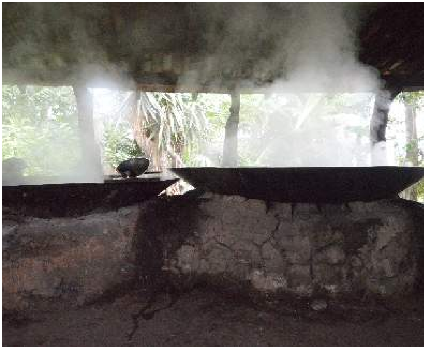
Fotografía 67. Pailas Calientes. Trapiche de Los Corrales. San Antonio, Escazú, 2018.

Bagazo: lo que queda de la caña después de haber sido molida y haber quedado sin jugo. Se aprovecha luego para meter en la hornilla del trapiche para calentar junto con la leña las pailas en donde se está cocinando el líquido de la caña.