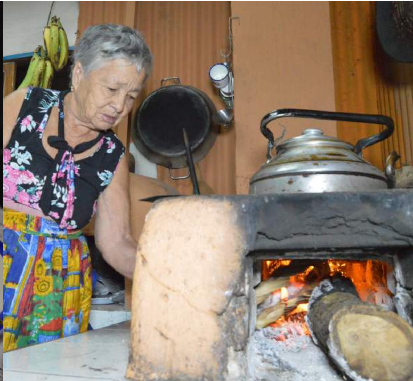
Fotografía 71. Cocinera y cocina de leña. Escazú, 2018.