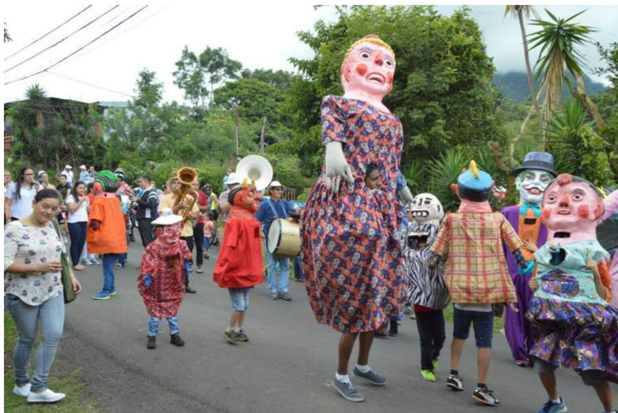
Fotografía 10. Barrios para Convivir, presentación de Mascarada. Escazú, 2018.

- Integrador, en donde se pueden compartir expresiones culturales semejantes a las de otras comunidades, que pueden ser adaptadas, transmitidas de generación en generación, pueden haber evolucionado según el entorno; pero principalmente infunden un sentimiento de identidad y continuidad histórica.