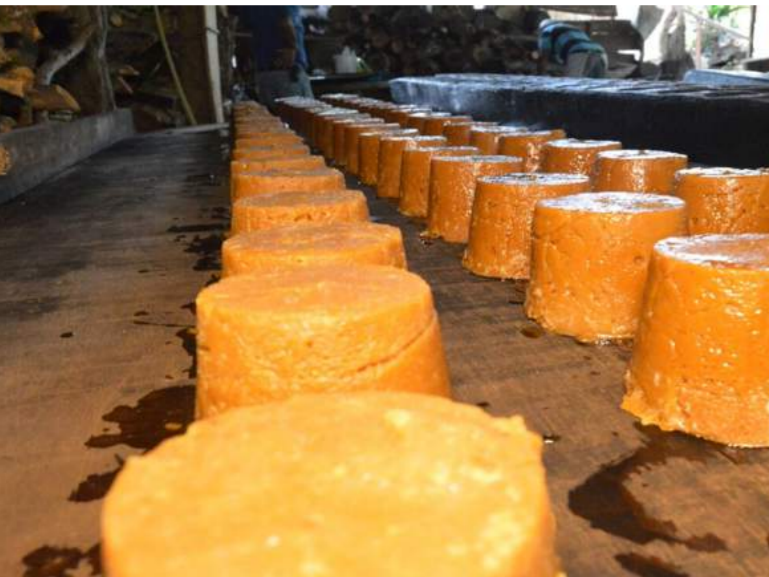
Fotografía 18. Tapa de Dulce recién hecha. Escazú, 2018.

El uso del trapiche fue cambiando con el tiempo a partir de las innovaciones tecnológicas que se adaptan a este uso, siendo el más grande el cambio de un trapiche de bueyes por uno de motor eléctrico o de gasolina.