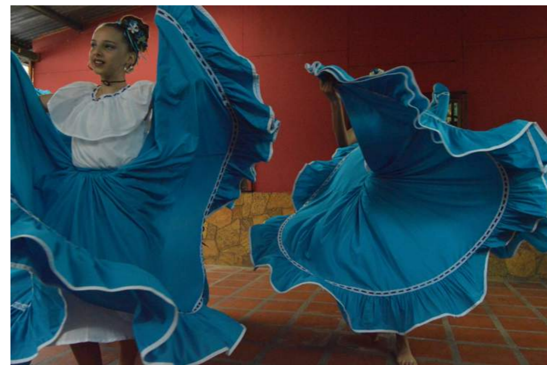
Fotografía 44. Presentación en Barrios para Convivir, Danza Folclórica Zárate. Escazú, 2018.

La marimba, al estar tan ligada al folclor costarricense, ha tenido una cobertura más mediática, y en Escazú esto no es una excepción, por lo que es más probable que quienes tocan hayan estado en concursos tanto nacionales como internacionales. Además, se les ha dado una fama y reconocimiento que posicionan a la manifestación en Escazú como de las primordiales, por lo cual se ve inclusive un aumento en el interés de las nuevas generaciones.