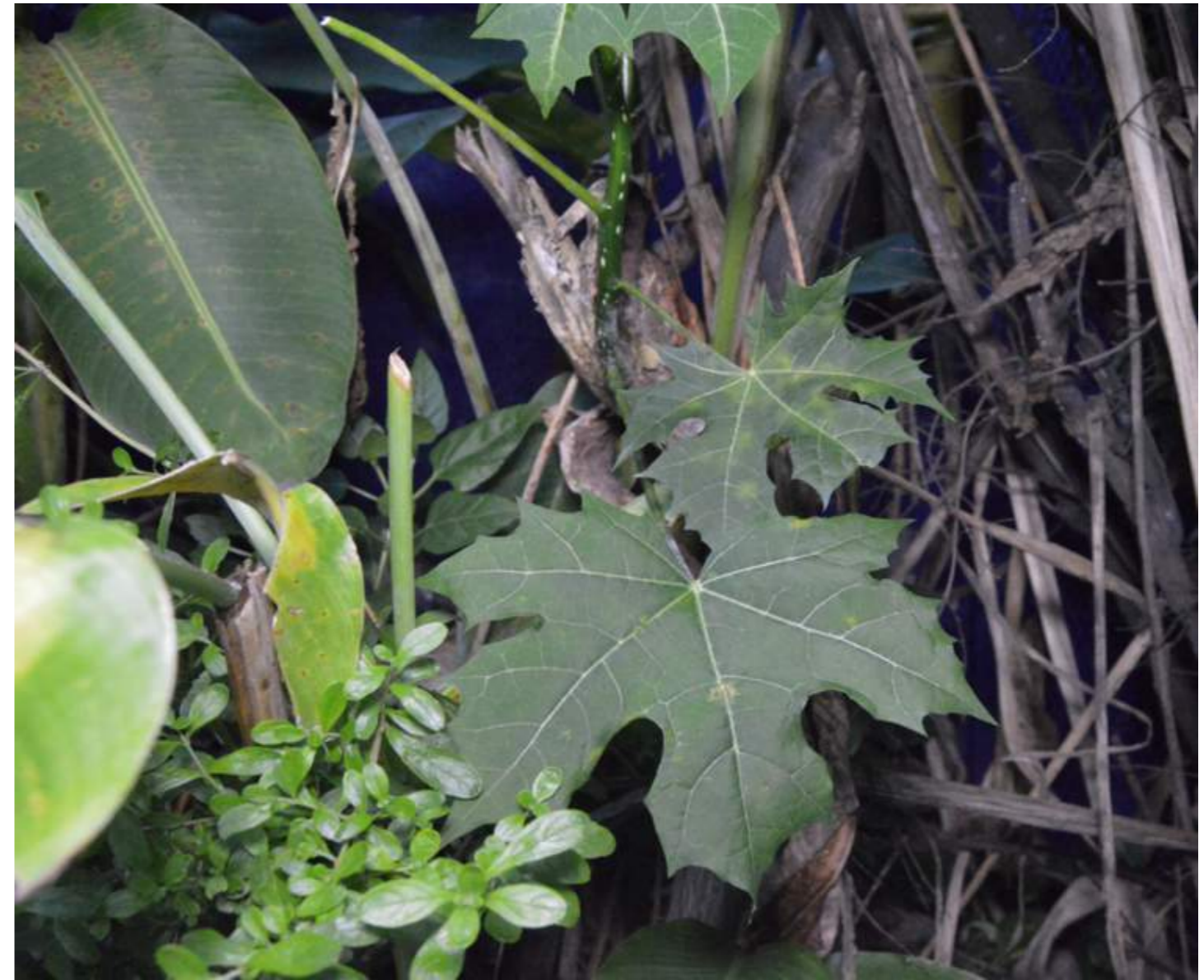
Fotografía 27. Hoja de Chicasquil. Escazú, 2018.

Dos platillos que se cocinaban en el Escazú de antaño son las muelas de cangrejo y el cangrejo asado. Estos dos platos ya no se realizan hoy en día por la dificultad de encontrar cangrejos a orillas de los ríos en el cantón, donde se solían cazar, y por la contaminación de los ríos que ha afectado la posibilidad de comer de estos animales. Estas recetas a base de cangrejo eran especiales para preparar en Semana Santa, y se cocinaban asados, tostados con cebolla o se le separaban las tenazas o “muelas” para comer con huevo.