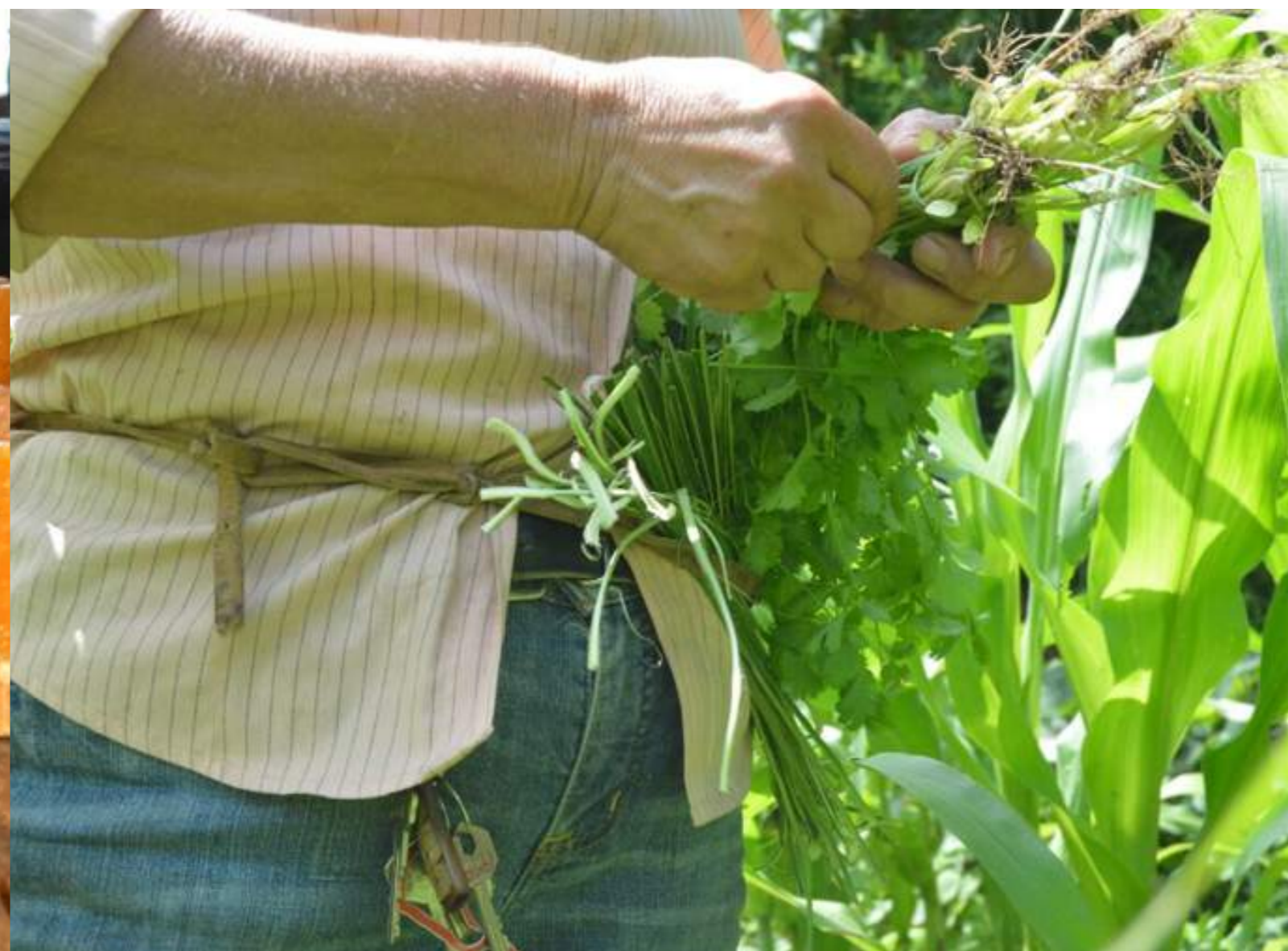
Fotografía 19. Recolección de culantro. San Antonio, Escazú, 2018.

La práctica de la agricultura en el cantón de Escazú se encuentra mayormente localizada en la zona de San Antonio. Esta presenta más interacciones con otras manifestaciones culturales, como el boyeo, la cocina tradicional y el uso del trapiche. Como se suele decir, la agricultura, el boyeo y la cocina vienen siempre entrelazadas.