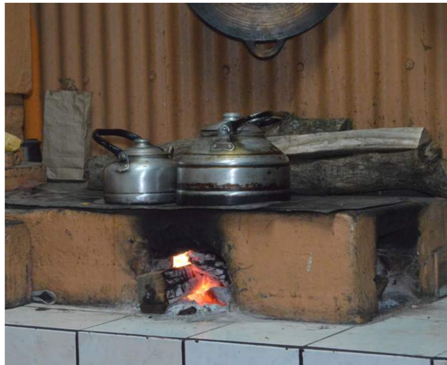
Fotografía 12. Cocina de Leña. Escazú, 2018.

- Basado en la comunidad, de forma que un bien solo puede ser patrimonio cultural inmaterial si las comunidades, grupos e individuos lo reconocen de esta forma y lo transmiten, de manera que nadie puede decidir sobre un grupo social cuál expresión debe formar parte de su patrimonio.