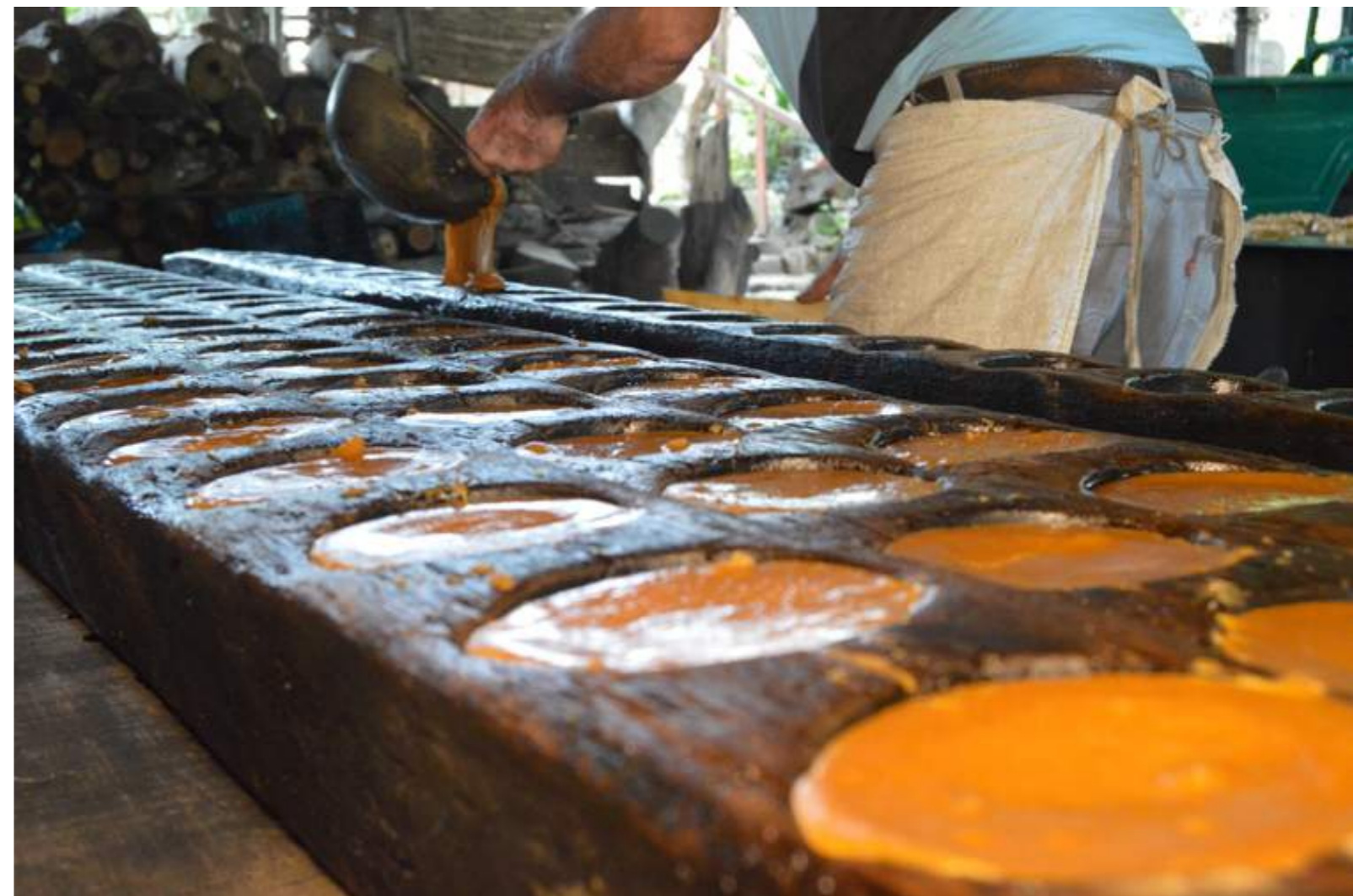
Fotografía 15. Trapiche de don Hilario. Escazú, 2018.

“El trapiche es un instrumento para sacar jugo de caña, de ahí se procesa y se hace el dulce.” (Hannia)