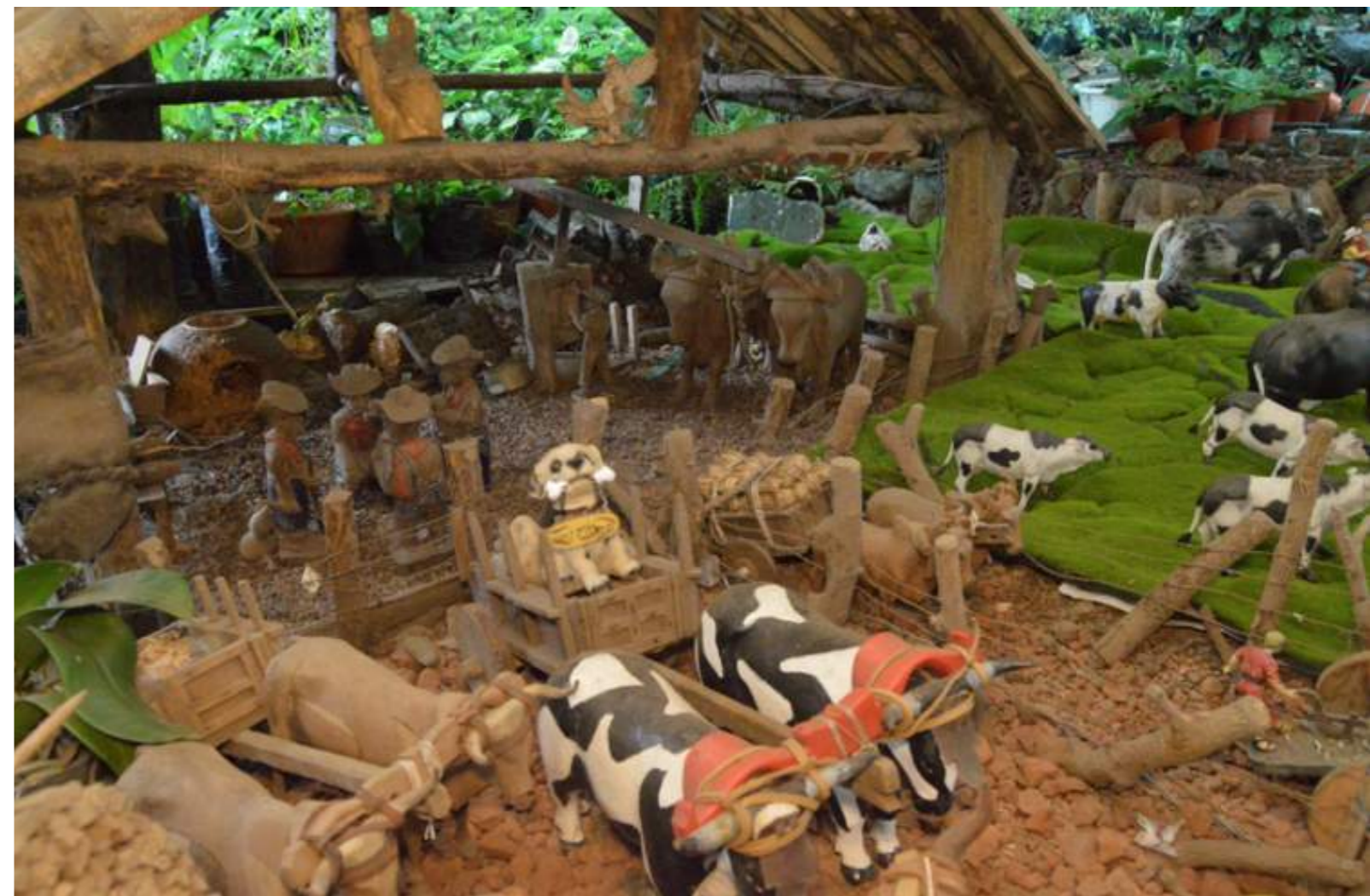
Fotografía 13. Portal grande. Escazú, 2018.

A continuación, se presentan aquellas manifestaciones culturales que se identificaron como parte de la identidad escazuseña durante la construcción del inventario.