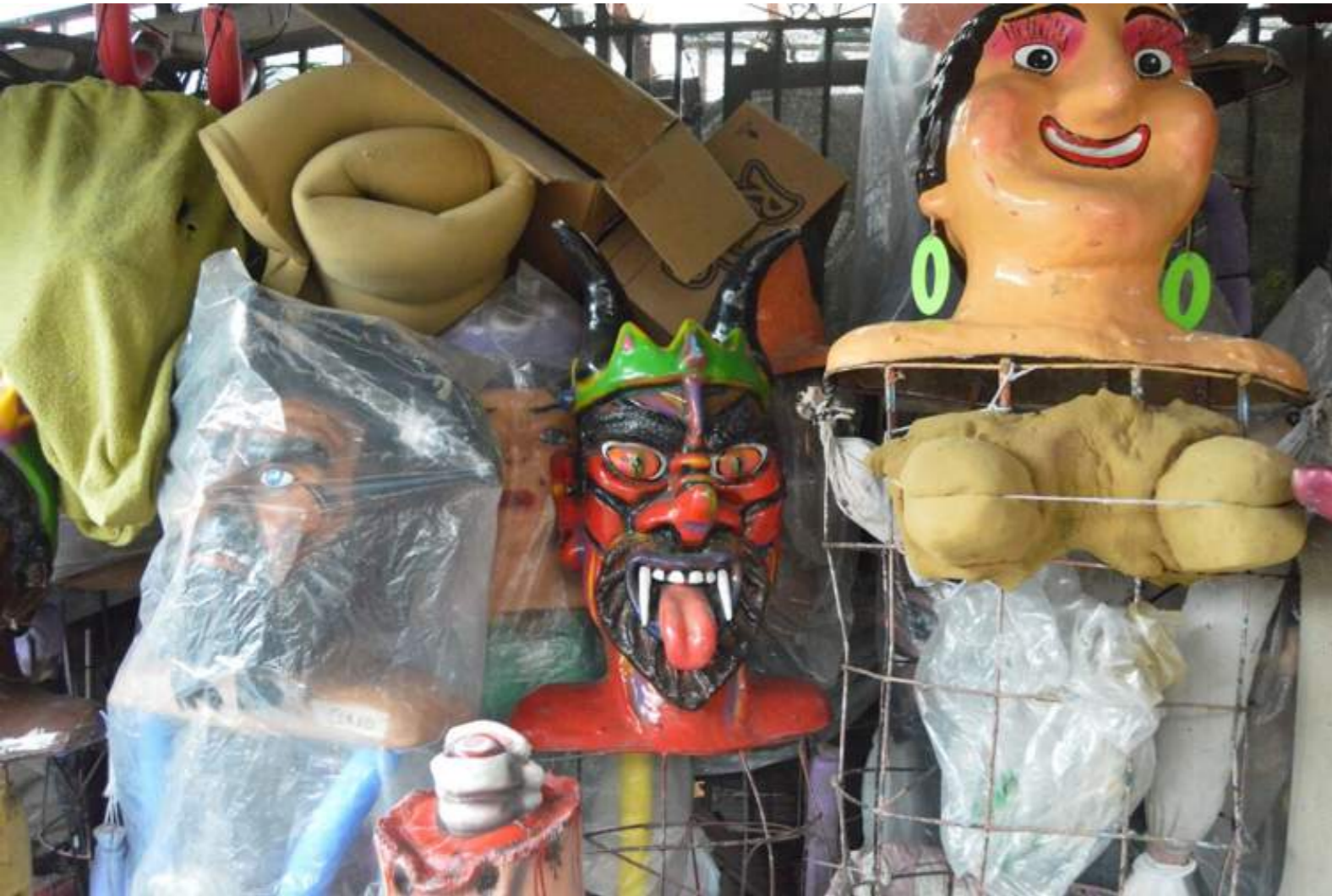
Fotografía 32. Materiales que se usan para las máscaras, estructuras sin vestido. Escazú, 2018.

Las máscaras originalmente fueron construidas a partir del barro natural, en donde se les daba forma a la cara deseada, para luego ser empapelado con goma de harina y papel de cemento una vez que el barro había secado. Después de empapelar, se separaba del barro y se procedía a pintar los rasgos de la cara. Una vez montado se le podía poner la armadura (ya fuera en madera o metal) y finalmente la vestimenta necesaria para que se pudiera sacar a bailar. Esta técnica de trabajo se busca mantener y rescatar por muchas personas mascareras en Escazú, que recalcan la importancia de hacer máscaras que reflejan la historia de su creación.