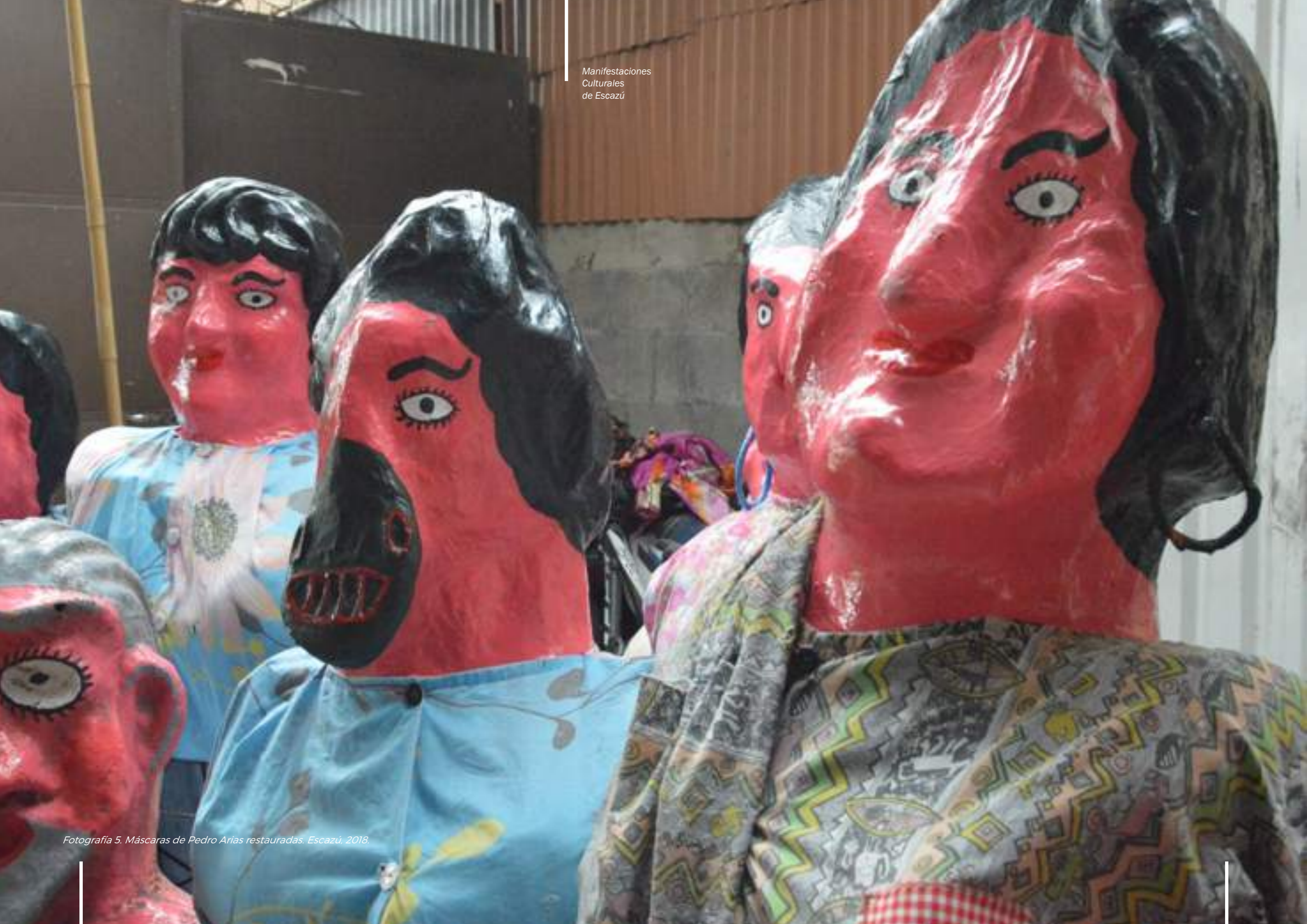
Fotografía 5. Máscaras de Pedro Arias restauradas. Escazú, 2018.