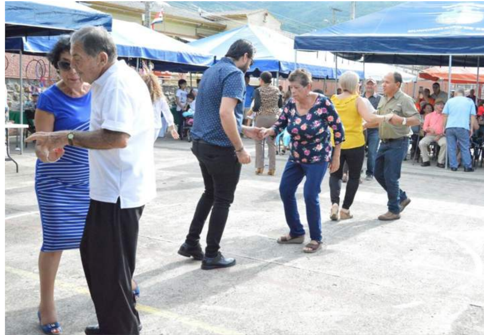
Fotografía 48. Baile de swing criollo en actividad pública. Escazú, 2018.

El bolero criollo es una forma de baile que las personas reconocen en gran parte al ver a sus familiares, padres y madres bailar en fiestas de sus casas y eventos familiares. Es un baile que se practicaba con regularidad por distintas generaciones y que aún puede verse en la cotidianidad de las personas.