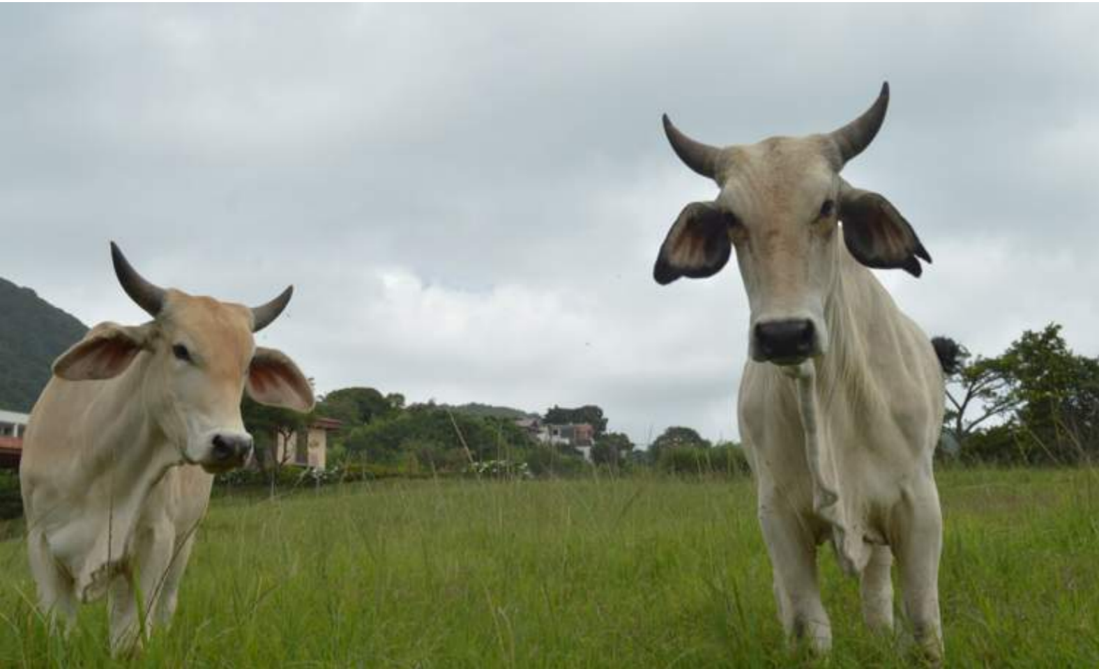
Fotografía 65. Bueyes. Escazú, 2018.

En el boyeo existen expresiones que se le dicen a los bueyes y también jergas de lo que se utiliza para la actividad. Entre ellas encontramos: