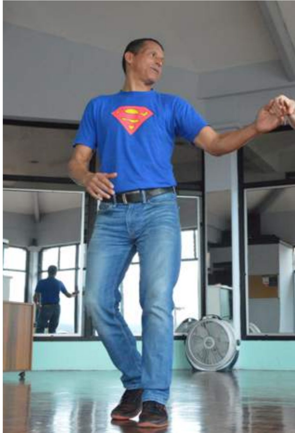
Fotografía 49. Profesor de Swing Criollo. Escazú, 2018.

Con el paso del tiempo, el swing criollo tuvo sus cambios y procesos, en lo que se empiezan a reconocer dos tendencias principales en su forma de baile: la vieja guardia y la nueva guardia