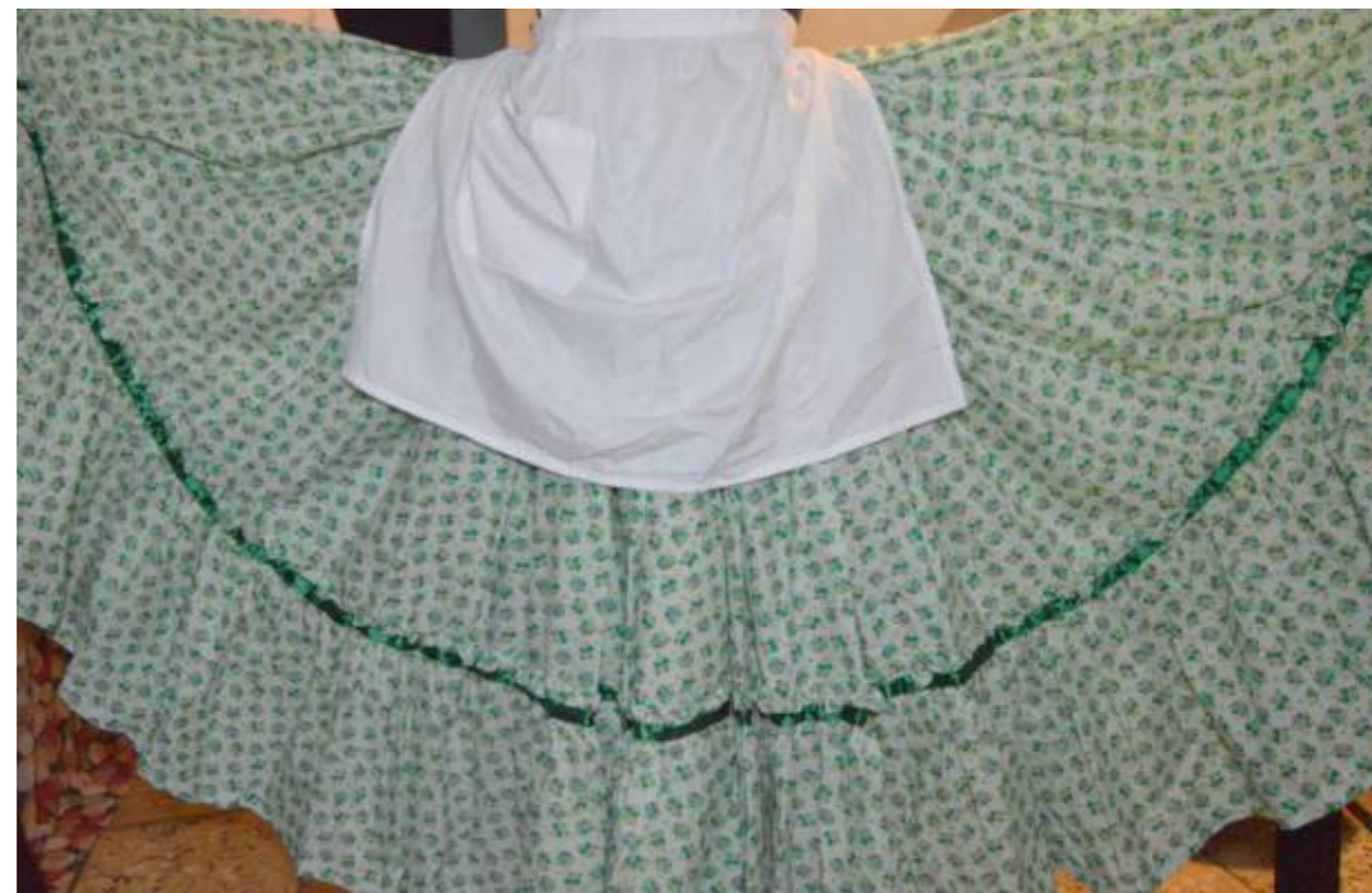
Fotografía 46. Traje con delantal de Baile Folclórico, Escazú, 2018.

El baile folclórico se caracteriza en Escazú por organizarse a partir de grupos conformados, ya sean independientes, o avalados por un centro educativo, empresa o institución privada. Su inicio, como mencionaron las personas con quienes se trabajó en el cantón, puede ser registrado al año 1978 con la Asociación Folclórica Escazuseña conformando un grupo en el Liceo de Escazú.