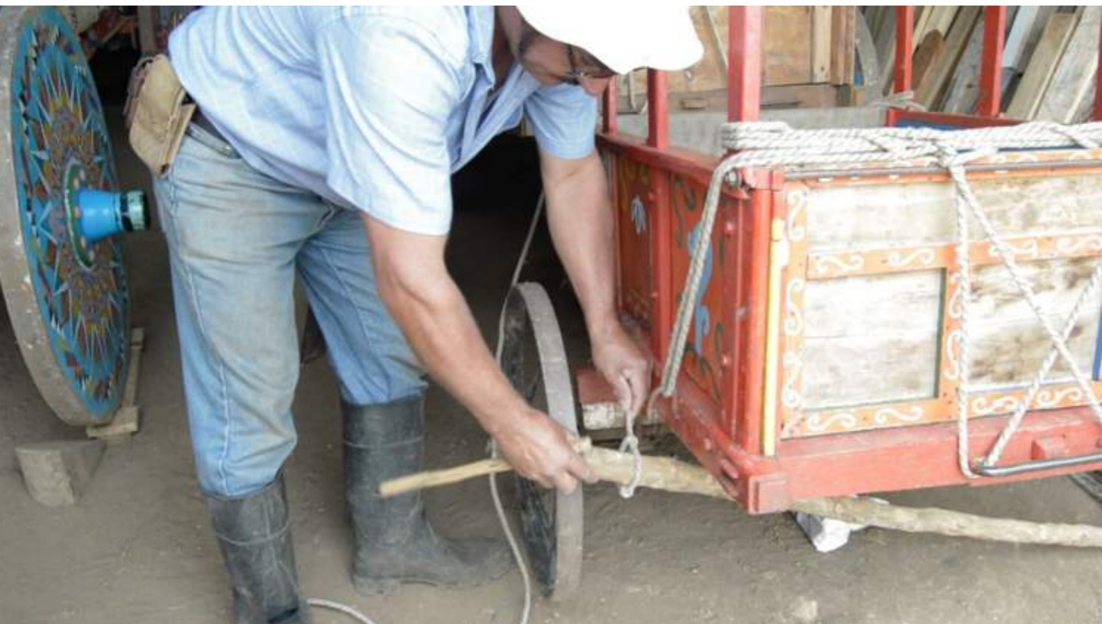
Fotografía 37. Boyero explicando el freno en una carreta con bueyes. Escazú, 2018.

Estas son: la construcción de carretas tradicionales, la restauración de carretas y la construcción de yugos.