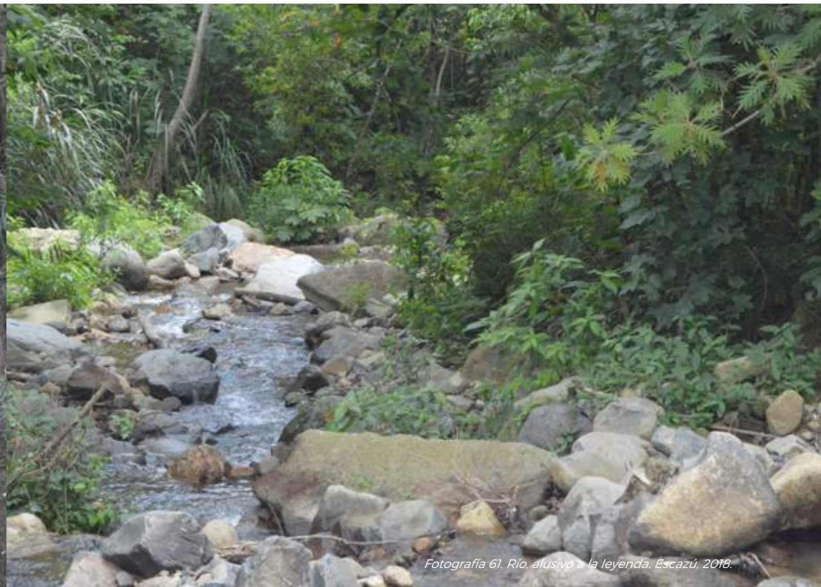
Fotografía 61. Río, alusivo a la leyenda. Escazú, 2018.