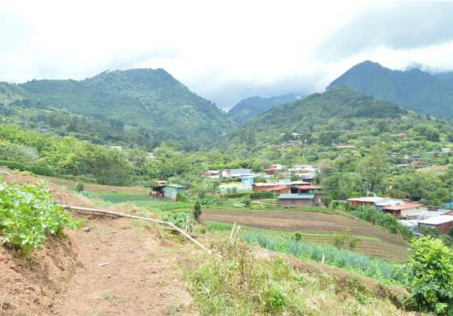
Fotografía 63. Cultivos de legumbres, casas y montañas. Escazú, 2018.

A continuación, se describirán aquellas expresiones que se usan en la práctica de la agricultura, el boyeo y el trapiche.