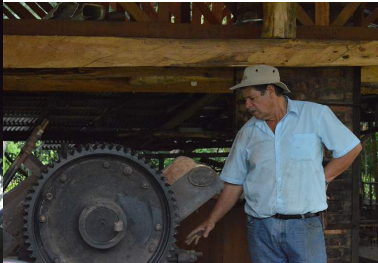
Fotografía 17. Trapiche de Tite. Escazú, 2018

El uso del trapiche para crear dulce se liga de manera extensiva con la agricultura, especialmente con la siembra de la caña que se va a utilizar, ya que influye la forma de cosecha de la caña, para que sea caña sazona y que permita el mejor sabor a la hora de su trituración y cocción. La caña se ve como un producto que rodea y completa totalmente este proceso, ya que no solo se aprovecha su uso para cocción, sino que el bagazo (fibra de la caña sin jugo después de haber sido molida) se aprovecha para quemar el horno que calentará las pailas donde se cocina el jugo, y las cenizas restantes se recolectan y filtran con agua pura para obtener lo que le llaman lejía, que, junto con baba natural de mozote o burio, se agrega al líquido de caña para limpiar y darle la consistencia deseada.