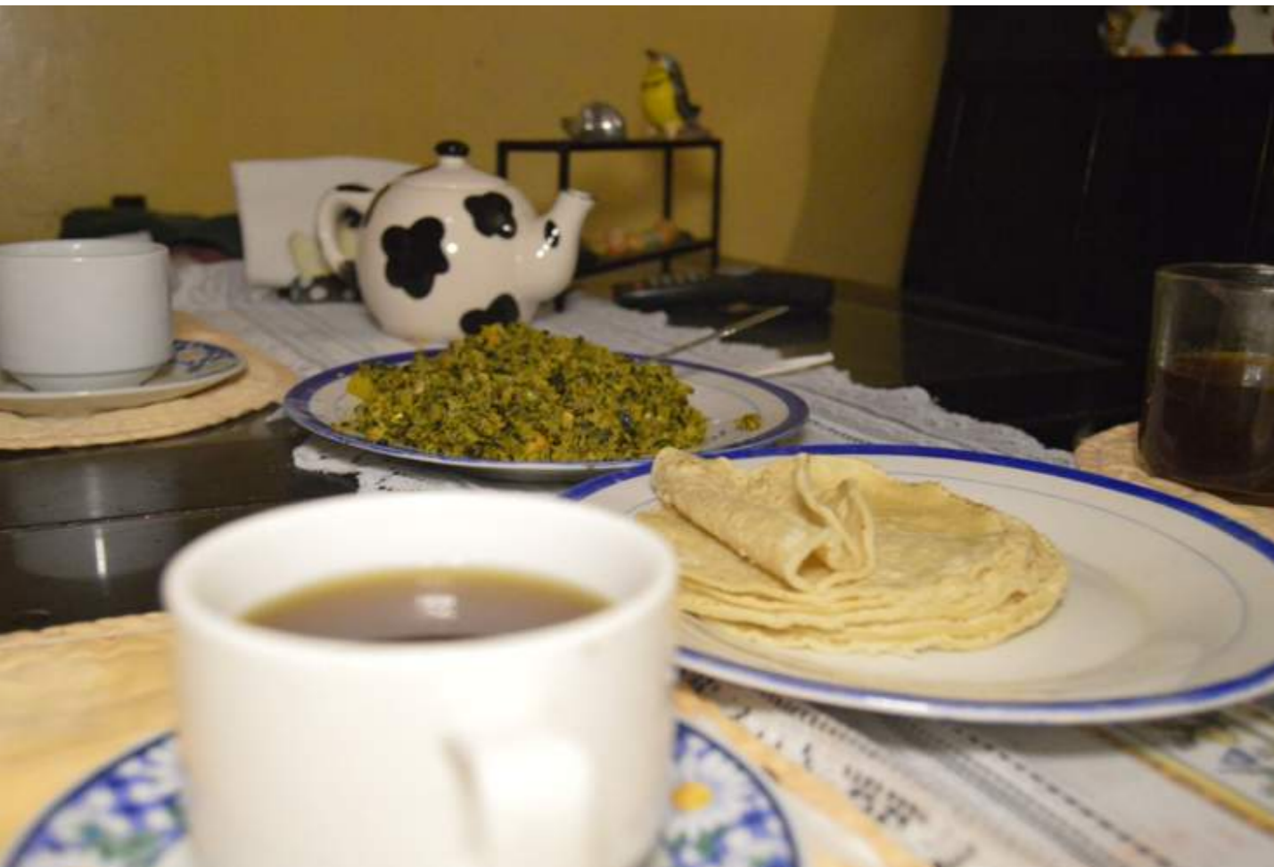
Fotografía 26. Picadillo de chicasquil. Escazú, 2018.

“Durante la celebración del Santo Patrono de San Miguel, se realizaba un picadillo para dedicárselo al Santo, se le llamaba el picadillo de San Miguel”. (Amalia, oriunda de Escazú, 2018)