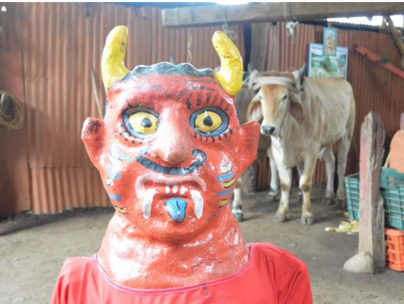
Fotografía 8. Máscara del diablo, bueyes y trapiche. Escazú, 2018.