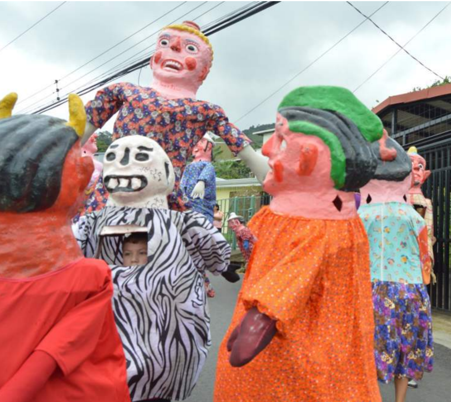
Fotografía 51. Mascarada en Barrios para Convivir. Escazú, 2018.

Un dato por resaltar es que no todas las personas que saben bailar las máscaras las saben construir. Esto porque al hacer una mascarada, se sacan varias máscaras a la calle, lo cual implica que las y los mascareros contacten a diferentes personas a que bailen con una de sus máscaras asignadas.