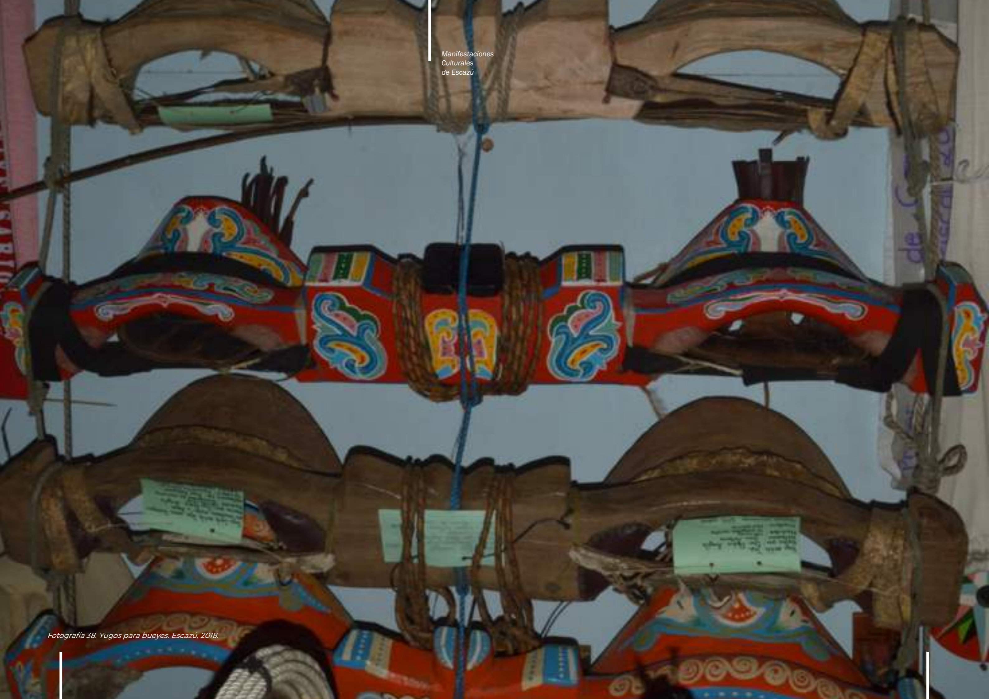
Fotografía 38. Yugos para bueyes. Escazú, 2018.