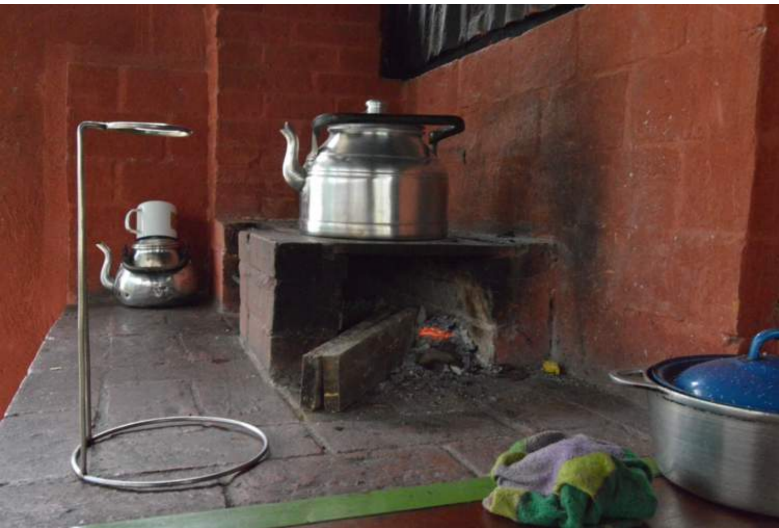
Fotografía 24. Cocina de leña con ladrillo. Escazú, 2018.

Los olores son una diferencia grande entre la cocina tradicional y no tradicional, ya que antes la cocina tradicional era menos artificial por el uso de "olores", en lugar de usar condimentos comprados y procesados que se encuentran en supermercados (como, por ejemplo, cubitos de condimento o las conocidas como bomba), con la excepción de la pimienta y la sal.