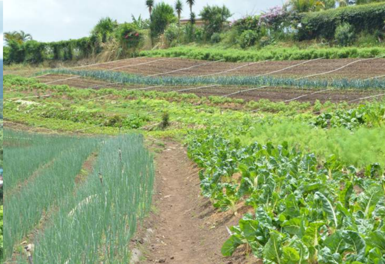
Fotografía 64. Siembra de legumbres. San Antonio, Escazú, 2018.