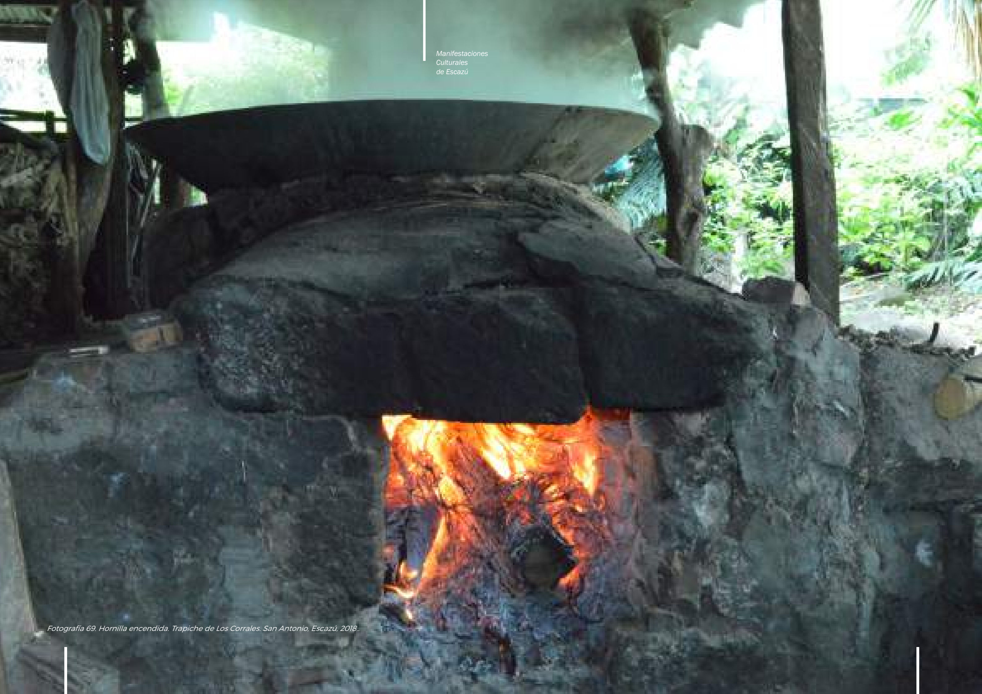
Fotografía 69. Hornilla encendida. Trapiche de Los Corrales. San Antonio, Escazú, 2018.