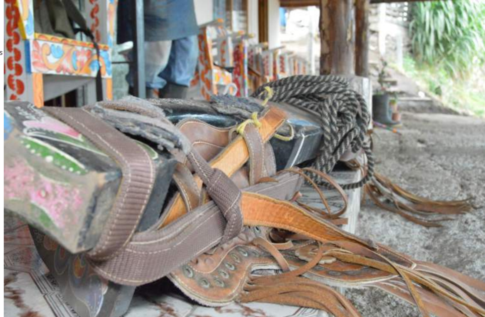
Fotografía 41. Yugos. Escazú, 2018.