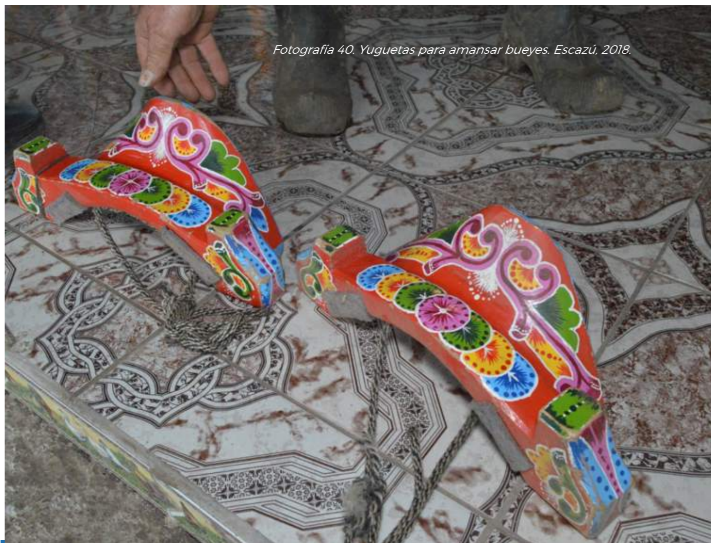
Fotografía 40. Yuguetas para amansar bueyes. Escazú, 2018.

La pintura, el tamaño del cajón y el tipo de ruedas necesarias ya no se construyen pensando únicamente en ser utilizadas en calles rurales, sino también en las ciudades donde muchos desfiles toman lugar.