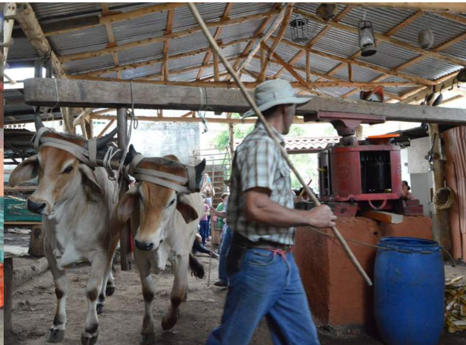
Fotografía 9. Trapiche de Don Torino. Escazú, 2018

Es decir, es patrimonio material una casa de adobe, pero la restauración y el cuidado de esta es un conocimiento que pertenece al patrimonio cultural inmaterial. La cocina de leña es un bien cultural material, pero el saber usarla, es inmaterial. El trapiche en sí como estructura es material, pero el cuidado, el saber hacer dulce de caña, el manejo de los bueyes, de la siembra, entre otros; son conocimientos inmateriales.