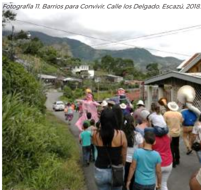
Fotografía 11. Barrios para Convivir, Calle los Delgado. Escazú, 2018.

- Basado en la comunidad, de forma que un bien solo puede ser patrimonio cultural inmaterial si las comunidades, grupos e individuos lo reconocen de esta forma y lo transmiten, de manera que nadie puede decidir sobre un grupo social cuál expresión debe formar parte de su patrimonio.