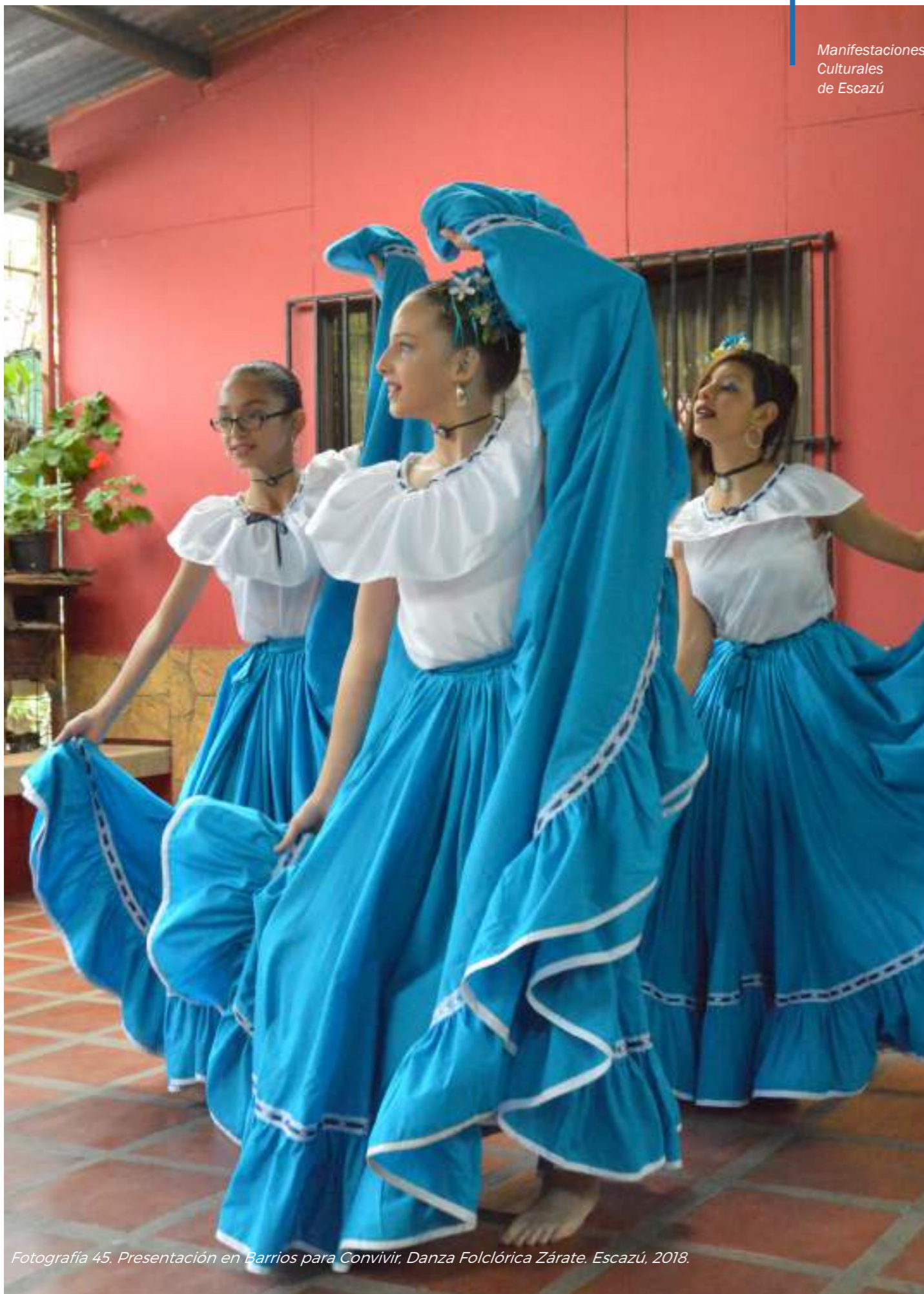
Fotografía 45. Presentación en Barrios para Convivir, Danza Folclórica Zárate, Escazú, 2018.

El baile folclórico se caracteriza en Escazú por organizarse a partir de grupos conformados, ya sean independientes, o avalados por un centro educativo, empresa o institución privada. Su inicio, como mencionaron las personas con quienes se trabajó en el cantón, puede ser registrado al año 1978 con la Asociación Folclórica Escazuseña conformando un grupo en el Liceo de Escazú.