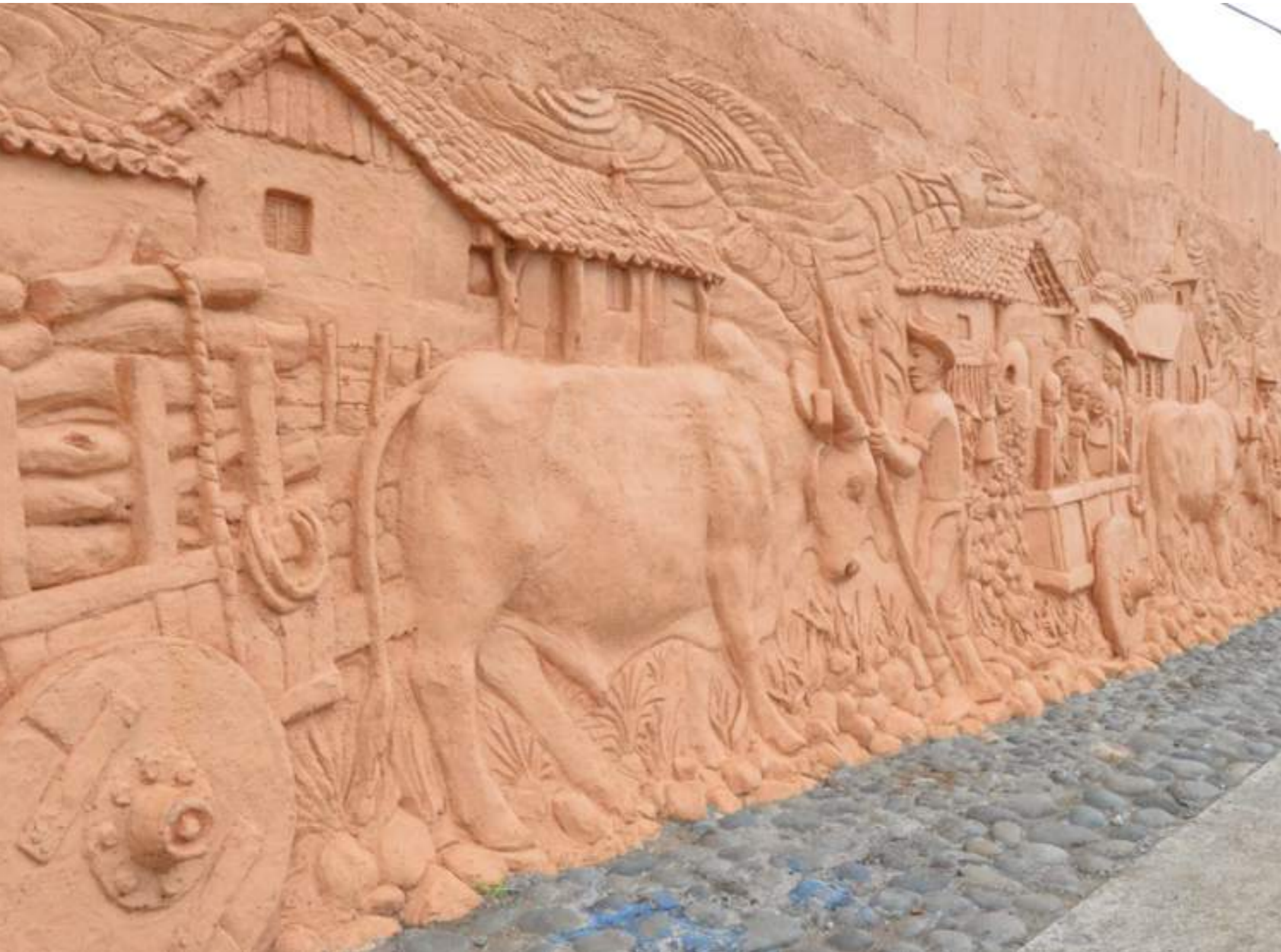
Fotografía 2. Monumento al boyeo. San Antonio, Escazú, 2018.