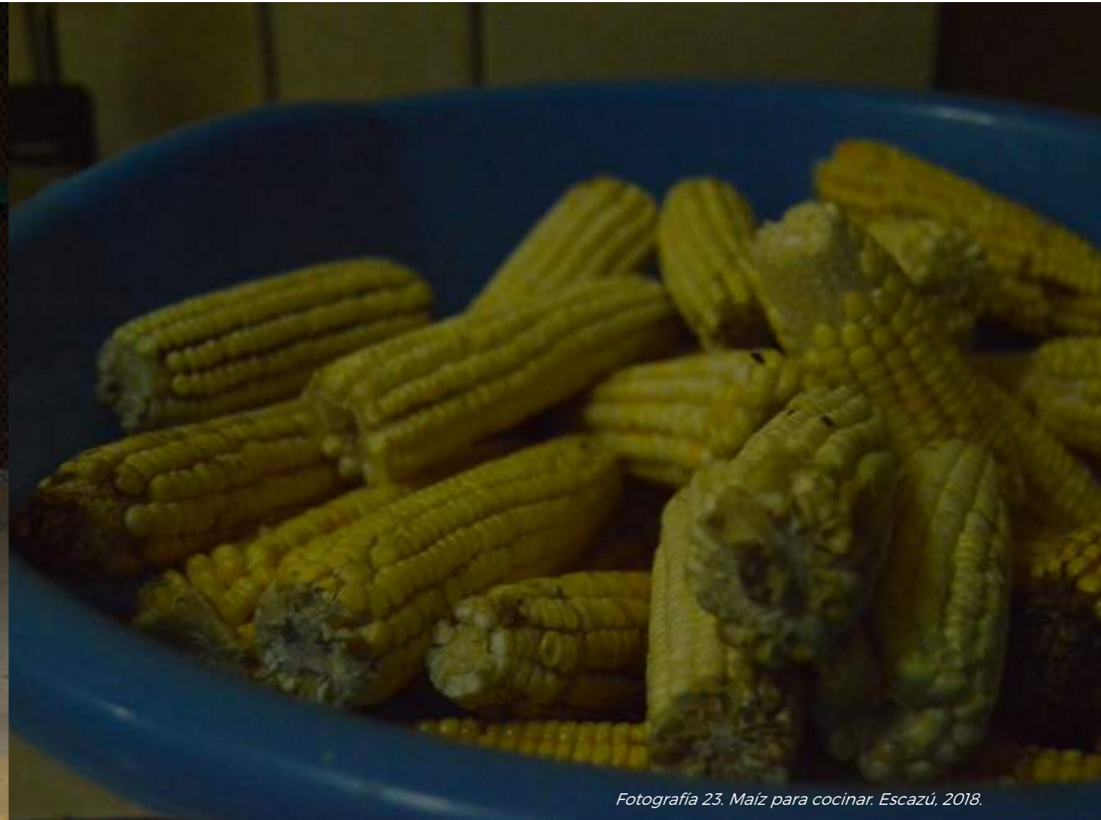
Fotografía 23. Maíz para cocinar. Escazú, 2018.

Además se destaca la importancia de que cada plato cuente con los "olores" tradicionales.