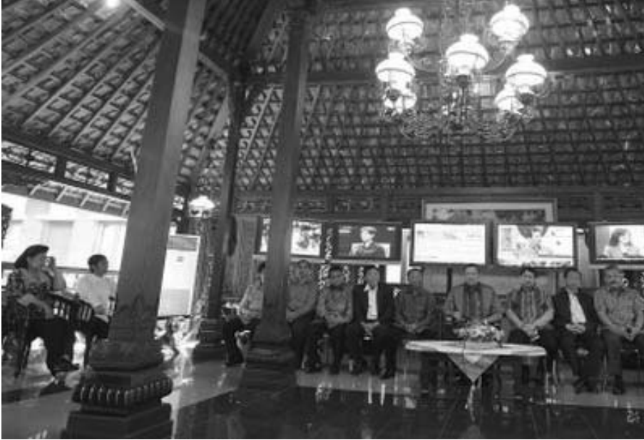
Puri Cikeas, kediaman SBY, kini menjadi simbol politis keluarga besar SBY dan kolega-koleganya.