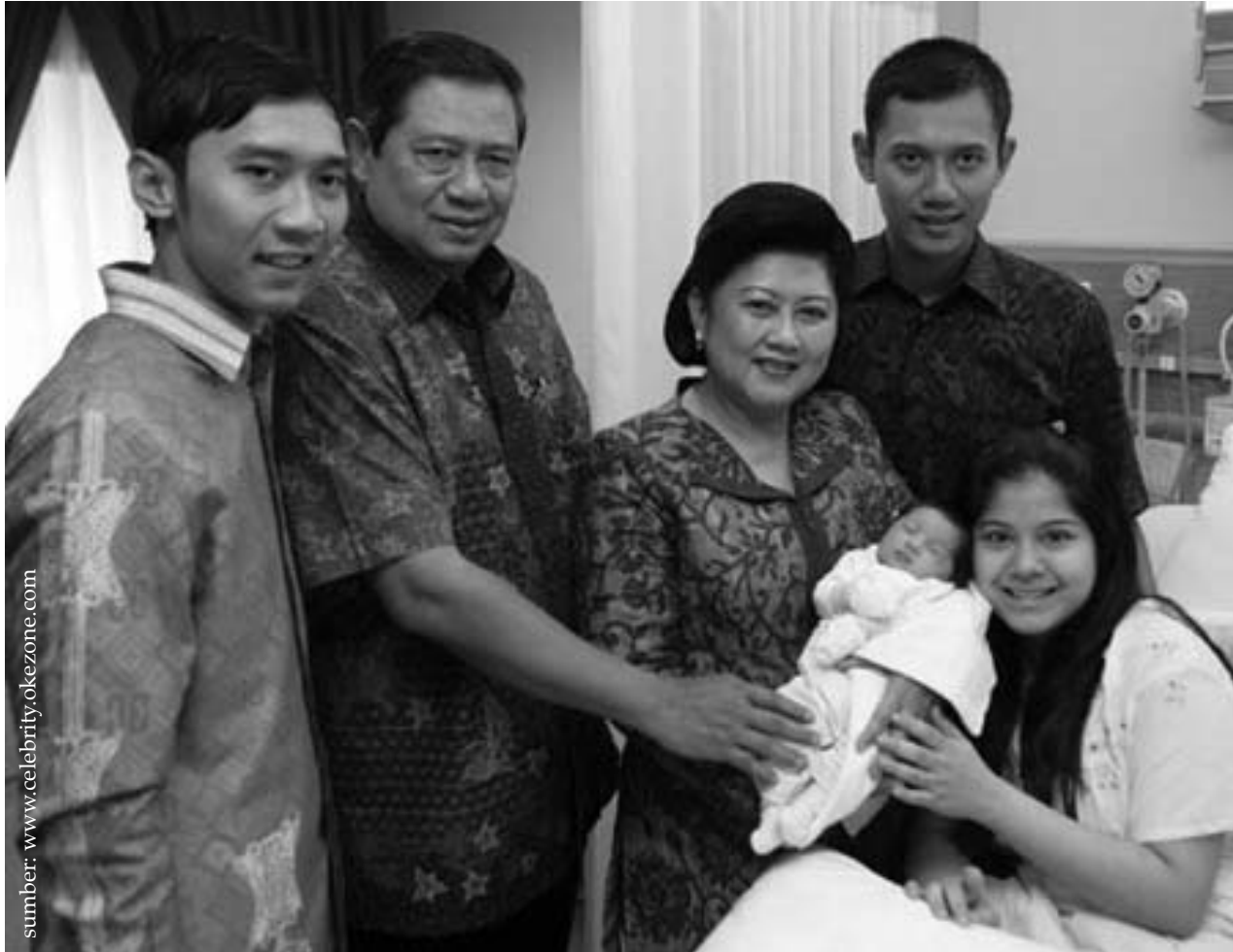
Keluarga besar Susilo Bambang Yudhoyono-Ny. Ani Yudhoyono.