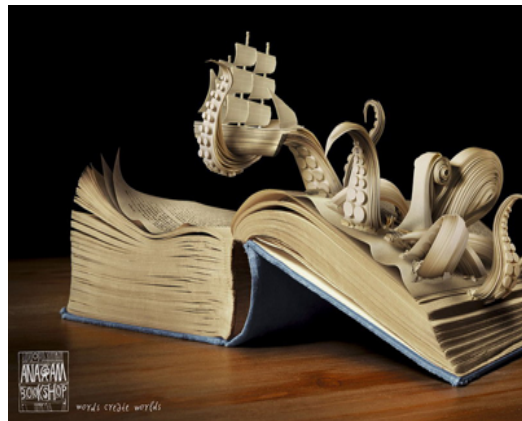
Gambar 4. Anagram Bookshop “Sea Monster”