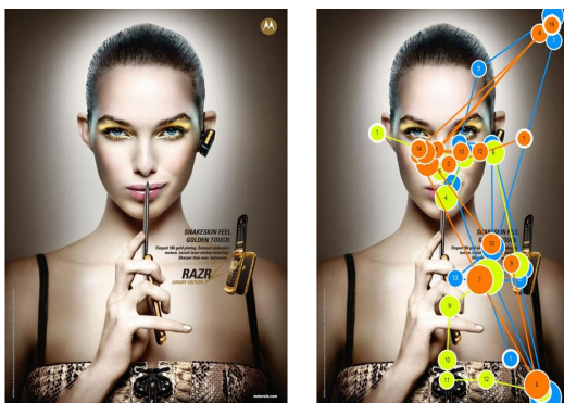
Gambar 2. Gaze Plot pada iklan MotoRAZR.

Contoh aplikasi visualisasi teknik eye tracking pada beberapa iklan cetak :