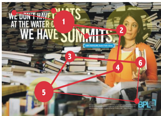
Gambar 7. Hasil analisis eye tracking (sampel 2)

Menurut para responden, urutan visual paling menarik dari sampel 1 adalah; kapal, gurita, dan tentakel, seperti yang ditunjukkan pada heat map (kuning) sampel 1 di gambar 6. Sedangkan urutan fokus mata responden berturut-turut adalah; (1) kapal – (2) tentakel – (3) gurita – (4) lembaran – (5) halaman tebal. Hasil ini terbukti serupa dengan hasil metode visual interpretatif, yang menyatakan fokus visual ada pada kapal dan tentakel.