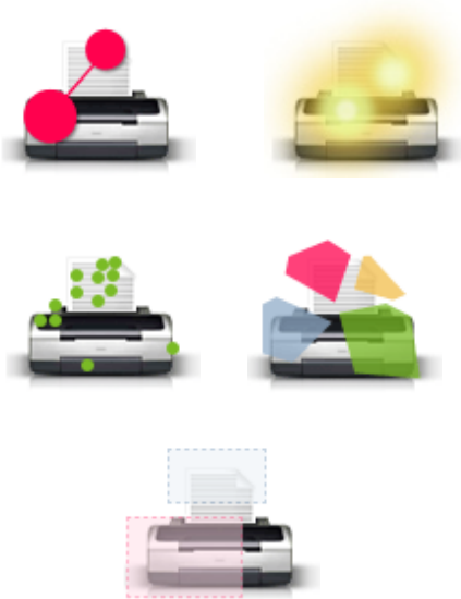
Gambar 1. Visualisasi teknik eye tracking; (a) Gaze Plot, (b) Heat Map, (c) Bee Swarm, (d) Cluster, (e) Areas of Interest.

Gambar 1 merupakan visualisasi eye tracking yang berikutnya akan diaplikasikan pada iklan cetak ( print-ad ), dengan tujuan untuk menganalisis tanggapan konsumen ( target audience ) pada iklan tersebut.