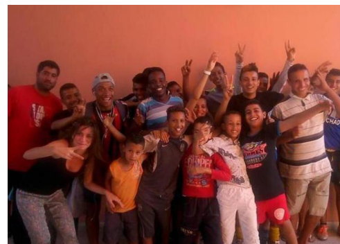
Les jeunes Tourangeaux ont séjournés dans un centre d'accueil de Casablanca.