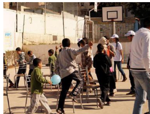
Le centre d'accueil de Casablanca, où interviendront les dix jeunes Tourangeaux, reçoit plus de 300 enfants, de 5 à 18 ans.

Lien pour consulter la suite de l'article : http://www.lanouvellerepublique.fr/indre-et-loire/Communes/NRiv/Contenus/Articles/2014/08/22/Dix-jeunes-Tourangeaux-aident-les-petits-Marocains-2019973