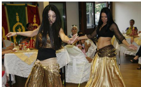
Démonstration de danses orientales.