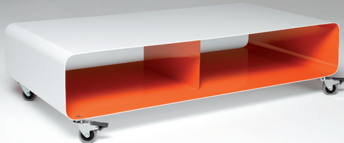
SIDEBOARD RW 200-2 h: 26_ b: 100_ t: 50 (cm)