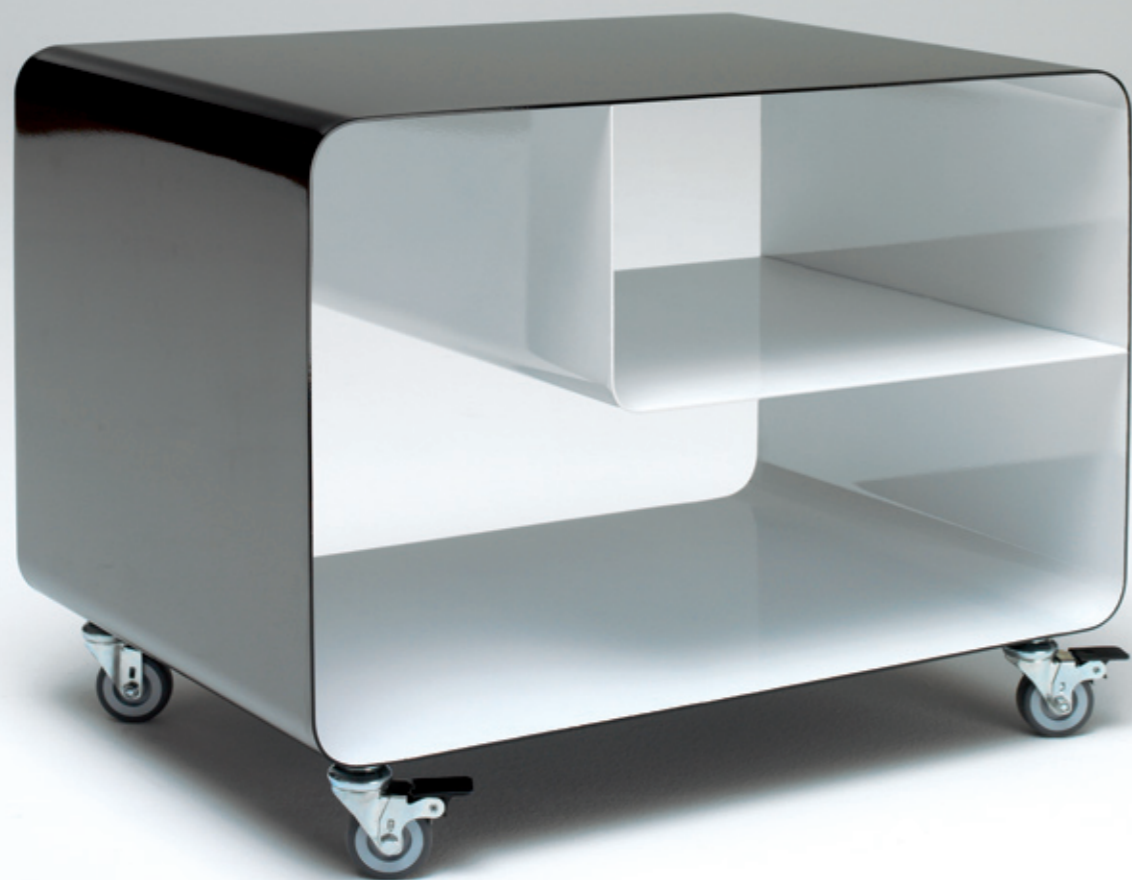
ROLLWAGEN RW 106 h: 46_ b: 60_ t: 40 (cm)