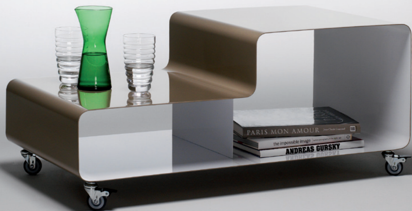
COUCHTISCH RW 300 h: 26/43_ b: 100_ t: 50 (cm)

Farbe zum einen, Farbe zum anderen. Seit Jahren erfreut die bewährte mobile line seine Fangemeinde mit neuen Details und weiteren Formen. Jetzt haben wir das Farboutfit revolutioniert – ein Verdienst unserer Werkstattmeister. Dank äußerst exakter Handwerksarbeit bieten wir mobile line jetzt auch mit zwei Wunschfarben in einem Möbel: Innenlackierung in der einen Farbe, Außenlackierung und Kanten in der anderen. Ein absoluter Wow-Effekt in allen denkbaren RAL-Kombinationen.