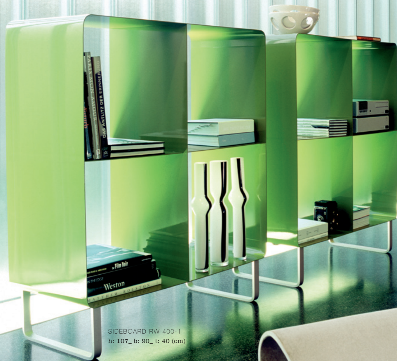
SIDEBOARD RW 400-1 h: 107_ b: 90_ t: 40 (cm)

Was man will, wo man will. Mobile line ist die Designidee für Schönheit, Funktionalität und Individualität in einem. Leicht, beweglich und stabil setzen die Möbel geschmackvolle Glanzlichter an jedem Platz. Das 2,5 mm starke Metall wird bei uns im Haus in der Handpresse bearbeitet, handgeschweißt und von Hand in allen RAL-Farben lackiert. Mobile line Möbel sind langlebig und belastbar und bewegen sich bei jedem neuen Wohn- oder Arbeitskonzept ganz einfach mit.