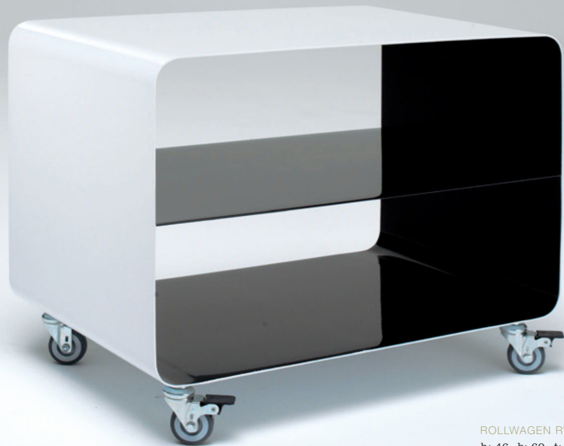
ROLLWAGEN RW 103 h: 46_ b: 60_ t: 40 (cm)