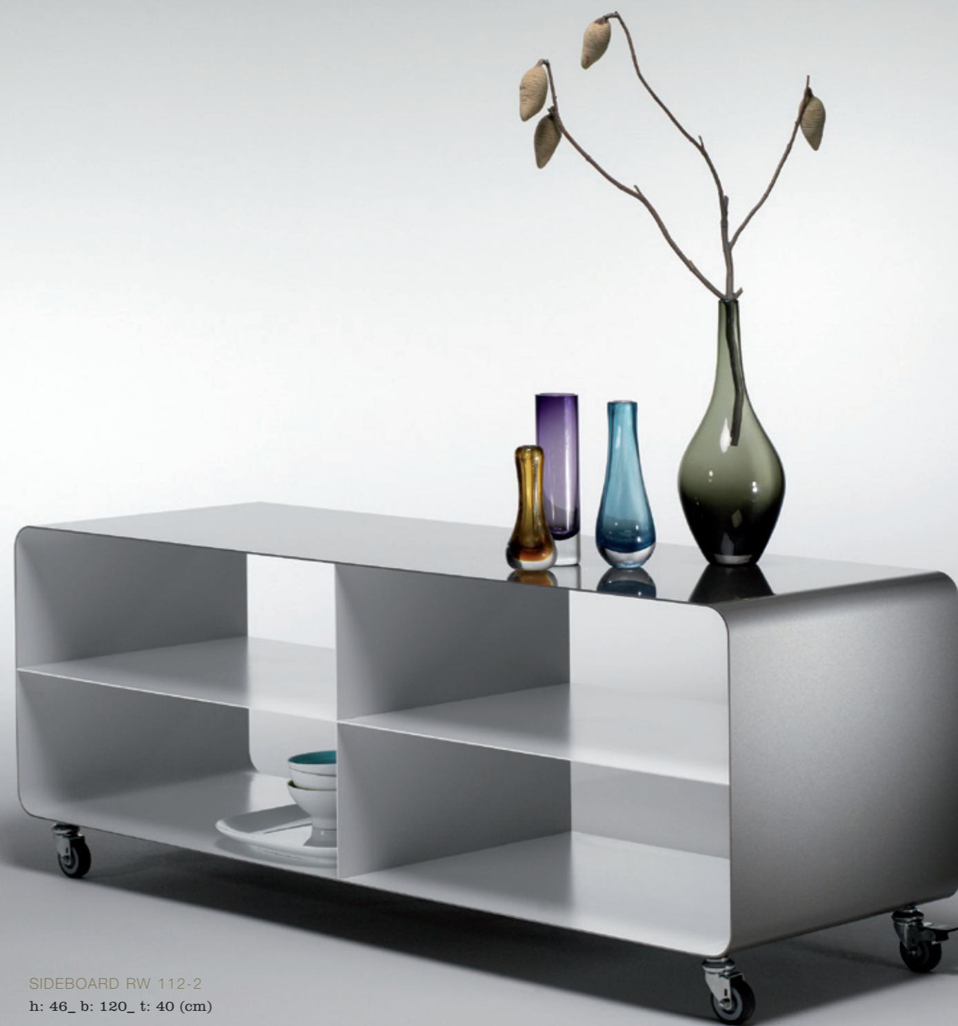
SIDEBOARD RW 112-2 h: 46_ b: 120_ t: 40 (cm)

One colour for one another for the other. For years the time-tested mobile line series has been delighting its followers with new details and additional forms. Now we have revolutionised its colour outfit – a remarkable bonus from our master craftsmen. Thanks to their extremely precise work, we can now also supply mobile line with two colours of your choice in one piece of furniture – the interior finished in one colour whilst the exterior and edges are in another. This creates a genuine wow-effect and is available in every conceivable RAL combination.