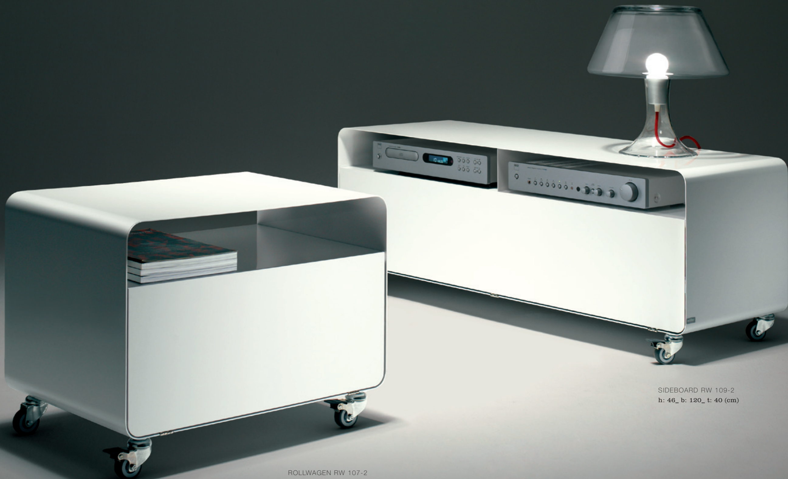
ROLLWAGEN RW 107-2 h: 46_ b: 60_ t: 40 (cm)

Beautiful individual pieces, all favourites. The sideboards and castor-mounted units in the mobile line series create a fresh new look in a room whether they are used individually or in combination. We supply all our sideboards with aluminium runners or on castors with stoppers. Our small castor-mounted units are perfectly designed for a hundred different uses – open or closed, with or without soft-stopper doors or with a rear panel and cable slot. And they are so strong that you can even sit on them.