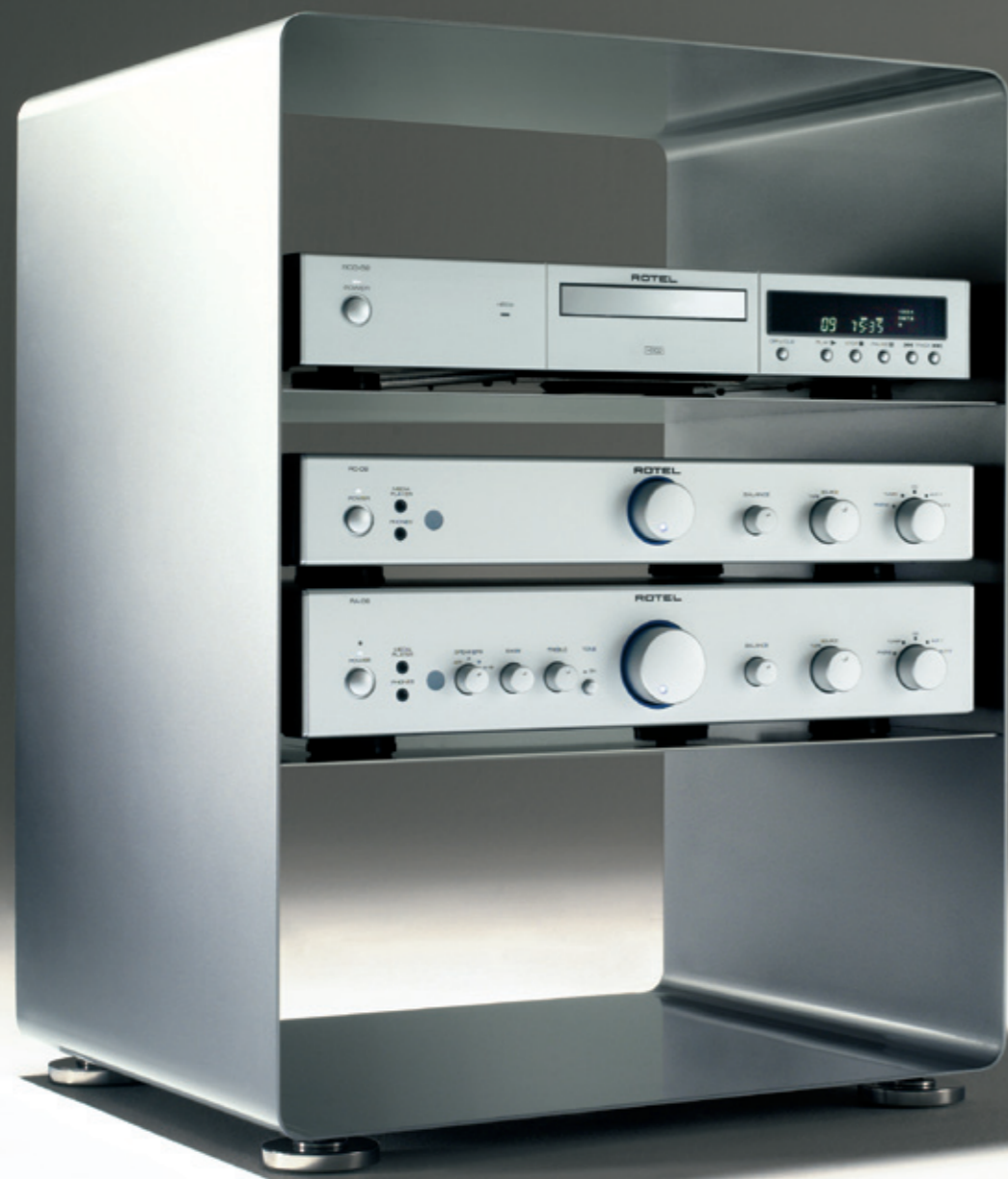
HIFI-RACK RW 600-1 h: 62,5_ b: 47,5_ t: 40 (cm)