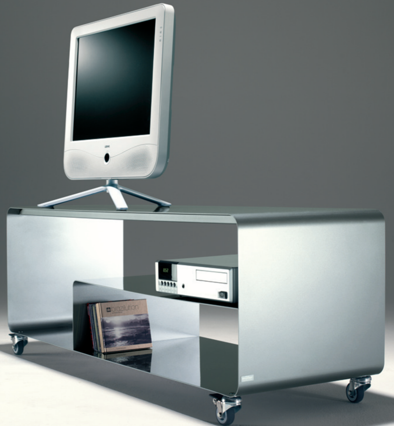
SIDEBOARD RW 111-2 h: 46_ b: 120_ t: 40 (cm)