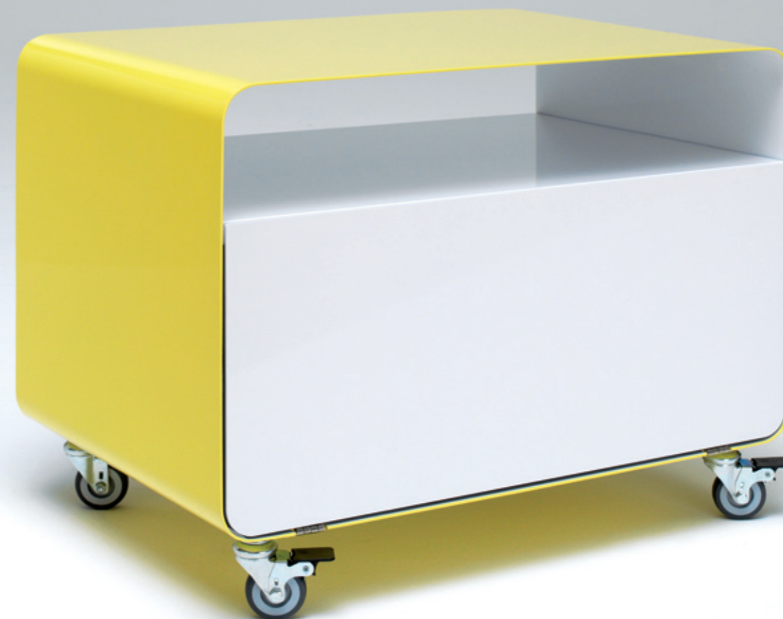
ROLLWAGEN RW 107-2 h: 46_ b: 60_ t: 40 (cm)