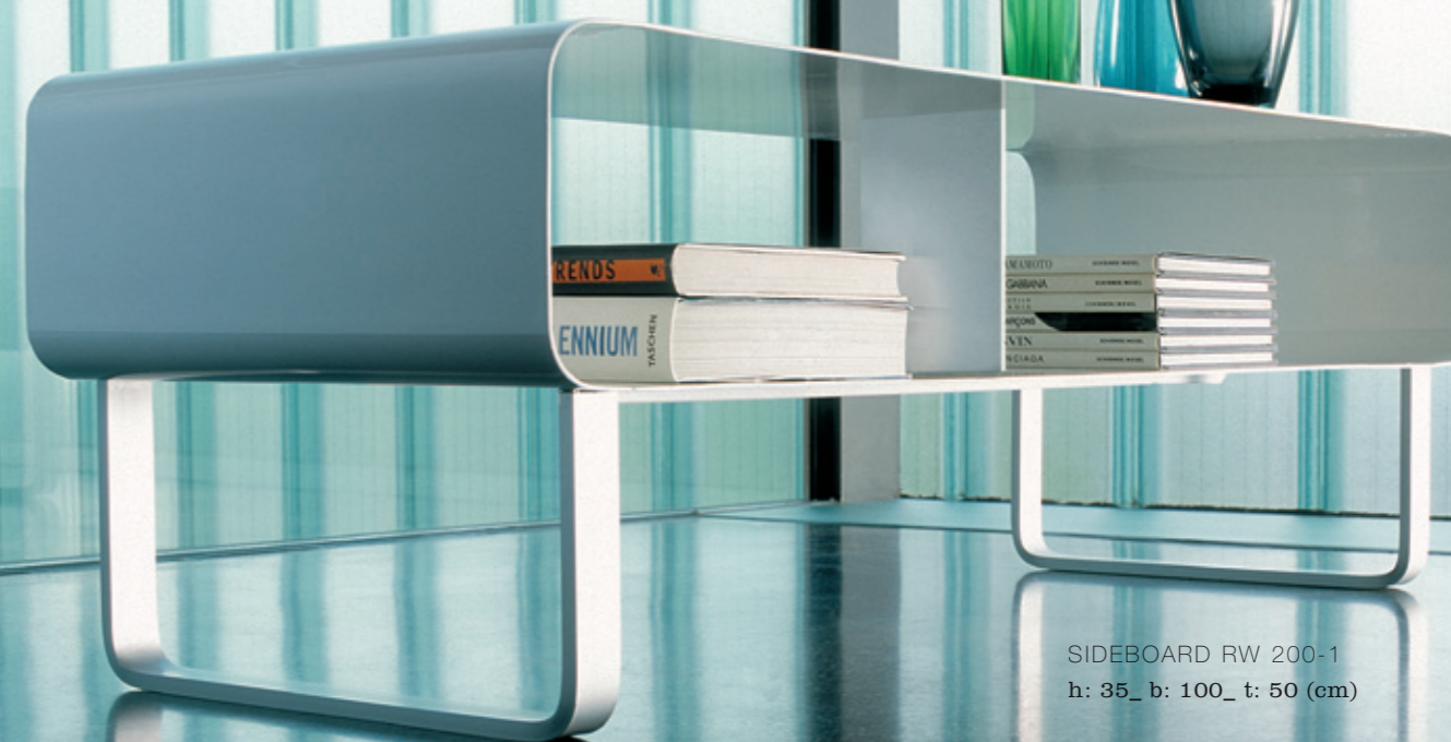
SIDEBOARD RW 200-1 h: 35_ b: 100_ t: 50 (cm)

What you want, where you want it. Mobile line is a design idea for beauty, functionality and individuality in one. Light, mobile and sturdy, the pieces of furniture will bring sparkle wherever they are positioned. The 2.5 mm metal is machined by us using a manual press, welded by hand and finished in all RAL colours – also by hand. Mobile line furniture is durable and strong and will fit in with any new home or workplace design.