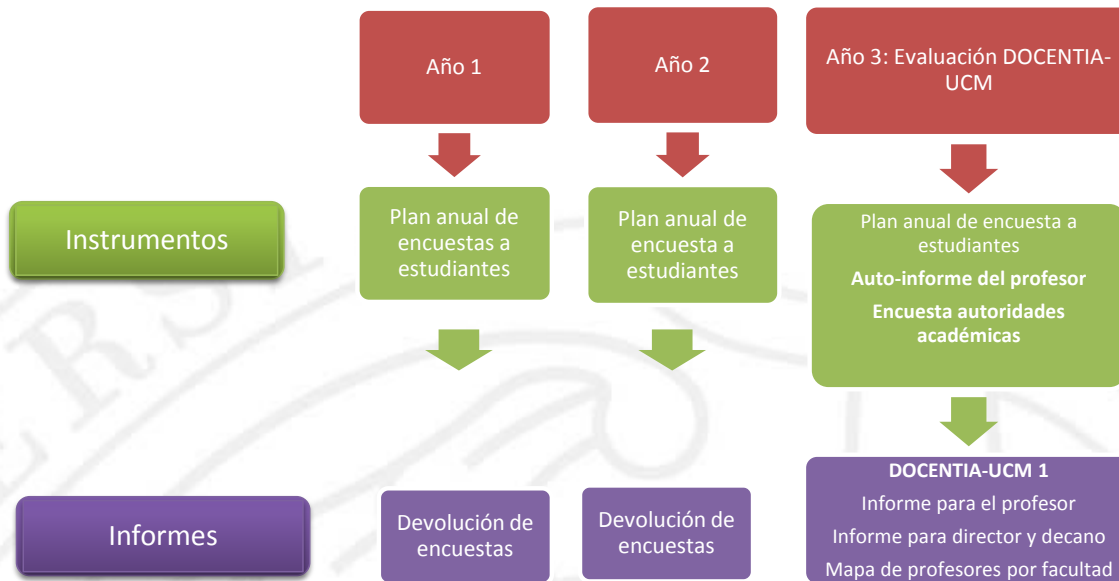
Figura 1. Procedimiento operativo del Programa DOCENTIA-UCM

La evaluación se desarrollará en las siguientes fases: