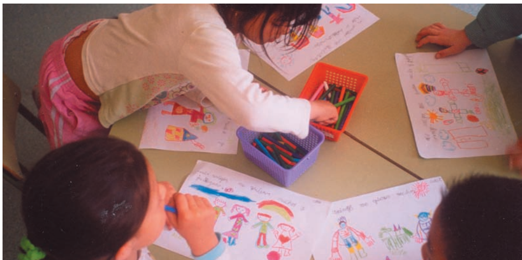
Dibujamos un cuento y escribimos el título