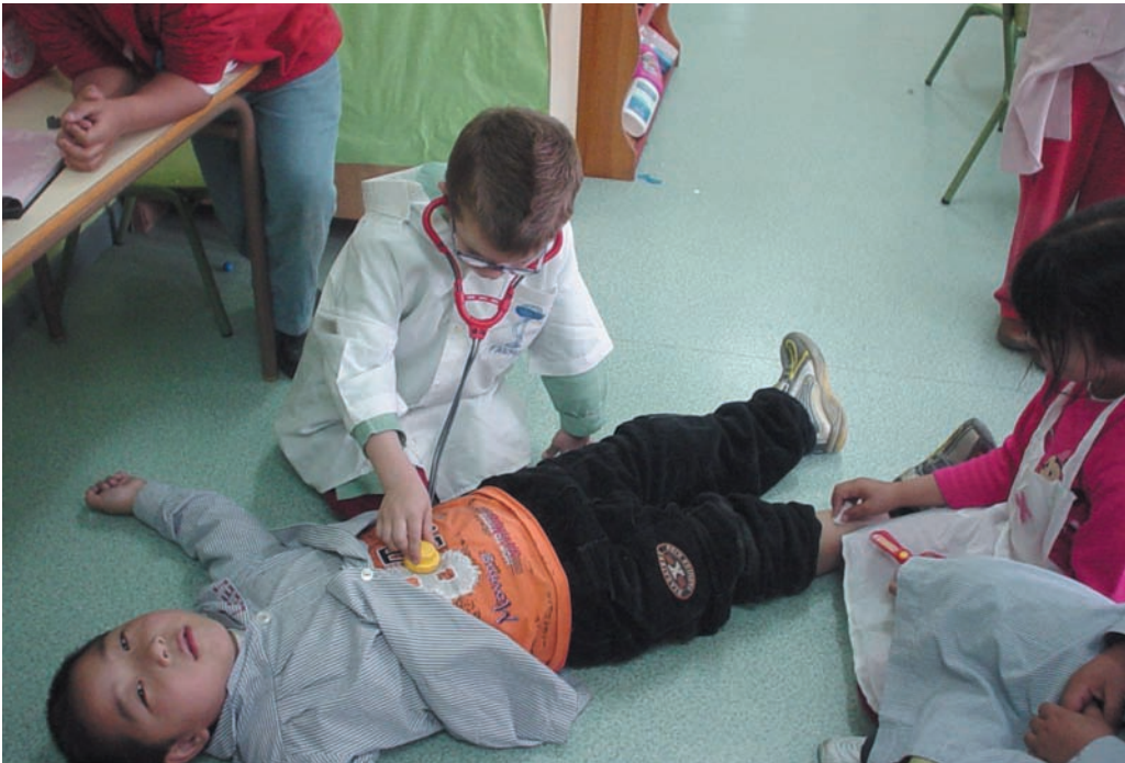
Atención médica en el rincón del Clínico