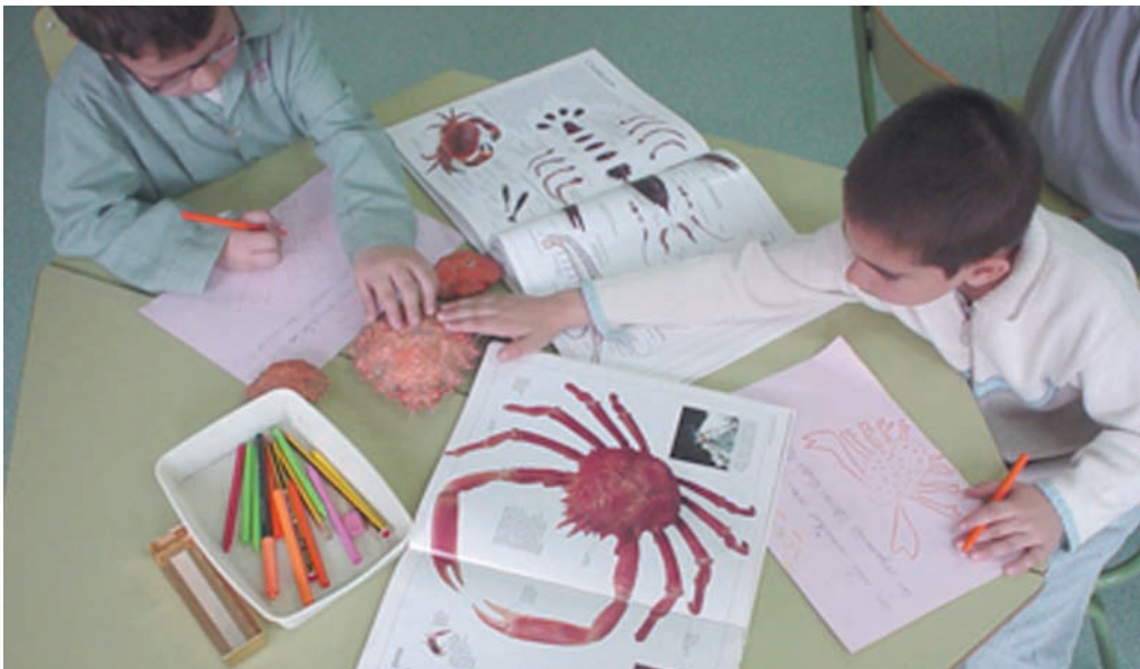
Buscamos información sobre algunos mariscos