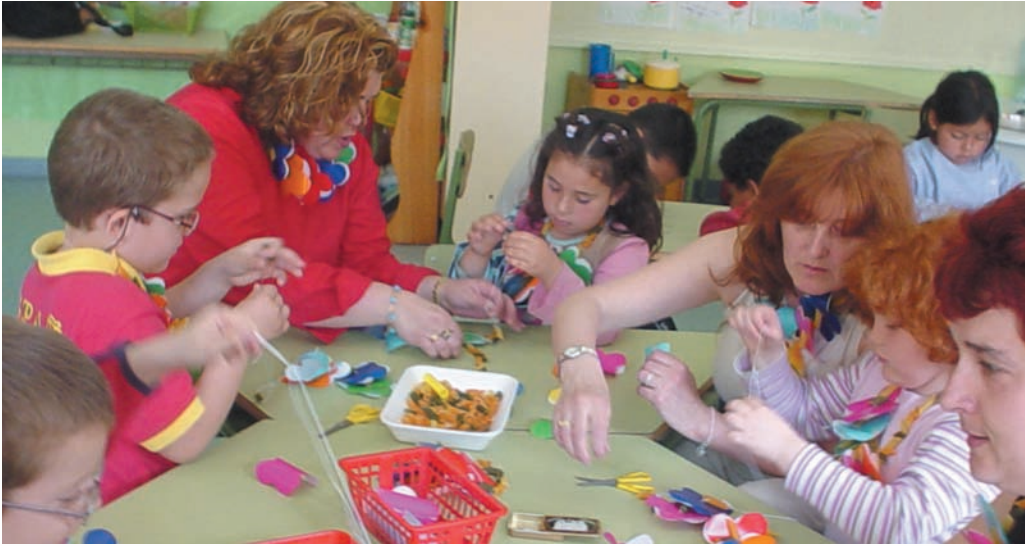
Trabajamos con las mamás en el taller de plástica