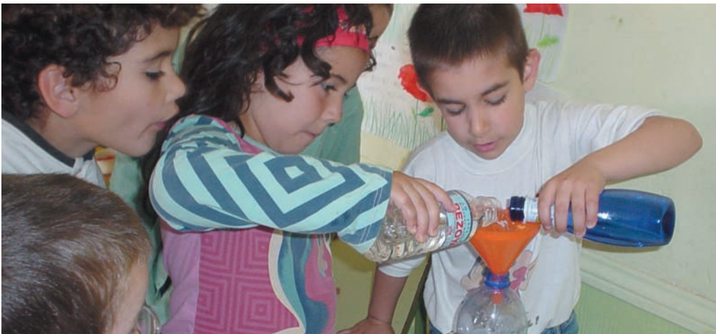
Con las botellas, medimos el agua