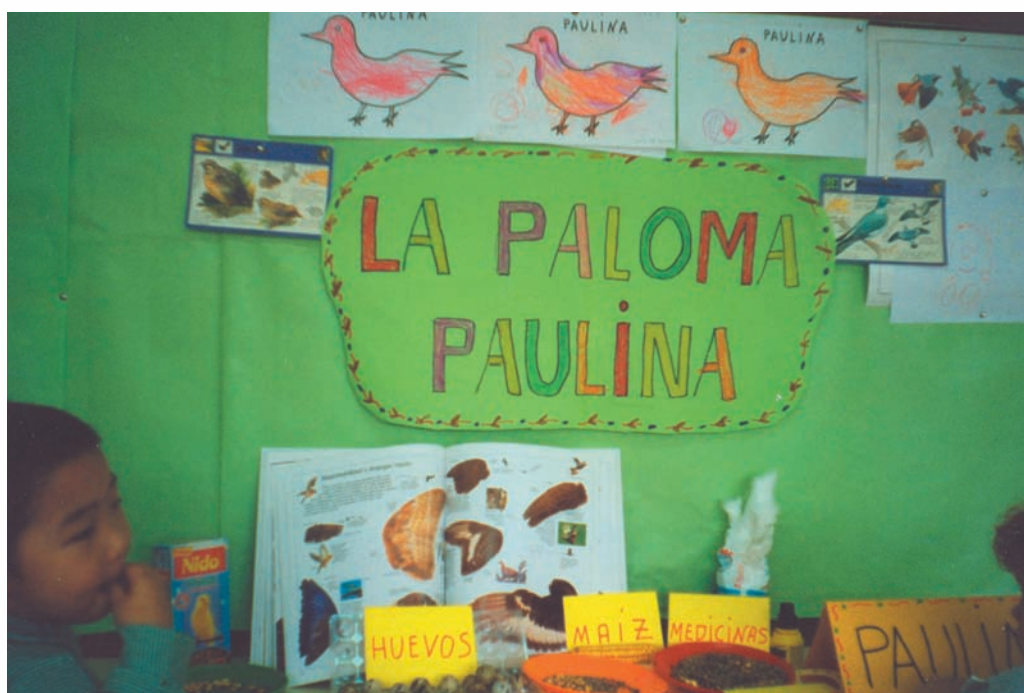
Proyecto de trabajo sobre una paloma herida, la curamos y aprendimos mucho sobre ella