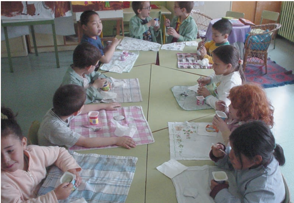
Cada día almorzamos algo sano y variado