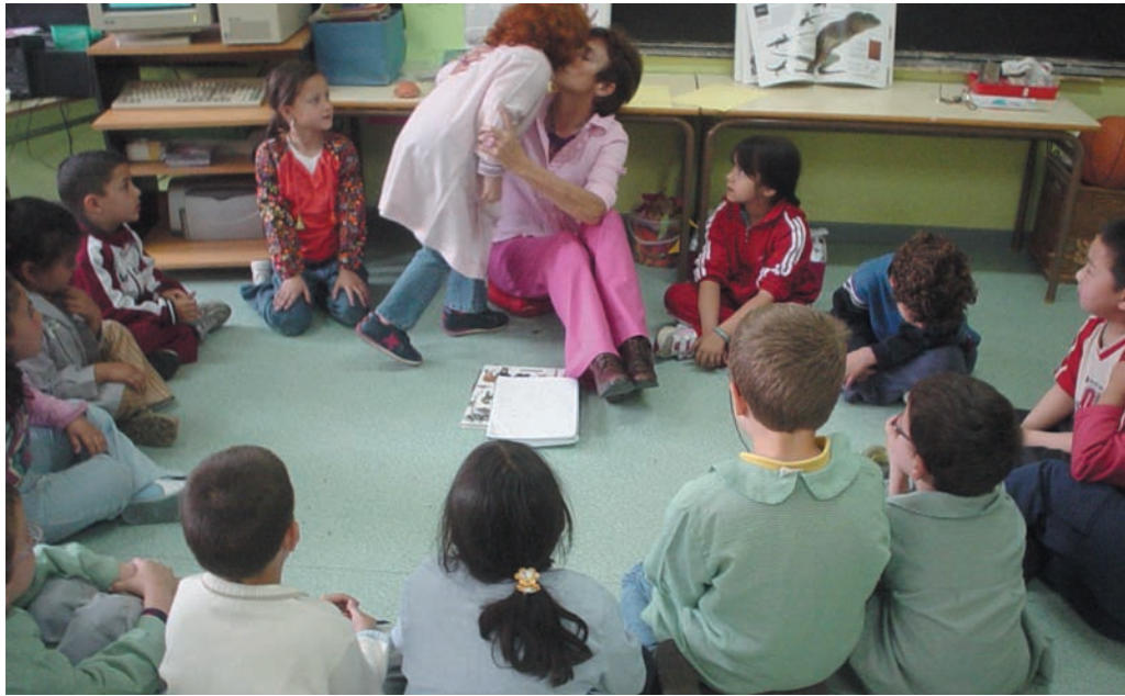
El beso y los buenos días son la actividad inicial en la jornada escolar

Muy relacionado con el clima de aula están los diferentes tipos de agrupamientos que se utilizan para organizar el trabajo cotidiano en el aula: