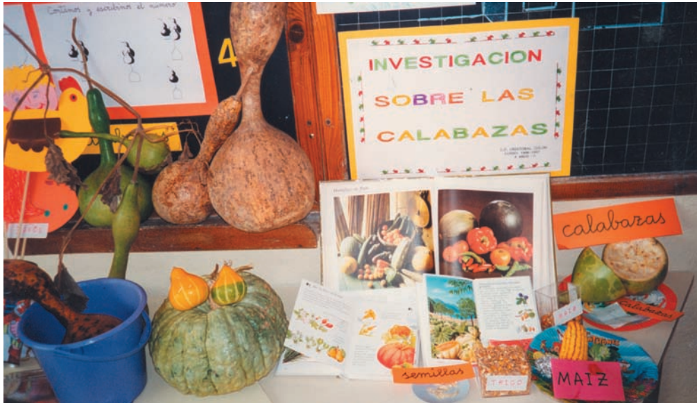
Desarrollamos un proyecto de trabajo sobre las calabazas

Otro aspecto importante lo constituye el clima del aula desde la perspectiva que generan las relaciones entre las personas que conviven en ella. Por ello, se ha recabado información acerca de cómo son esas relaciones, cómo es la participación de los alumnos en el proceso de enseñanza y aprendizaje y en qué medida se potencia la autonomía del alumno, y las necesidades básicas se atienden y desarrollan. Los indicadores definidos para ello son los siguientes: