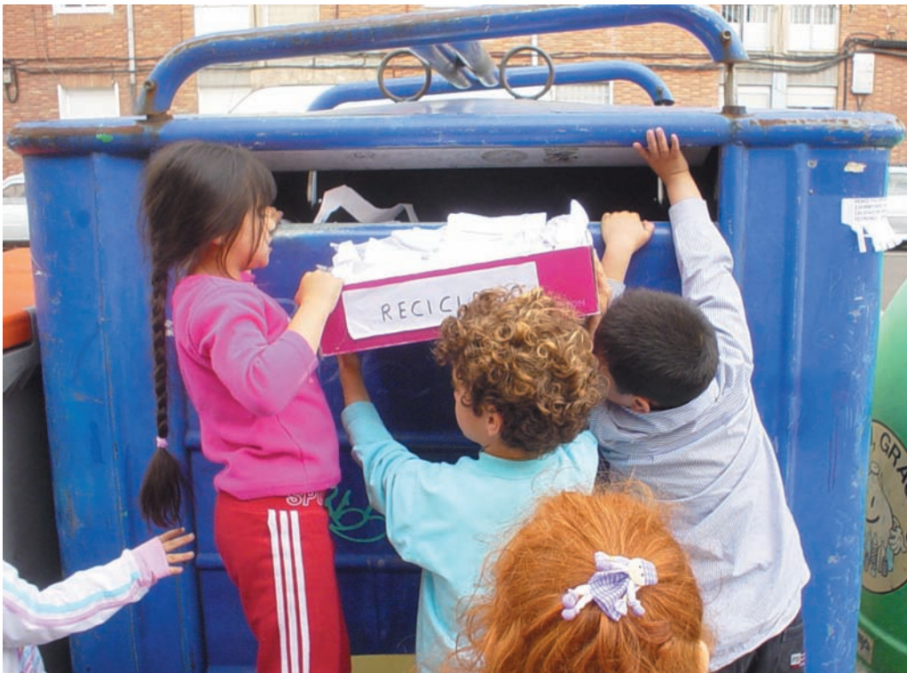
Introducimos el papel blanco en el contenedor para reciclar