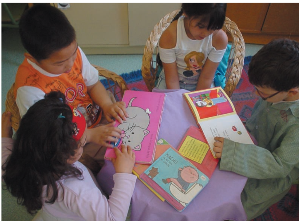
El Rincón de la Lectura es nuestro lugar preferido