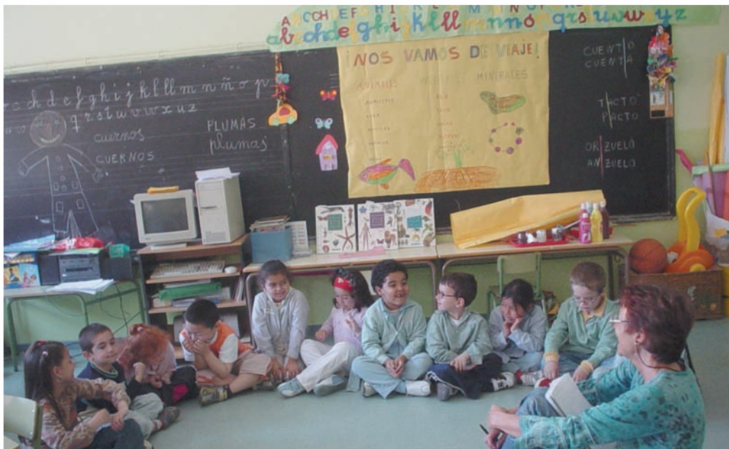
Nos divertimos mucho contando chistes y haciendo rimas