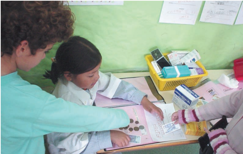
Compro medicinas en el rincón de la farmacia