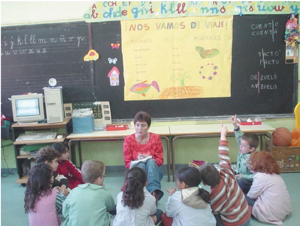
La maestra toma nota en su diario de lo que cuentan los niños