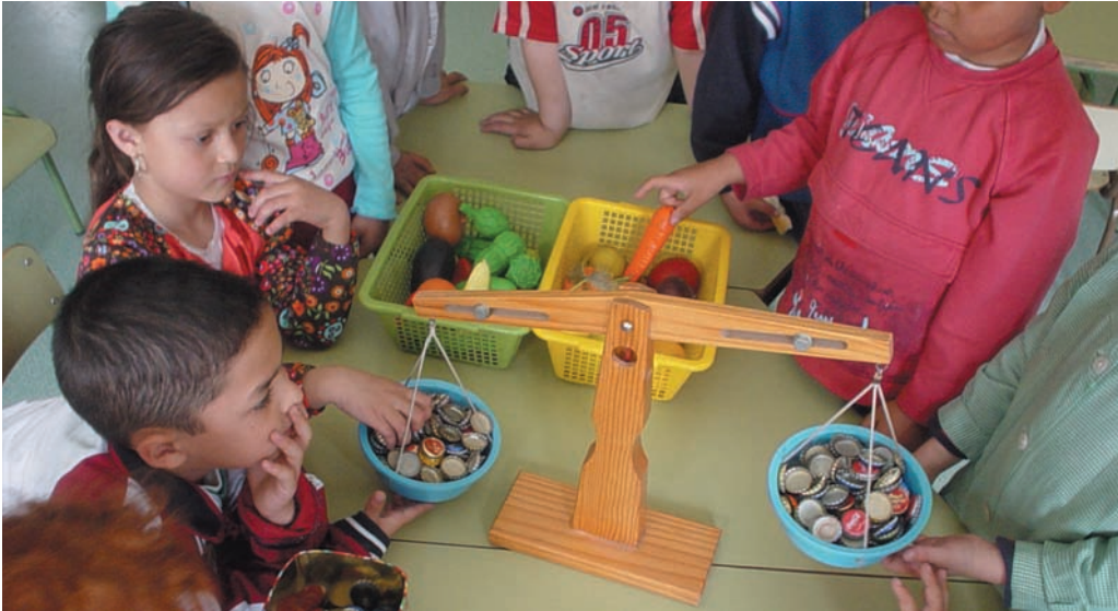
Con las chapas, intentamos nivelar la balanza

Sobre la organización y calidad de los espacios en el aula se seleccionaron los siguientes indicadores: