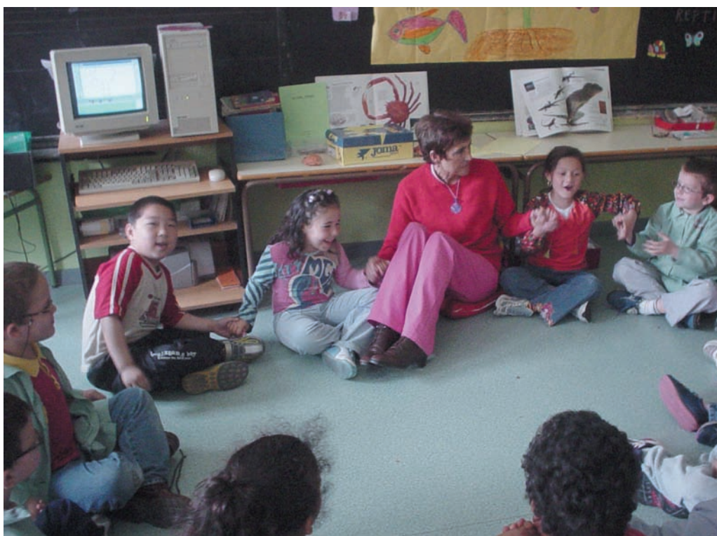
Lo pasamos muy bien con nuestra profesora