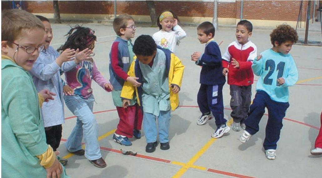
Intentamos con ilusión y esfuerzo, aprender un juego