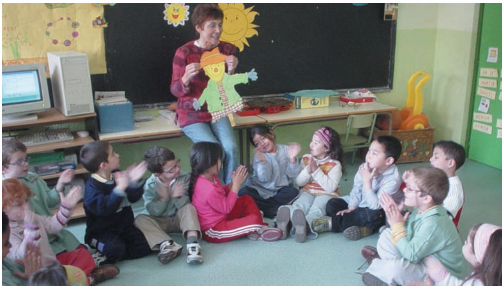
Disfrutamos y escuchamos con atención el cuento narrado por la maestra