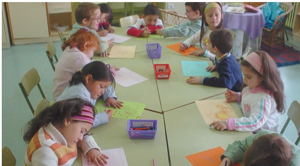
Gran grupo: Todos trabajamos sobre el cuento que nos escenificó la maestra