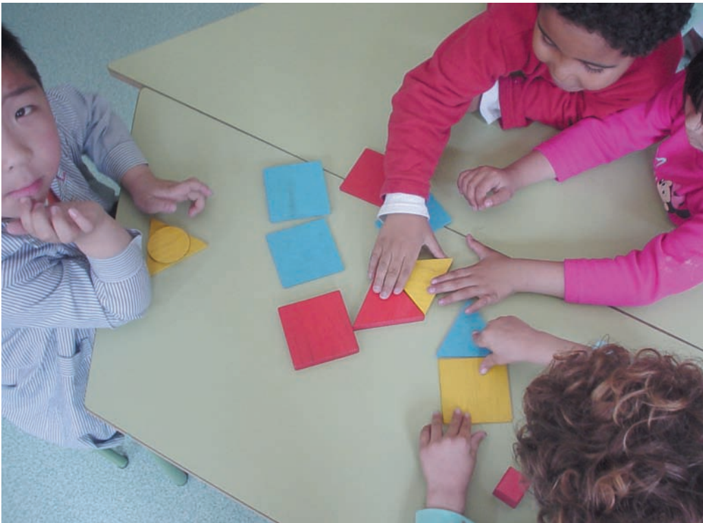
Aprendemos a diferenciar el nombre de algunas figuras geométricas