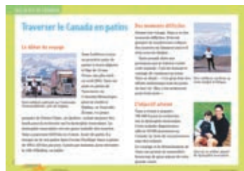
Affiche de lecture partagée