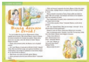
Affiche de lecture partagée