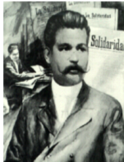
MARCELO H. DEL PILAR

Sa araling ito, iyong makikilala si Marcelo H. del Pilar. Alamin mo ang tungkol sa kanya. Isang makabuluhang pagbabasa at pag-aaral!