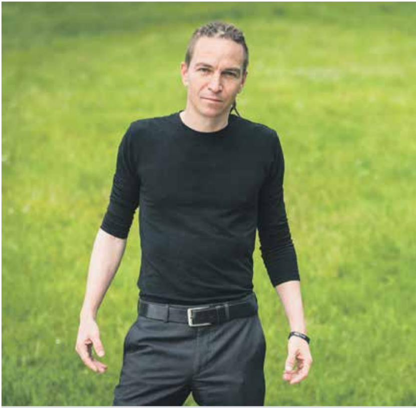
Předseda Pirátské strany Ivan Bartoš

Krajské volby připomínají pohádkovou Popelku – ve srovnání s prezidentskými a sněmovními sestrami jsou přehlíženy a hrají tak roli podceňovaného otlučánka. Ve skutečnosti