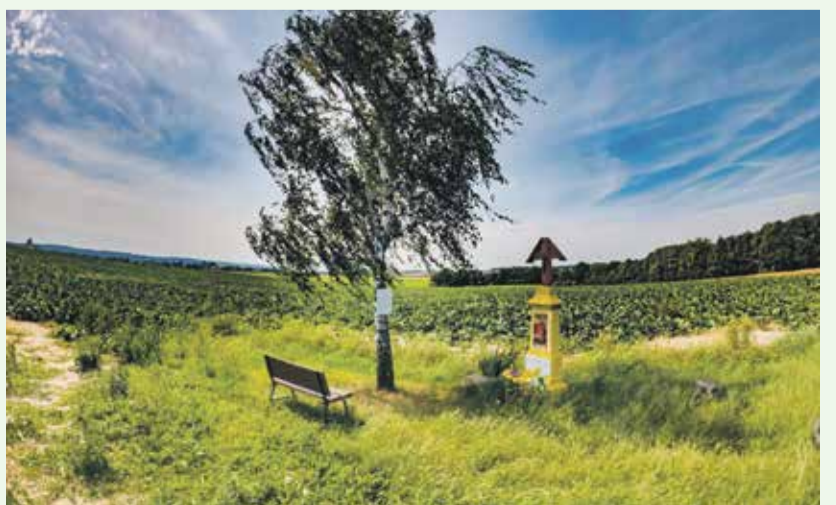
Nádherné odpočinkové místo na hranici Markvartovic a Hlučína