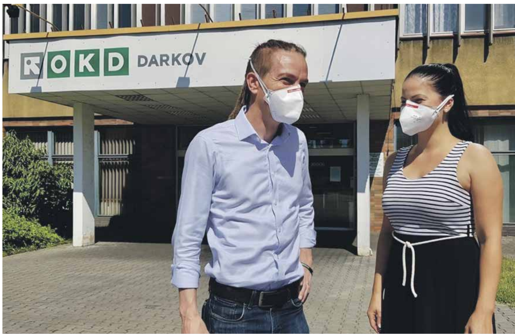
Krizovou situaci v Karviné se přijel zabývat i předseda strany Ivan Bartoš