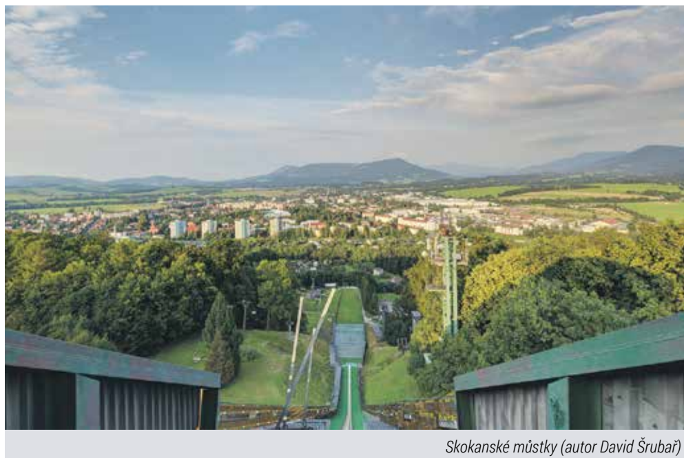
Skokanské můstky (autor David Šrubař)