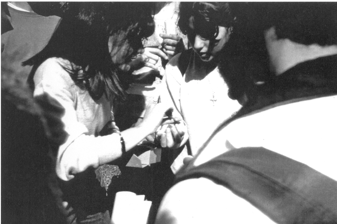
Fig. 5.- Observación de fragmentos cerámicos de época romana y medieval.