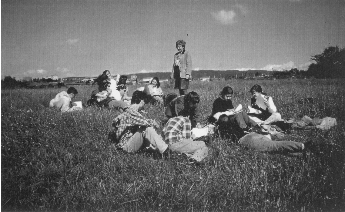
Fig. 4.- Nociones orientativas y resolución de un cuestionario por medio de la observación directa del yacimiento.