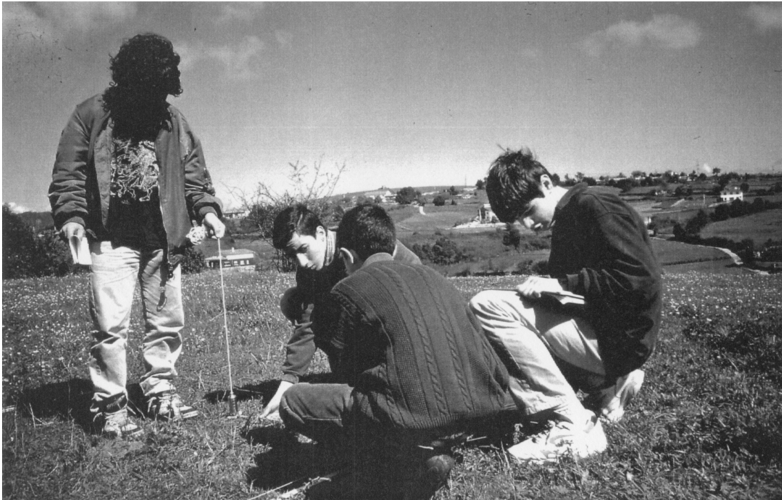
Fig. 3.- Práctica experimental en el yacimiento.