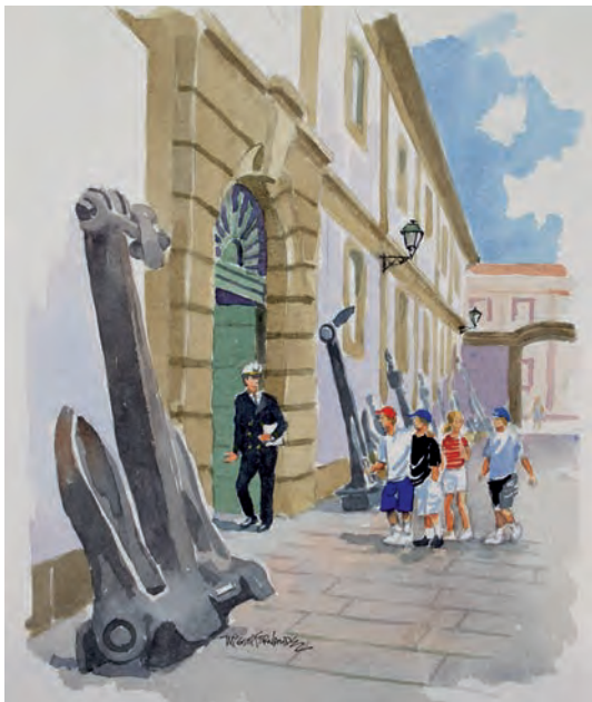
Museo Naval de Ferrol. Acuarela de Miguel Ángel Fernández.

Antes de analizar en particular el Museo Naval de Ferrol —objeto de este estudio—, creemos necesario para situar bien al lector en el contexto que lo define describir sucintamente la estructura del Museo Naval en su conjunto, en el cual está integrado y al que pertenece como museo filial de Ferrol.