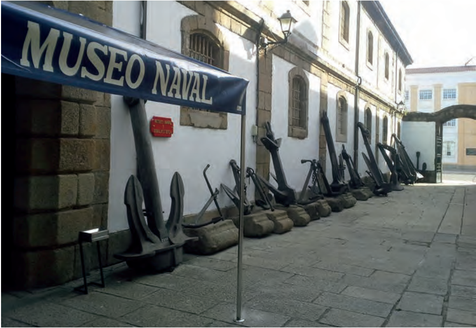
Un aspecto de la exposición de anclas en el acceso al Museo desde la puerta pórtico.

obras más complejas y monumentales del siglo XVIII español —desde el punto de vista histórico-patrimonial—, y que representa también el paradigma de lo que fue capaz de hacer la Marina de la Ilustración.