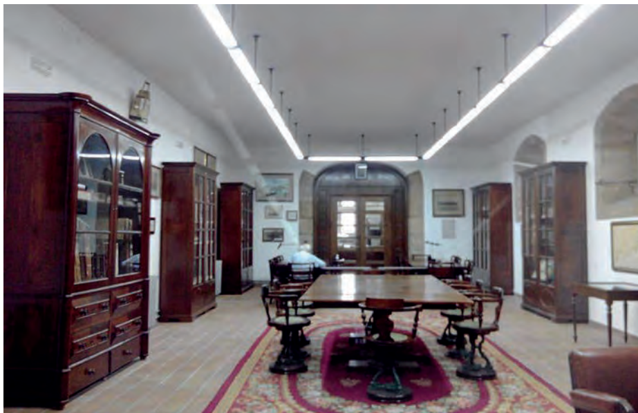
Un aspecto de la Sala de Lectura e Investigación.

Biblioteca son: cartas náuticas, planos de edificaciones, planos de buques, láminas y grabados, álbumes de fotos, vídeos, documentales en formato CD y otras colecciones de documentación varia. Los fondos pueden consultarse a través de diversos registros/catálogos (de autores, de materia sistemático, de materia alfabético, de títulos, cronológico, de temas relacionados con Ferrol, etcétera).