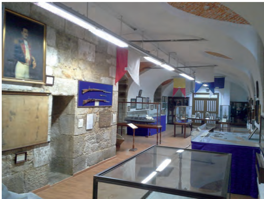
Sala dedicada a las últimas posesiones de Ultramar.