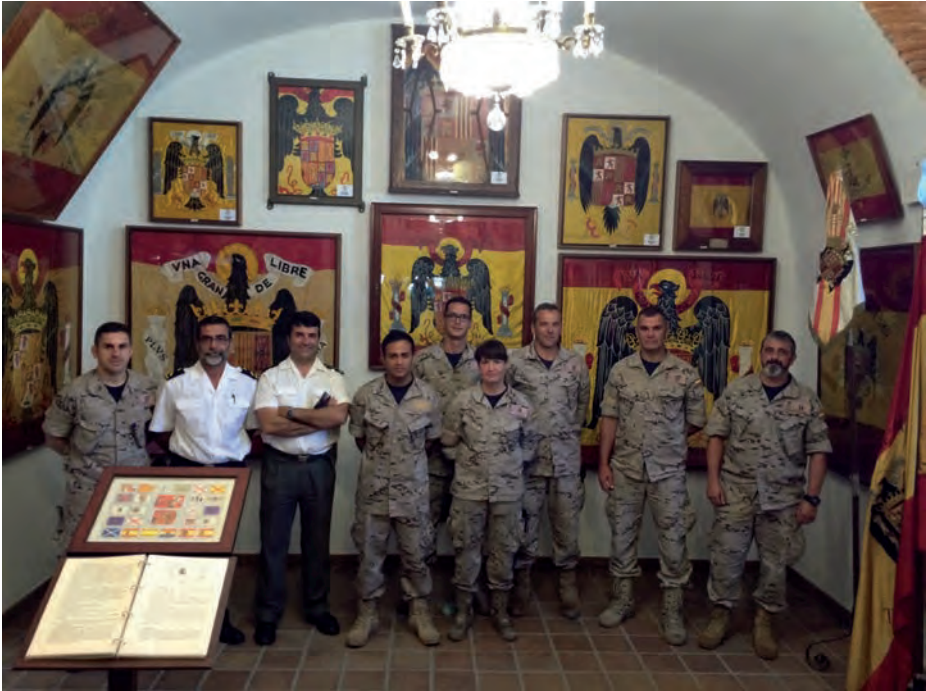
Sala de Banderas. Visita de personal de la Unidad de Buceo de Ferrol.