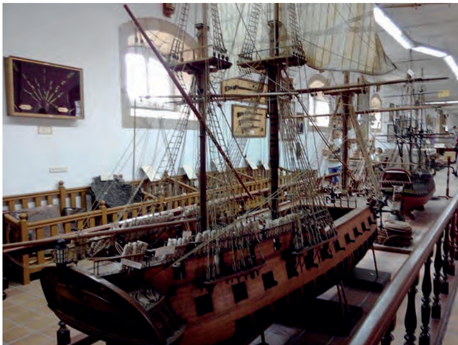
Modelos a escala de la fragata Magdalena y del bergantín Palomo .