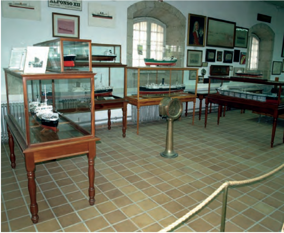
Una parte de la Sala General.