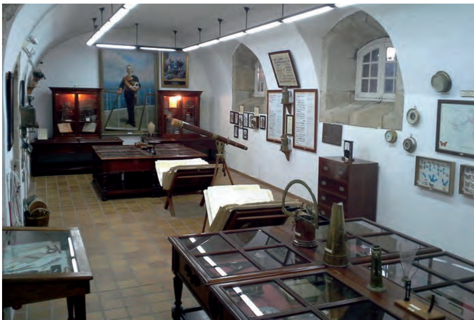
Sala de Navegación y Cartografía.