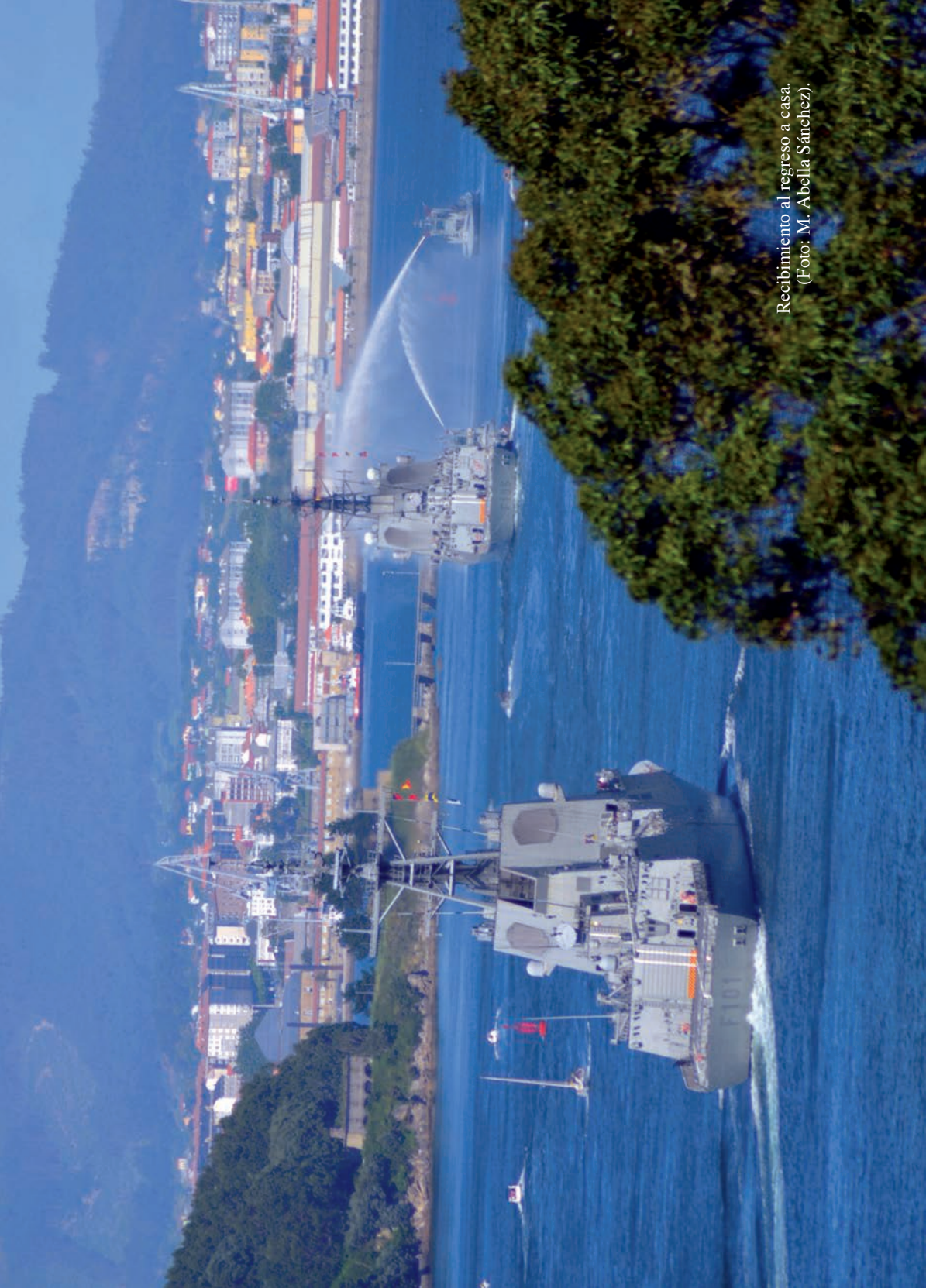
Recibimiento al regreso a casa. (Foto: M. Abella Sánchez).