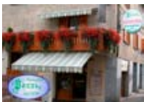
PASTICCERIA Pozzi Pasticceria BORMIO Via IV Novembre, 4 Tel. 0342/901.492 www.bormio.it/via4novembre