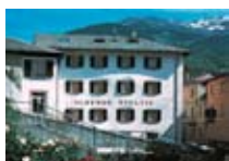
HOTEL *** Stelvio BORMIO Via della Vittoria, 36 Tel. 0342/910.130 www.bormio.it/viadellavittoria