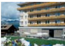
HOTEL**** Schweizerhof PONTRESINA Pontresina CH Tel. 0342/902.424 www.pontresina.org