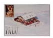
RIFUGIO - RISTORO Palù SANTA CATERINA Località Plagheira Tel. 0342/925.030 www.valfurva.org