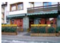
BAR Wish Bar BORMIO Via Al Forte, 16 Tel. 0342/901.353 www.bormio.it/viaalforte