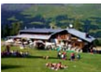
RIFUGIO - RISTORO Paradiso SANTA CATERINA Località Plagheira Tel. 0342/935.417 www.valfurva.org