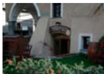
WINE BAR & RESTAURANT Perbacco BORMIO Via Trieste, 24 Tel. 0342/903.373 www.bormio.it/viafrieste