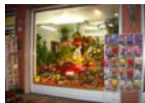
FIORI Fiordelmondo BORMIO Via Milano, 4 Tel. 0342/903.288 www.bormio.it/viamilano