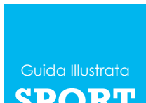
Guida Illustrata SPORT www.valtline.it 0342.902424