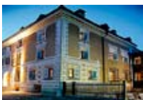
HOTEL*** Chesa Salis BEVER Bever CH Tel. 0342/902.424 www.bever.org