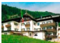
HOTEL ** Belvedere SANTA LUCIA Via Mulino, 7 Tel. 0342/901.589 www.valdisotto.com