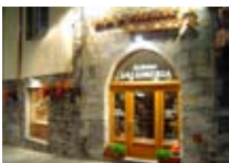
PRODOTTI TIPICI Schena Salumeria BORMIO Piazza Cavour, 3 Tel. 0342.901.262 www.bormio.it/piazzacavour