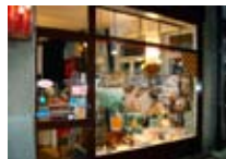
INFORMATICA Net System Tree BORMIO Via della Vittoria, 19a Tel. 0342/902.801 www.bormio.it/viadellavittoria