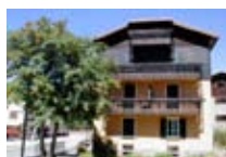
APPARTAMENTI Casa Elda BORMIO Via Funivia, 9 Tel. 0342/910.381 www.bormio.it/viafunivia