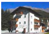
HOTEL ** Giardino BORMIO Via per Piatta, 11 Tel. 0342/903.126 www.bormio.it/viapierpiatta