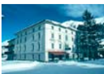
HOTEL*** Acla Filli ZERNEZ Zernez CH Tel. 0342/902.424 www.zernez.com