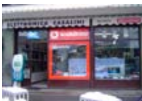
ELETRONICA Casalini BORMIO Via San Vitale, 20 Tel. 0342/901.368 www.bormio.it/viasanvitale