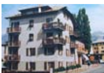
APPARTAMENTI Casa Compagnoni BORMIO Via Peccedi, 8 Tel. 0342/910.195 www.bormio.it/viapeccedi