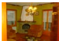
APPARTAMENTI Canclini Adriano BORMIO Via Industrie, 7 Tel. 0342/985.691 www.bormio.it/viaindustrie