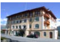
HOTEL*** Soldanella ST. MORITZ St. Moritz CH Tel. 0342/902.424 www.sanktmoritz.org