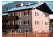
APPARTAMENTI Casa Lucia BORMIO Via Molini, 11 Tel. 0342/904.433 www.bormio.it/viamolini