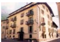
HOTEL ** Dante Meublé BORMIO Via Trieste, 2 Tel. 0342/901.329 www.bormio.it/viatrieste