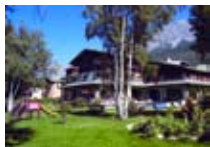
HOTEL *** Nevada BORMIO Via Btg. Morbegno, 21 Tel. 0342/910.888 www.bormio.it/viabtgmborgno