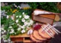
PRODOTTI TIPICI Al Kambrin BORMIO Via De Simoni, 56 Tel. 0342/905.385 www.bormio.it/viadesimoni