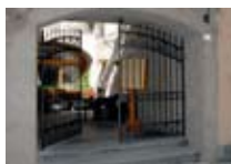
RISTORANTE PIZZERIA Contado BORMIO Via Della Vittoria, 6 Tel. 0342/904.187 www.bormio.it/viadellavittoria