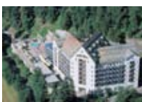
HOTEL*** Schweizerhof SILS Sils CH Tel. 0342/902.424 www.sils.biz