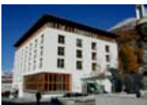
HOTEL*** Allegria PONTRESINA Pontresina CH Tel. 0342/902.424 www.pontresina.org