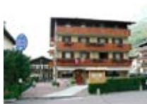
HOTEL *** Olimpia BORMIO Via Funivia, 39 Tel. 0342/901.510 www.bormio.it/viafunivia