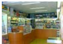
TABACCHI, RIC. LOTTO Spechenhauser BORMIO Via Milano, 83 Tel. 0342/901.321 www.viaroma.bormio.it