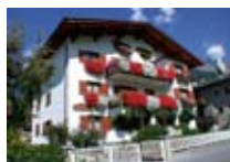
APPARTAMENTI Baita Diana BORMIO Via Sant Antonio, 12 Tel. 0342/903.793 www.bormio.it/viasantantonio