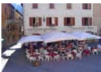
RISTORANTE PIZZERIA Kuerc BORMIO Piazza Cavour, 7 Tel. 0342/910.787 www.bormio.it/piazzacavour