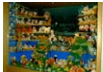
GIOCATTOLE Gran Bazar BORMIO Via Roma, 41 Tel. 0342/902.302 www.viaroma.bormio.it