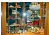
PRODOTTI TIPICI Casa della Bresola BORMIO Via Roma, 103 Tel. 0342/901.642 www.viaroma.bormio.it