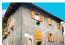
APPARTAMENTI Casa Fumagalli BORMIO Via Monte Grappa, 2 Tel. 0342/902.417 www.bormio.it/viamontegrappa