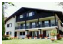
HOTEL *** La Baitina Meublé BORMIO Via Peccedi, 26 Tel. 0342/903.022 www.bormio.it/viapeccedi