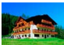
HOTEL *** Cevedale SANTA CATERINA Via Magliaga, 15 Tel. 0342/935.564 www.valfurva.org