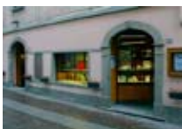
GIOIELLERIA Valentino BORMIO Via Roma, 59 Tel. 0342/901.380 www.viaroma.bormio.it