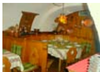
RISTORANTE Vecchia Combo BORMIO Piazza Crocefisso, 4 Tel. 0342/901.568 www.bormio.it/piazzacrocefisso