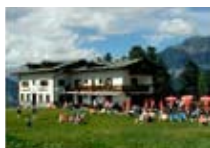
HOTEL *** Cedrone BORMIO 2000 Bormio 2000 Tel. 0342/902.317 www.valdisotto.com