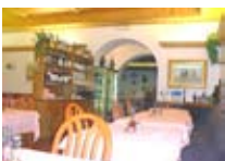
RISTORANTE PIZZERIA La Nuova Pastorella BORMIO Via Roma, 20 Tel. 0342/901.253 www.viaroma.bormio.it