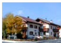
APPARTAMENTI Casa Cecilia BORMIO Via Parri, 12 Tel. 0342/903.352 www.bormio.it/viaparri