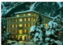
HOTEL*** Bernina PONTRESINA Pontresina CH Tel. 0342/902.424 www.pontresina.org