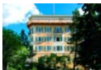
HOTEL*** Müller PONTRESINA Pontresina CH Tel. 0342/902.424 www.pontresina.org