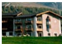
HOTEL Miragolf Residence MADULAIN Madulain CH Tel. +41 (0)81.851.21.71 www.madulain.com