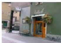
OREFICERIA Vitali BORMIO Via Roma, 97 Tel. 0342/901.396 www.viaroma.bormio.it