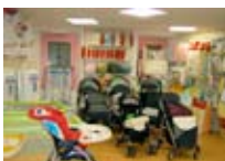
ABB.BIMBI-PUERICULTURA Peter Pan BORMIO Via Roma, 55 Tel. 0342/911.084 www.viaroma.bormio.it

ABBIGLIAMENTO TEMPO LIBERO La Pelle BORMIO Via Santa Barbara, 1 Tel. 0342/902.310 www.bormio.it/viasantabarbara