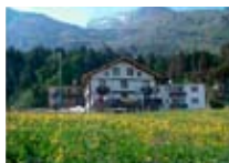
HOTEL Longhin MALOJA Maloja CH Tel. 0342/902.424 www.maloja.biz