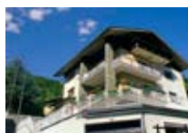
APPARTAMENTI Belvedere BORMIO Via Belvedere, 16 Tel. 0342/567.314 www.bormio.it/viabelvedere