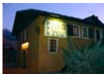
PUB Clem Pub BORMIO Via Fiera, 4 Tel. 0342/903.109 www.bormio.it/viafiera