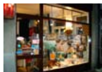
PROFUMERIA VALIGERIA La Rosa d'Oro BORMIO Via XXV Aprile, 5 Tel. 0342/901.595 www.bormio.it/via25aprile