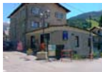
DVD - FILM - TELEFONIA Video Record BORMIO Via Molini, 17a Tel. 0342/910.961 www.bormio.it/viamolini