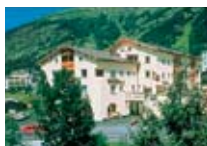
HOTEL*** Garni Chesa Mulin PONTRESINA Pontresina CH Tel. 0342/902.424 www.pontresina.org