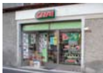
PRODOTTI TIPICI Crai Alimentari SAN NICOLÒ Via San Nicolò Tel. 0342/945.623 www.valfurva.org