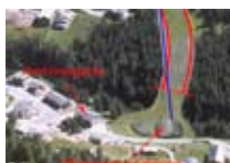
HOTEL *** Genzianella SANTA CATERINA Via Santa Caterina, 31 Tel. 0342/925.092 www.valfurva.org