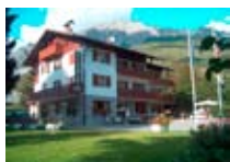
HOTEL *** Cima Bianca Meublé BORMIO Via Credaro, 5 Tel. 0342/901.449 www.bormio.it/viacredaro