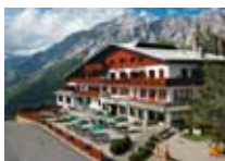
HOTEL *** Vallechiara CIUK Ciuk Tel. 0342/904.381 www.valdisotto.com