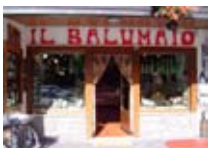
PRODOTTI TIPICI Il Salumaio BORMIO Via Peccedi, 20 Tel. 0342/903.382 www.bormio.it/viapeccedi