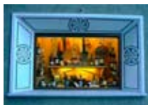
PRODOTTI TIPICI Clem Market BORMIO Via Fiera, 5 Tel. 0342/910.112 www.bormio.it/viafiera