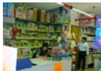
GIOCATTOLE Biancaneve BORMIO Via Milano, 3 Tel. 0342/901.606 www.bormio.it/viamilano