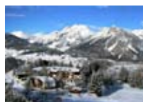
HOTEL *** Baita de Mario CIUK Ciuk Tel. 0342/901.424 www.valdisotto.com