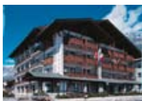
HOTEL *** Derby BORMIO Via Funivia, 15 Tel. 0342/904.433 www.bormio.it/viafunivia