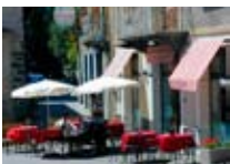
BAR La Piazzetta BORMIO Via Roma, 112 Tel. 0342/903.443 www.viaroma.bormio.it