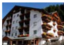
HOTEL *** Nordik SANTA CATERINA Via Frodolfo, 16 Tel. 0342/935.300 www.valfurva.org