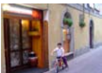
RISTORANTE PIZZERIA Sole BORMIO Via Alberti, 3 Tel. 0342/901.812 www.bormio.it/viaalberti