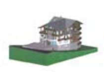
HOTEL **** Vedig SANTA CATERINA Via Vedich, 14 Tel. 0342/935.305 www.valfurva.org