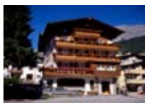
HOTEL *** Contea Garni BORMIO Via Molini, 8 Tel. 0342/901.202 www.bormio.it/viamolini