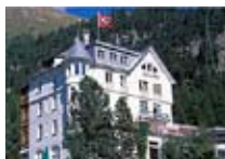
HOTEL**** La Collina PONTRESINA Pontresina CH Tel. 0342/902.424 www.pontresina.org