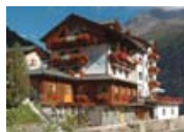
HOTEL **** Baita Fiorita SANTA CATERINA Via Frodolfo, 3 Tel. 0342/925.119 www.valfurva.org