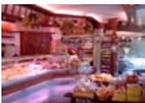
PRODOTTI TIPICI Lumina BORMIO Via Manzoni, 1 Tel. 0342/905.335 www.bormio.it/viamanzoni