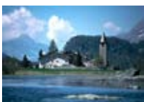
HOTEL*** Chesa Grischa SILS Sils CH Tel. 0342/902.424 www.sils.biz