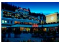
HOTEL**** Europa ST. MORITZ St. Moritz CH Tel. 0342/902.424 www.sanktmoritz.org