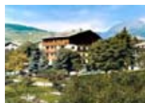
HOTEL *** Nazionale BORMIO Via Al Forte, 28 Tel. 0342/903.361 www.bormio.it/viaalforte