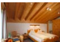
HOTEL*** Randolins ST. MORITZ St. Moritz CH Tel. 0342/902.424 www.sanktmoritz.org