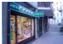
ARTICOLI ORTOPEDICO-SANITARI Sanitas BORMIO Via XXV Aprile, 3 Tel. 0342/903.401 www.bormio.it/via25aprile