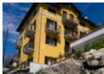
HOTEL *** Sertorelli Reit Meublé BORMIO Via Monte Braulio, 4 Tel. 0342/910.820 www.bormio.it/viamontebraulio