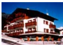
HOTEL *** Iris Residence Meublé CEPINA Via Roma, 58a Tel. 0342/950.439 www.valdisotto.com