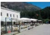
HOTEL** Morteratsch PONTRESINA Pontresina CH Tel. 0342/902.424 www.pontresina.org