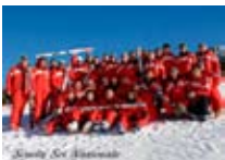
SCUOLA SCI Nazionale BORMIO Via Funivia, 16 Tel. 0342/901.553 www.bormio.it/viafunivia