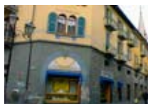
OTTICA Occhi BORMIO Via Roma, 6 Tel. 0342/901.390 www.viaroma.bormio.it