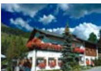
HOTEL*** Engiadina FTAN Ftan CH Tel. 0342/902.424 www.ftan.net