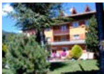
HOTEL *** Sci Sport Residence Meublé BORMIO Via Credaro, 3 Tel. 0342/904.362 www.bormio.it/viacredaro