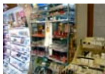
PROFUMERIA Soleil BORMIO Via Roma, 10 Tel. 0342/903.328 www.viaroma.bormio.it