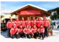
SCUOLA SCI Sertorelli BORMIO Via Piave, 3 Tel. 0342/903.060 www.bormio.it/viapiave