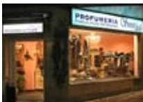
BOUQUETTE PARRUCCHIERA Sweet Life BORMIO Via Roma, 72 Tel. 0342/901.312 www.viaroma.bormio.it