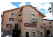
HOTEL** Pensione Croce Bianca SAMEDAN Samedan CH Tel. +41 (0)81.852.53.53 www.samedan.org