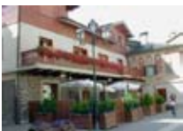
BAR Braulio Bar BORMIO Via Roma, 27 Tel. 0342/904.785 www.viaroma.bormio.it