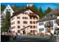
HOTEL*** Privata SILS Sils CH Tel. 0342/902.424 www.sils.biz