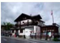
HOTEL** Sporthotel MALOJA Maloja CH Tel. 0342/902.424 www.maloja.biz