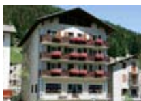
HOTEL *** Compagnoni SANTA CATERINA Via Frodolfo, 1 Tel. 0342/925.105 www.valfurva.org