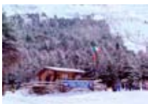
SCUOLA SCI Contea BORMIO Via Btg. Morbegno, 13 Tel. 0342/911.605 www.bormio.it/viabtgorbegno