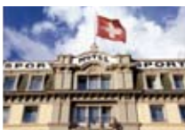
HOTEL*** Sporthotel PONTRESINA Pontresina CH Tel. 0342/902.424 www.pontresina.org