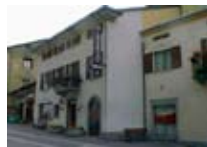
HOTEL *** Silene BORMIO Via Roma, 121 Tel. 0342/905.455 www.viaroma.bormio.it