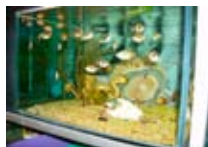
ANIMALI Animal Shop BORMIO Via M. Quadrio, 1 Tel. 0342/901.672 www.bormio.it/viaquadrio