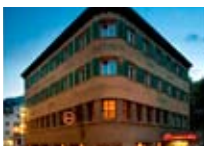
HOTEL*** Donatz SAMEDAN Samedan CH Tel. 0342/902.424 www.samedan.org