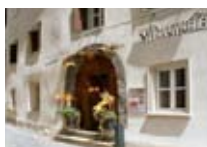
HOTEL*** Palazzo Mysanus SAMEDAN Samedan CH Tel. 0342/902.424 www.samedan.org