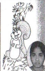
- மதுரகுன்மேரி, IIB.com..